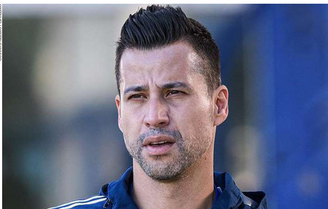
GUSTAVO ALEKSO/ CRUZEIRO

Sem perspectivas de grandes receitas até o fim de 2021 e com uma dívida na casa de R$1 bilhão, o Cruzeiro aposta na criação da Sociedade Anônima do Futebol para captar recursos de investidores e aplicar na formação de um time competitivo. Vanderlei Luxemburgo condicionou a renovação contratual a um projeto que viabilize a manutenção de salários em dia, a revelação de jovens jogadores e a contratação de atletas de Série A. (Superesportes)