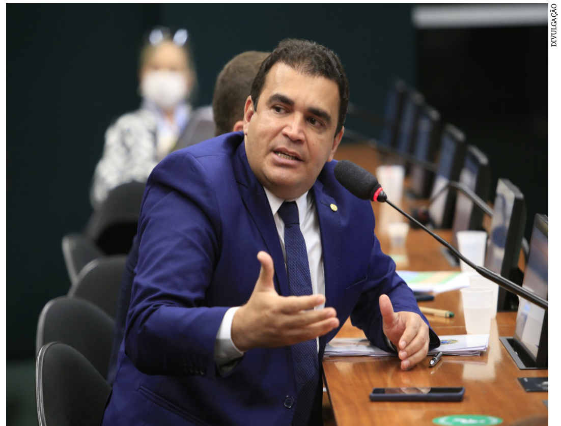
De acordo com o parlamentar, a medida inclui setores da economia que mais empregam no país

ção dos empregos. (GISSELE NIZA – Colaboradora)