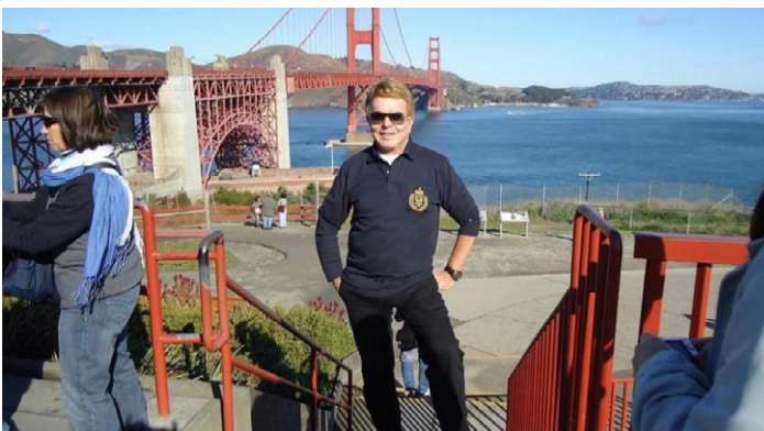
SAUDADES DAS duas viagens que fiz circulando por toda COSTA OESTE DOS ESTADOS UNIDOS. Anos atrás, aí fazendo pose, tendo ao fundo a famosa ponte GOLDEN GATE na cidade de SAN FRANCISCO. Se Deus quiser, no próximo ano, voltarei a viajar para o exterior, pois já estou estressado, porque não é fácil o que estamos vivendo nos últimos dois anos devido a pandemia. Ainda bem que logo que iniciou o período da Covid-19, já estava na monumental, DUBAI e outras cidades dos Emirados Árabes. Viajar e conhecer novos lugares me faz bem e me rejuvenesce.