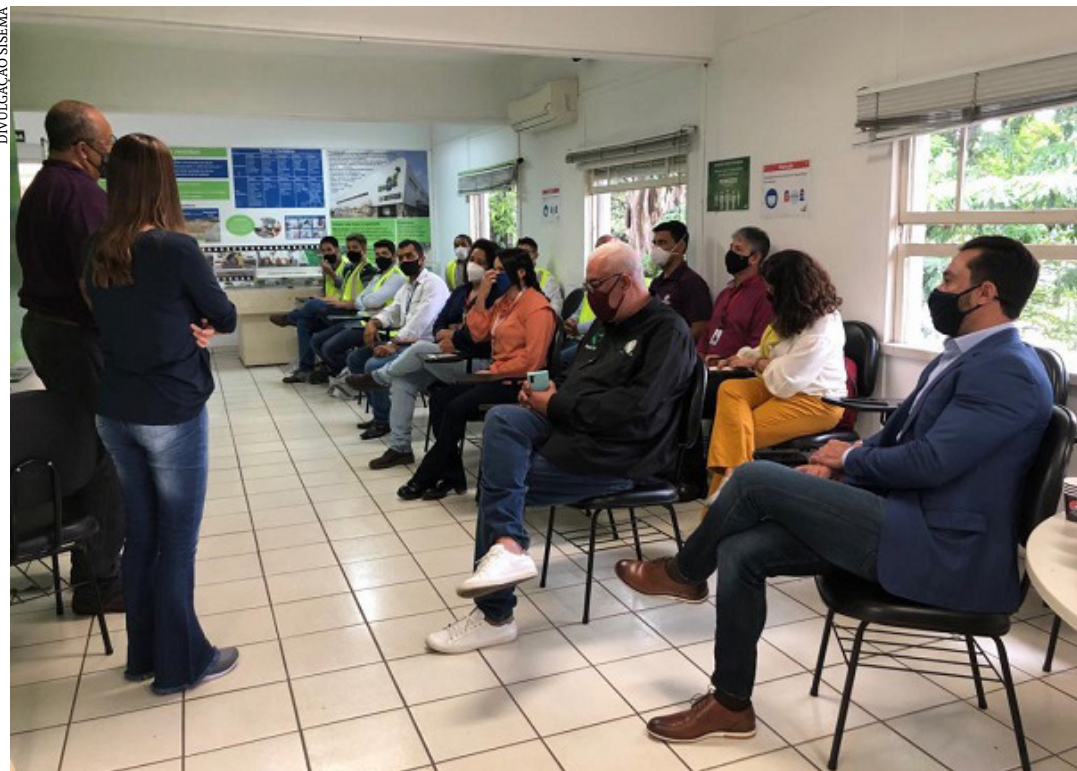
Equipe mineira visitou centrais de triagem mecanizada

Os consórcios que participaram das visitas foram: consórcio União da Serra Geral; Consórcio Intermunicipal Multissetorial do Vale do Piranga (Cimvalpi); Consórcio Regional de Saneamento Básico Central de Minas (Coresab); Consórcio de Desenvolvimento Ambiental do Norte de Minas (Codanorte); CIMME; Consórcio Intermunicipal de Gestão de Resíduos Sólidos (Cigres) e Consórcio Público Intermunicipal de Desenvolvimento Sustentável do Alto Parnaíba (Cispar). (Ascom Sísima)