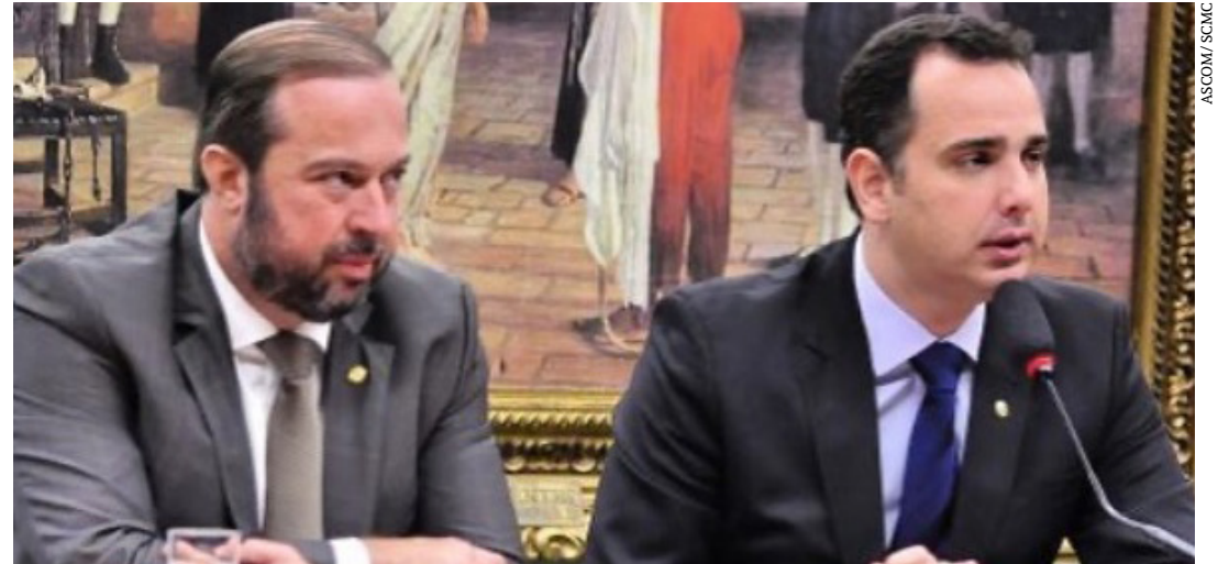
Com extensão total de 67,10 km, obra garantirá mais empregos, renda e desenvolvimento para o Norte de MG