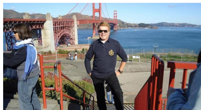
SAUDADES DAS duas viagens que fiz circulando por toda COSTA OESTE DOS ESTADOS UNIDOS. Anos atrás, aí fazendo pose, tendo ao fundo a famosa ponte GOLDEN GATE na cidade de SAN FRANCISCO. Se Deus quiser, no próximo ano, voltarei a viajar para o exterior, pois já estou estressado, porque não é fácil o que estamos vivendo nos últimos dois anos devido a pandemia. Ainda bem que logo que iniciou o período da Covid-19, já estava na monumental, DUBAI e outras cidades dos Emirados Árabes. Viajar e conhecer novos lugares me faz bem e me rejuvenesce.