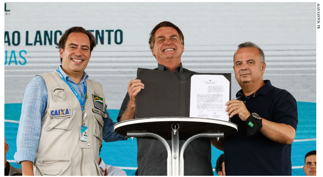
O presidente da Caixa, Pedro Guimarães; Jair Bolsonaro e; o ministro do Desenvolvimento Regional, Rogério Marinho

Com investimento total de R$ 482 milhões, quando concluída, a