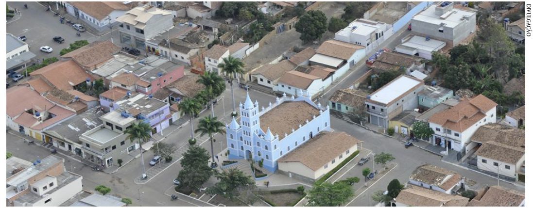
São João do Pacuí é a primeira cidade que recebe neste mês a iniciativa gratuita, depois em João da Lagoa e Coração de Jesus

Coração de Jesus Dias 27, 28 e 29/10 – 8h às 18h Local: Caic - Rua Álvaro Augusto de Leles S/N, Bairro Renovação