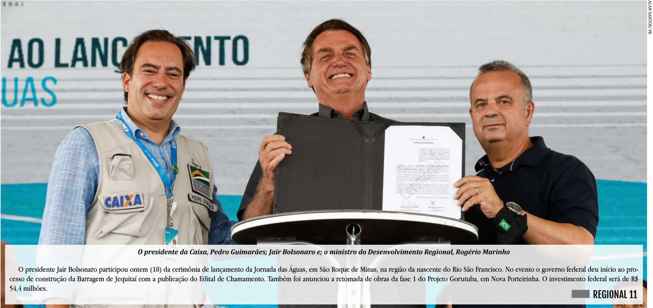
O presidente da Caixa, Pedro Guimarães; Jair Bolsonaro e; o ministro do Desenvolvimento Regional, Rogério Marinho

O presidente Jair Bolsonaro participou ontem (18) da cerimônia de lançamento da Jornada das Águas, em São Roque de Minas, na região da nascente do Rio São Francisco. No evento o governo federal deu início ao processo de construção da Barragem de Jequitáí com a publicação do Edital de Chamamento. Também foi anunciado a retomada de obras da fase 1 do Projeto Gorutuba, em Nova Porteirinha. O investimento federal será de R$ 54,4 milhões.