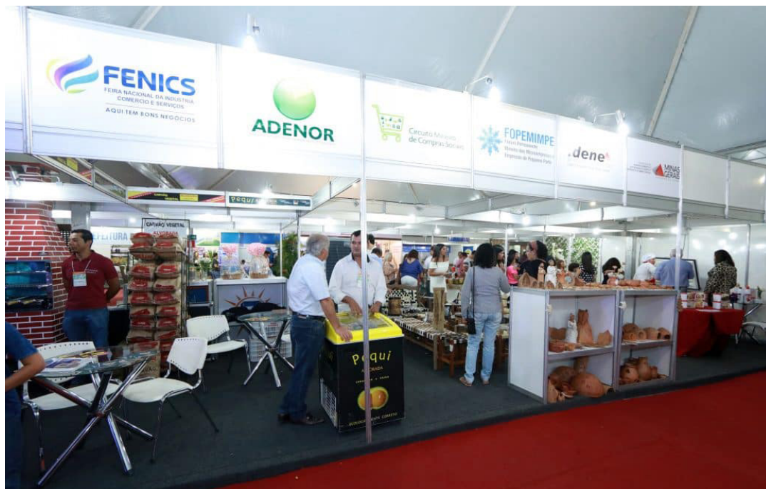
Já são 26 edições ininterruptas da Fenics

A Feira Nacional da Indústria Comércio e de Serviços – FENICS – tem início hoje, com o tema “Conecta as potencialidades de nossa região!”. A feira possui mais de duas décadas de credibilidade, fortalece marcas e lança empreendimentos de áreas diversas. Com 26 edições ininterruptas, desde 2020, em razão da pandemia, a ACI ousou na versão digital. Até quinta-feira, 7 de outubro, espera-se um grande número de visitantes no site fenics.com.br .