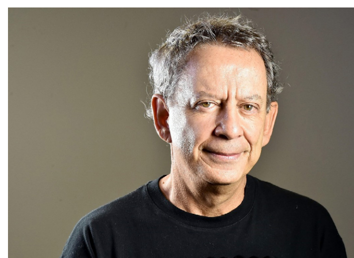
Dolabela irá falar sobre como atuar de forma empreendedora em meio a pandemia

O Banco do Nordeste já aplicou, neste ano, R$ 116,9 milhões para micro e pequenas empresas de Minas Gerais. O valor está pulverizado em 825 operações. Em toda a área de atuação do BNB, são R$ 2,7 bilhões para o segmento de MPE, por meio de 19,5 mil contratos.