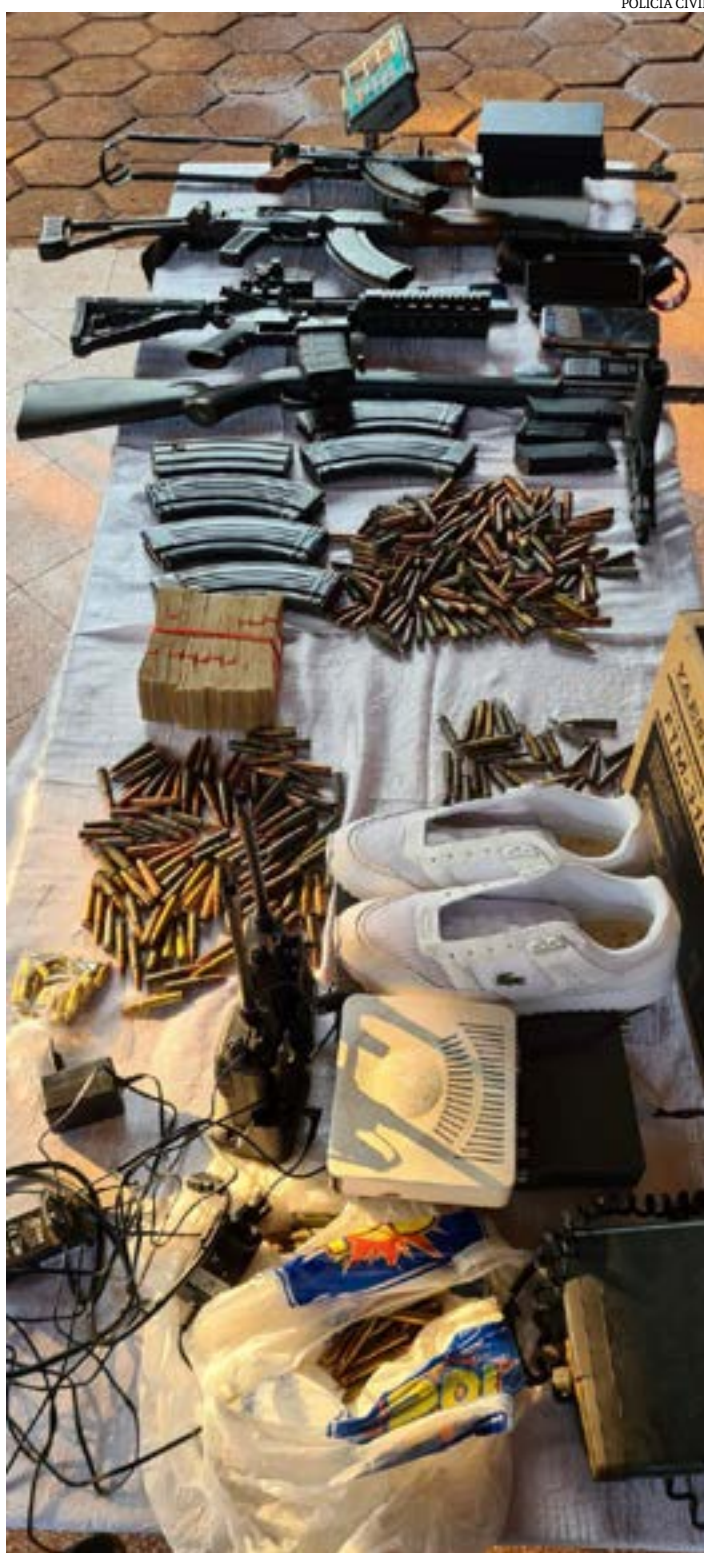
Munições de vários calibres e armas estão entre os itens que foram apreendidas durante ação no Paraguai