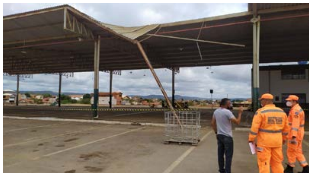
Corpo de Bombeiros e a Defesa Civil estiveram no local neste domingo fazendo vistorias da estrutura