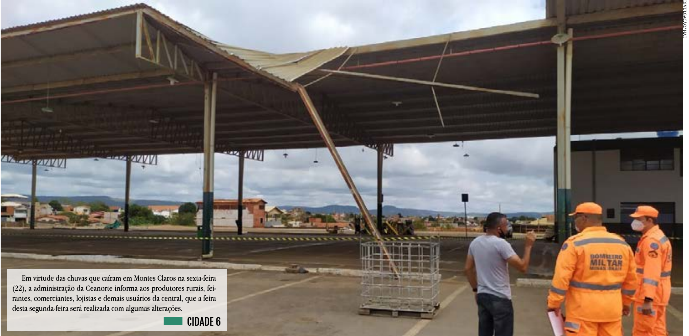
Em virtude das chuvas que caíram em Montes Claros na sexta-feira (22), a administração da Ceanorte informa aos produtores rurais, feirantes, comerciantes, lojistas e demais usuários da central, que a feira desta segunda-feira será realizada com algumas alterações. CIDADE 6