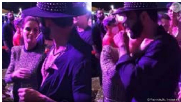
RES DO SHOW

Andressa Suita e Gustavo Lima foram flagrados aos beijos nos bastidores do "Embaixador in Goiânia" desde sábado (23). Discretos quanto à relação, os vídeos que estão circulando do momento foram publicados por páginas de notícias nas redes sociais ou fãs (esses, inclusive, mostraram apoio à volta do casal).