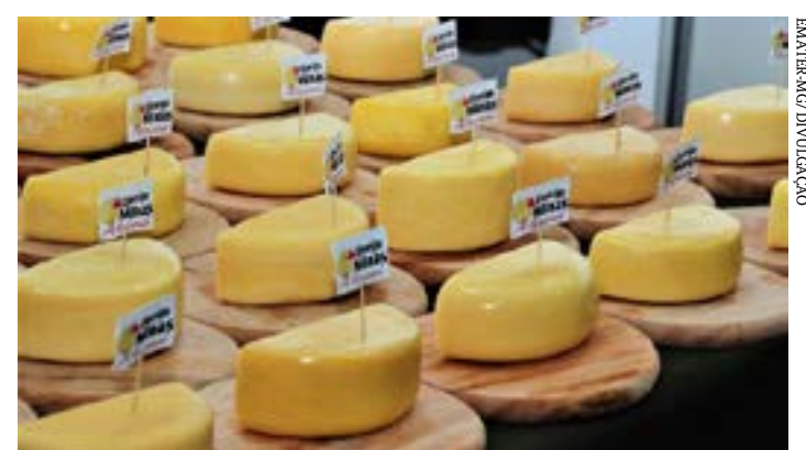
Estão concorrendo 133 queijos, produzidos em diversas regiões do Estado