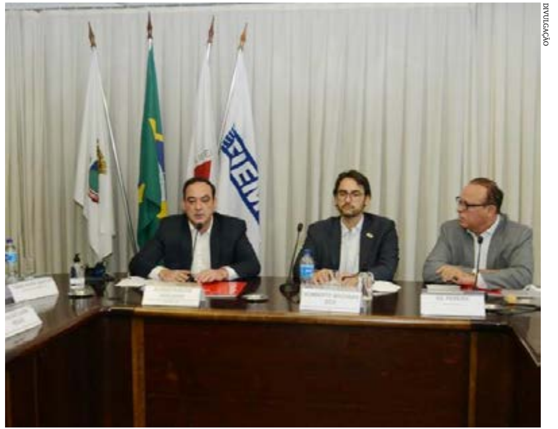
Ótima notícia para todos que querem gerar sua própria energia, economizar até 95% na conta de luz e ajudar na preservação do meio ambiente

“Estamos todos sofrendo com os sucessivos aumentos de custos nas faturas de consumo de energia”, reforçou ele, pontuando que o avanço da autoprodução e a diversificação da matriz energética trazem certo alívio neste cenário de crise hídrica e energética. “Final, é grande a pressão sobre os recursos durante o estresse hídrico que vivemos”, afirmou Zica.