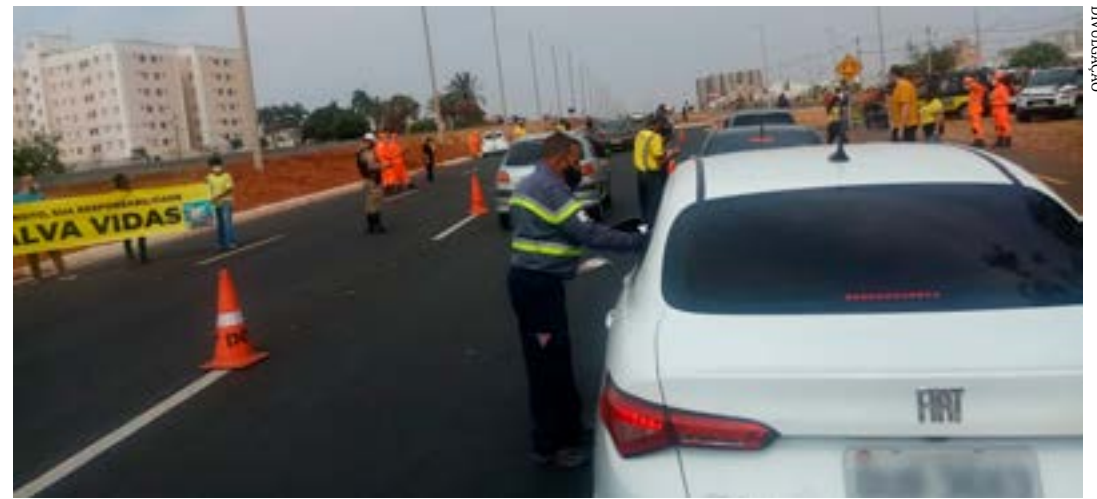
Campanha de 2021 teve como tema “No trânsito, sua responsabilidade salva vidas”

Já em Uberlândia, no Triângulo, motoristas e passageiros foram abor-