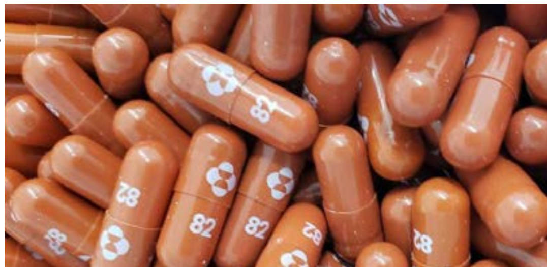
Tratamento consiste em 800 mg de molnupiravir a cada 12 horas por cinco dias