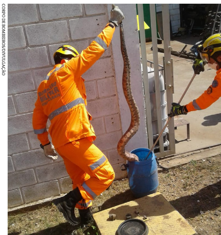
CORPO DE BOMBEIROS DE MONTES CLAROS