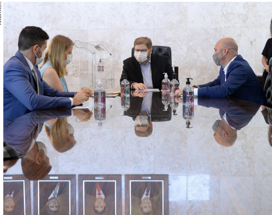
Presidente Agostinho Patrus recebeu da secretária de Estado de Planejamento e Gestão o projeto da Lei Orçamentária para 2022

Em solenidade realizada na manhã de ontem (30/9/21), no Salão Nobre, o presidente da Assembleia