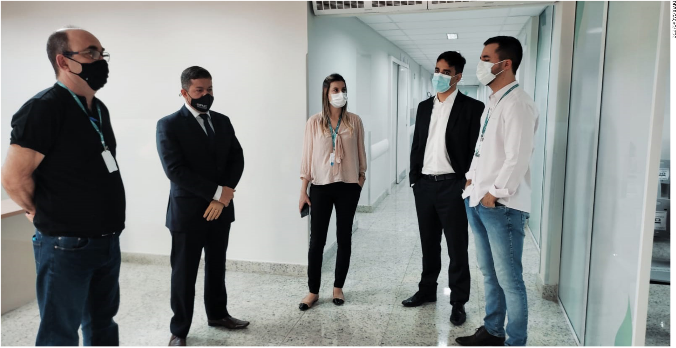
Promotores de Justiça durante visita a Fundação/Hospital Dilson Godinho

Com o objetivo de conhecer as novas instalações e o plano de reestruturação hospitalar da Fundação de Saúde Dilson de Quadros Godinho, mantenedora do Hospital Dilson Godinho, promotores de justiça do Ministério Público de Montes Claros foram recebidos pela diretoria, nesta quinta-feira (30).