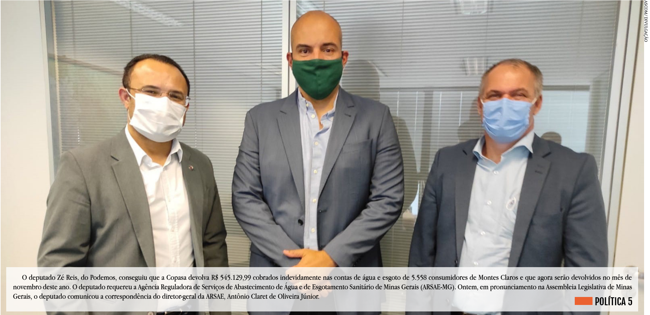
O deputado Zé Reis, do Podemos, conseguiu que a Copasa devolva R$ 545.129,99 cobrados indevidamente nas contas de água e esgoto de 5.558 consumidores de Montes Claros e que agora serão devolvidos no mês de novembro deste ano. O deputado requereu a Agência Reguladora de Serviços de Abastecimento de Água e de Esgotamento Sanitário de Minas Gerais (ARSAE-MG). Ontem, em pronunciamento na Assembleia Legislativa de Minas Gerais, o deputado comunicou a correspondência do diretor-geral da ARSAE, Antônio Claret de Oliveira Júnior.