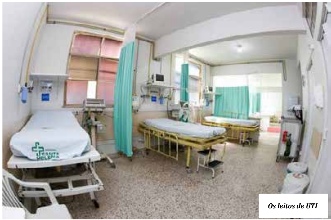
Os leitos de UTI

O extrapolação de produção hospitalar é quando um hospital estoura a sua cota de atendimento, como no caso das UTIs. A decisão é discutida na Comissão Interpatite de Saúde de Minas Gerais, depois de analisada pela equipe técnica do Estado, que emite o parecer. Por causa da Pandemia Coronavírus, os hospitais apresentaram muitas vezes superlotação das suas UTIs.