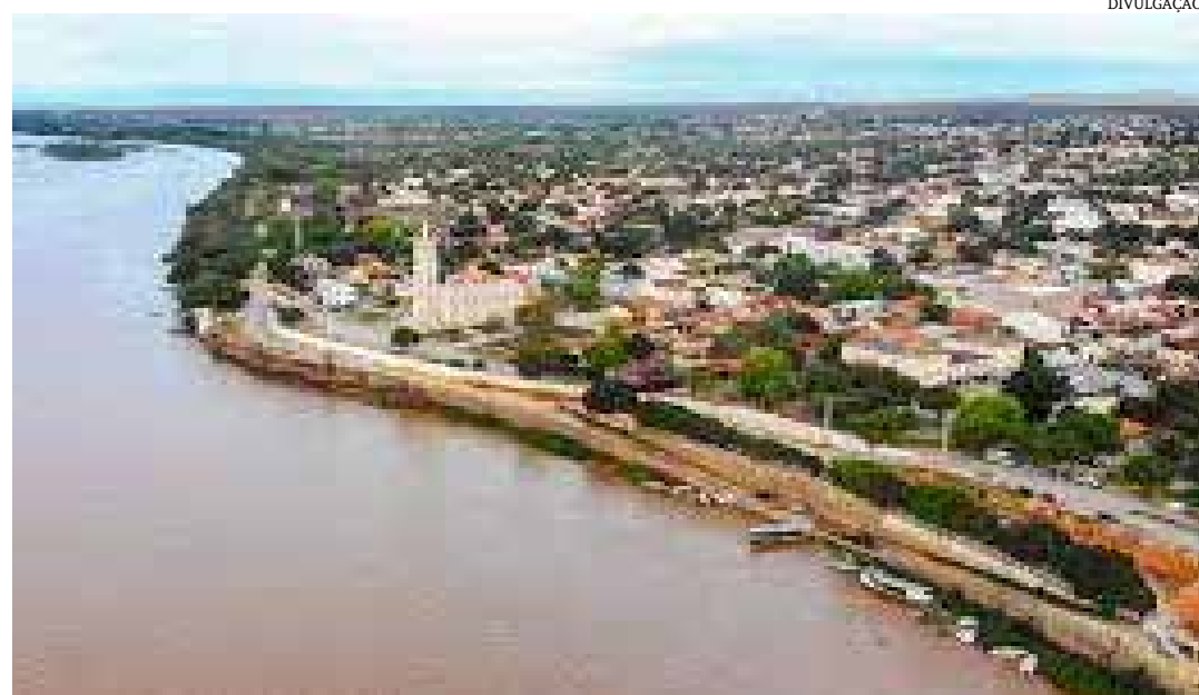
O local onde será construída a ponte