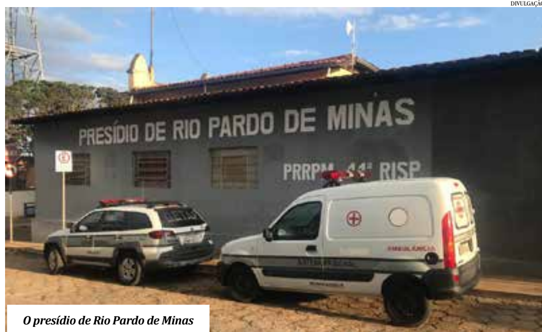
O presídio de Rio Pardo de Minas

Para o presidente da comissão, o fechamento das unidades trará prejuízos não só para as Polícias Civil e Militar, como também para o Judiciário, o Ministério Público e a Defen-