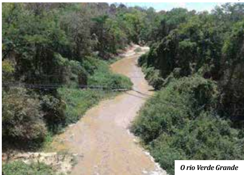
O rio Verde Grande

O Ministério do Desenvolvimento Regional anunciará hoje, na cidade de São Roque de Minas, onde nasce o rio São Francisco, o projeto "Nascentes Vivas", que receberá o valor de R$ 10 milhões, liberados pela Caixa Econômica para recuperar 1,5 mil nascentes na Bacia do Rio Verde Grande, ao longo de 27 municípios de Minas Gerais, todos eles no Norte de Minas. O Ministério do Desenvolvimento Regional dá início hoje à Jornada das Águas, em evento com a presença do presidente Jair Bolsonaro, roteiro que partirá da nascente histórica do Rio São Francisco, no Norte de Minas Gerais, e percorrerá os nove estados do Nordeste.