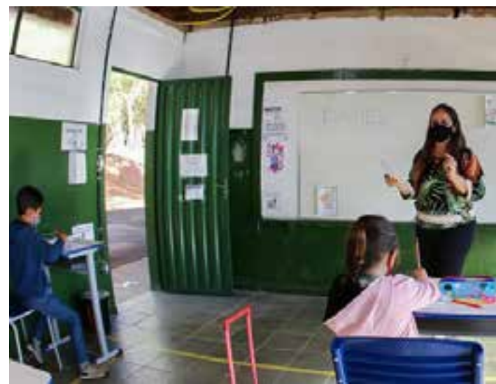
depositadas sempre no último dia do mês.

Além do salário em dia, também foi apresentada solução para quitar a dívida de quem tinha férias-prêmio a receber. A medida vai regularizar o pagamento para cerca de 25 mil servidores, com escalas mensais até dezembro de 2022. Do total devido (R$ 7 bilhões), já foram pagos R$ 4,9 bilhões (70%) - valor que corresponde a 22 das 33 parcelas previstas no acordo,