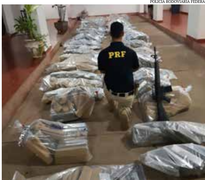
POLÍCIA RODOVIÁRIA FEDERAL

A PRF estima que a apreensão gerou um prejuízo de mais de R$ 2 milhões. O material apreendido e o autor preso foram encaminhados à delegacia de Taiobeiras.