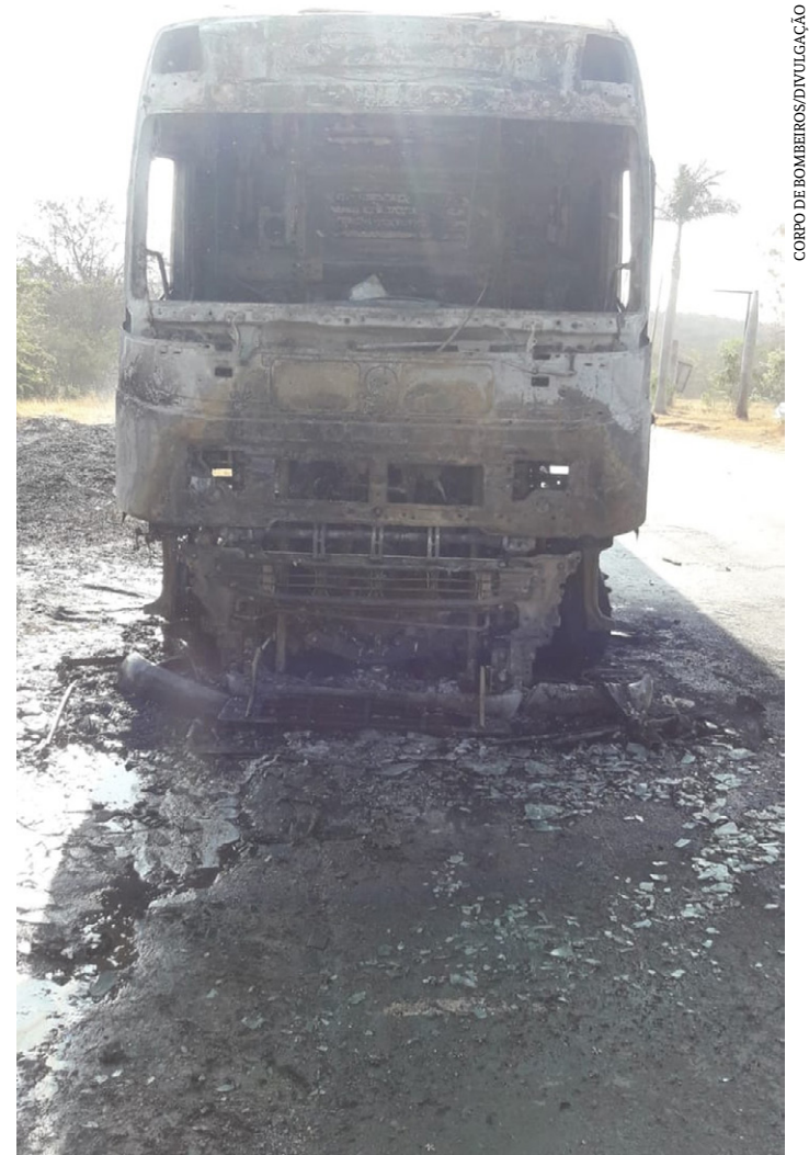
CORPO DE BOMBEIROS/INVESTIGAÇÃO

Foram gastos 10 mil litros de água e os militares tiveram apoio de dois caminhões-pipa da Prefeitura de Francisco Sá e do Serviço Autônomo de Água e Esgoto (SAAE).