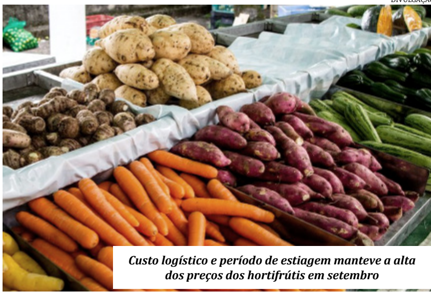
Custo logístico e período de estiagem manteve a alta dos preços dos hortifrúteis em setembro

Impulsionada mais uma vez pelo reajuste dos combustíveis e pelo aumento nos preços de oito itens considerados essenciais para a cesta básica, a inflação de setembro chegou a 0,99% em Montes Claros, segundo os cálculos do Índice de Preços ao Consumidor (IPC), da Universidade Estadual de Montes Claros. Os números foram divulgados nesta semana, pelo Departamento de Economia da Unimontes, responsável pelo projeto do IPC. Mesmo que pareça irrisório, pela primeira vez neste semestre a inflação na maior cidade do Norte de Minas ficou abaixo de 1%.