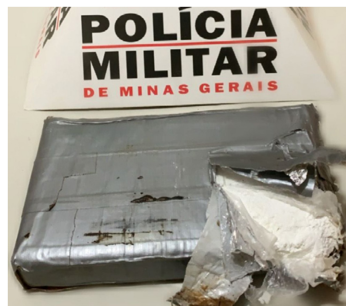
POLÍCIA MILITAR DE MINAS GERAIS

De acordo com a PM, o homem relatou que a droga não era dele, que apenas fazia o transporte. Ele e a mulher foram levados para a delegacia.