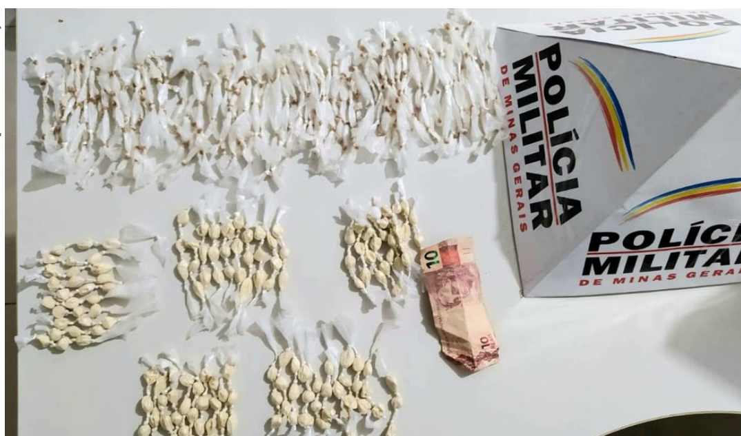
POLÍCIA MILITAR DE MINAS GERAIS