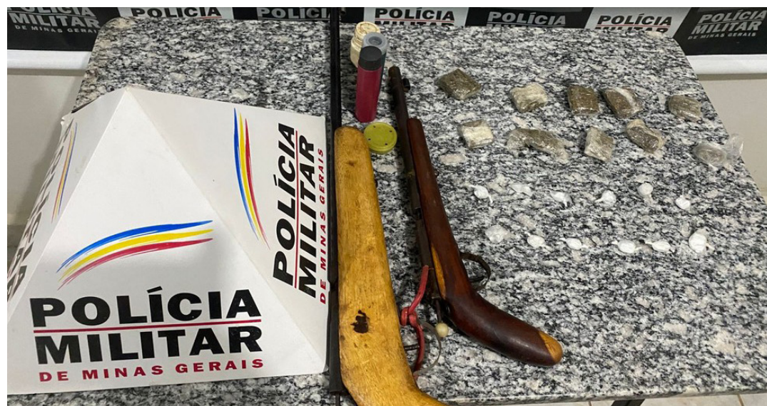
POLÍCIA MILITAR DE MINAS GERAIS

Os militares foram até a comunidade, onde o pai dele confirmou a posse das armas, que foram apreendidas. Os três homens foram presos e encaminhados para a Delegacia Civil em Pedra Azul. A moto utilizada pelos suspeitos não estava licenciada e foi encaminhado para pátio credenciado ao Detran.