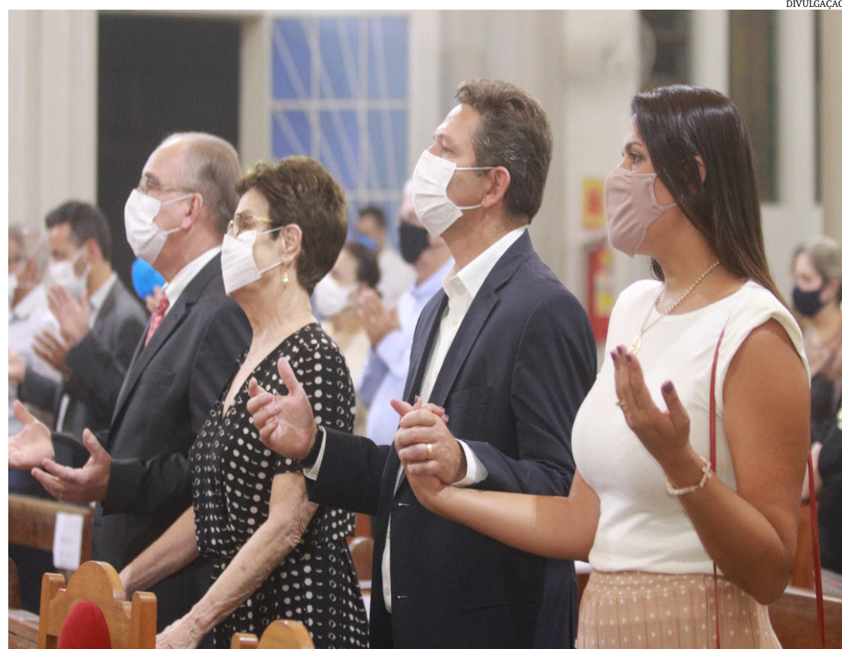
Em 21 de setembro de 2021, a Santa Casa de Montes Claros comemorou 150 anos de fundação. Desde o seu primeiro dia de funcionamento, através da caridade das irmãs cristãs, do acolhimento e transformação através da contribuição de cada gestor que passam por sua trajetória, dos heróis da saúde que dedicaram e dedicam suas vidas e profissionalismo ao bem maior que é a vida.