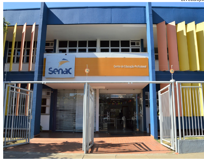
Em Montes Claros são mais de 200 vagas e as aulas de algumas turmas começam na segunda-feira (27)

Para se matricular, é necessário atender aos requisitos do curso escolhido, além de anexar o Documento de Identidade, CPF, Comprovante de Endereço Residencial e Comprovante de Escolaridade. As matrículas serão realizadas por ordem de inscrição, até o limite do número de vagas. Vale lembrar que, para participar do