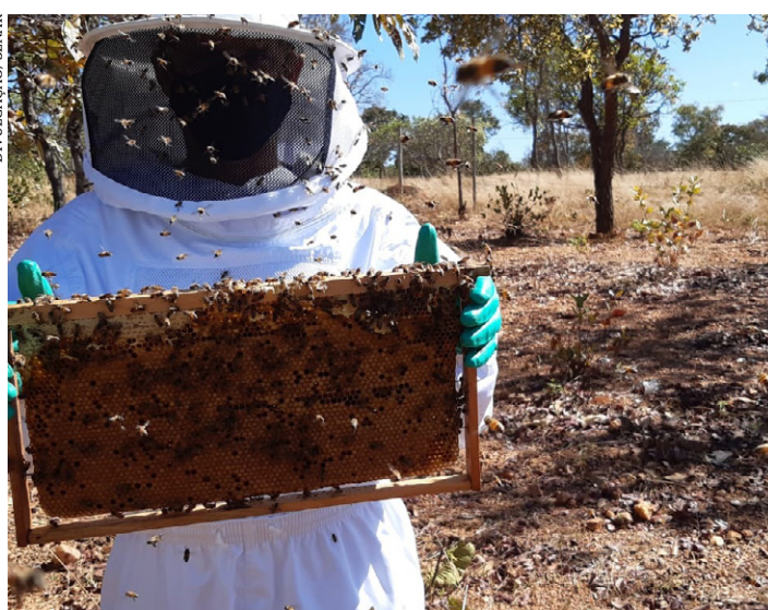
Cadeia produtiva do mel é uma das que mais cresce no Norte de Minas

Troca de conhecimentos, palestras com especialistas e as novidades da cadeia produtiva do mel fazem parte da programação do Dia de Campo da Apicultura, que acontece amanhã (24), em Japonvar. Promovido pelo Programa de Assistência Técnica e Gerencial (ATeG), do Sistema FAEMG/SENAR/INAES, e seguindo todas as normas de combate à Covid-19, o evento vai reunir apicultores de diversas cidades do