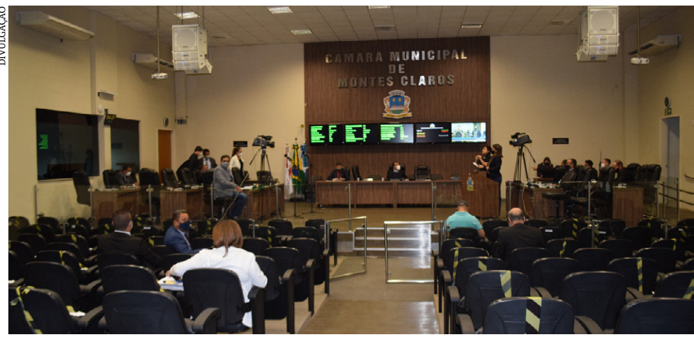
A reunião da Câmara de Vereadores de Montes Claros