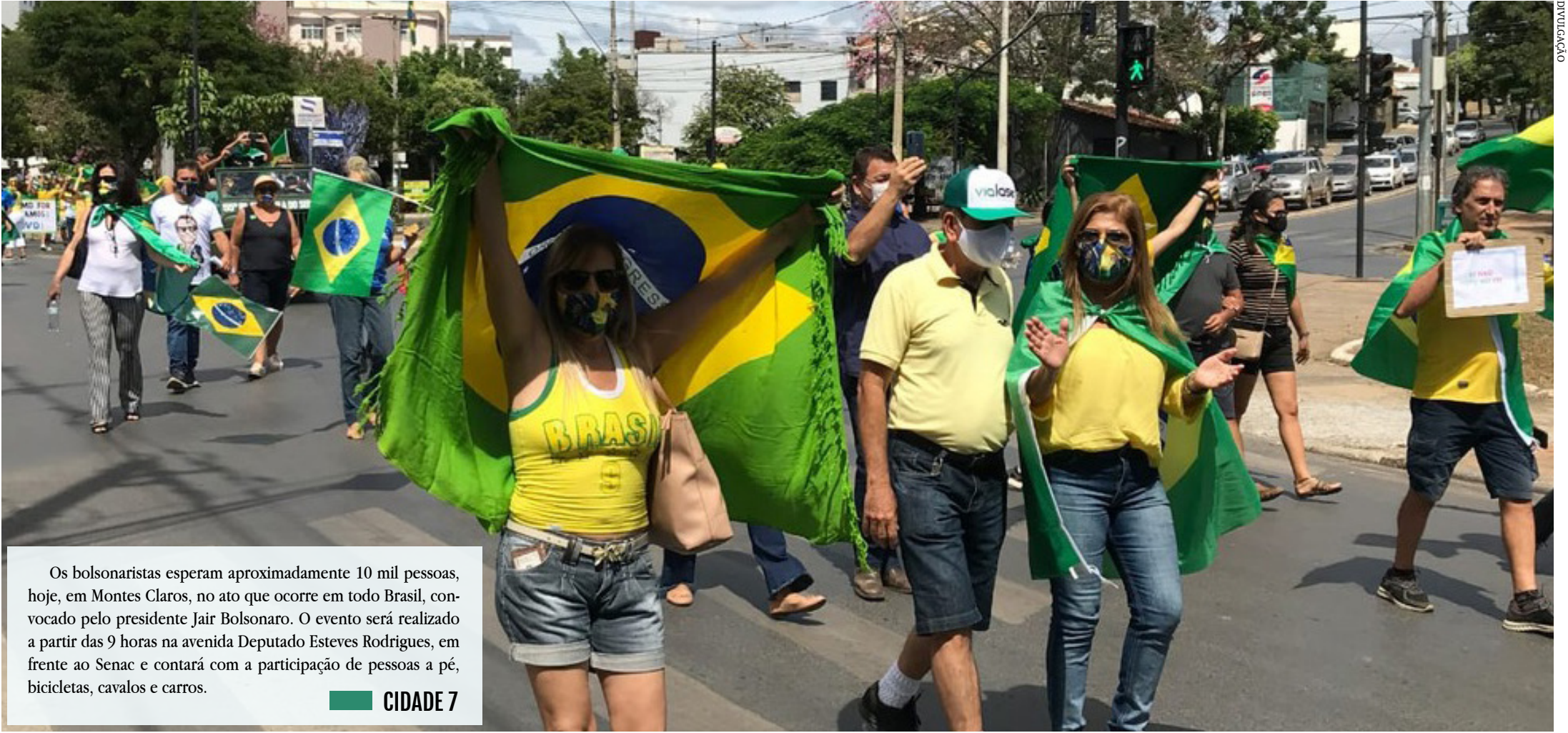
Os bolsonaristas esperam aproximadamente 10 mil pessoas, hoje, em Montes Claros, no ato que ocorre em todo Brasil, convocado pelo presidente Jair Bolsonaro. O evento será realizado a partir das 9 horas na avenida Deputado Esteves Rodrigues, em frente ao Senac e contará com a participação de pessoas a pé, bicicletas, cavalos e carros.