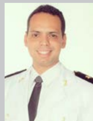
(*) Capitão PM – Comandante da 210ª Cia/10º Batalhão PM.

Nós seres humanos muitas vezes também somos assim – somos pedras brutas que precisamos ser lapidadas, ser transformados para buscarmos grandes valores na nossa vida para que então conheçamos qual são os nossos talentos, nossas potencialidades e que possamos nos desenvolver muito mais como pessoa em todas as áreas de nossa vida. Destaca-se que toda experiência vivida tem algo a nos acrescentar em nossa existência. Até o próprio Jesus Cristo, quantas vezes em sua história de vida terrena, ele passou por sofrimentos e paixões em que não queria vivenciar aquilo, mas deixou que Deus conduzisse seu caminho e que se fizesse em sua vida a vontade do Pai Celeste. E o resultado foi a ressurreição, a vitória sobre o sofrimento e sobre a morte. Nós também assim precisamos renascer para nos superarmos e alcançarmos outros níveis, outros estágios em nossa vida. Precisamos compreender que todo momento de crise é passageiro. E na nova fase compreendermos que haverá uma clarificação, uma visão diferenciada daquela anterior que outrora foi míope e imediatista. Max Lucado, escritor americano nos afirma que "Deus nunca disse que a jornada seria fácil, mas Ele disse que a chegada valeria a pena". E tudo nos conduzirá para a valorização do que é simples e grandioso, daquilo que realmente tem importância e pode nos fazer um ser humano muito mais edificado.