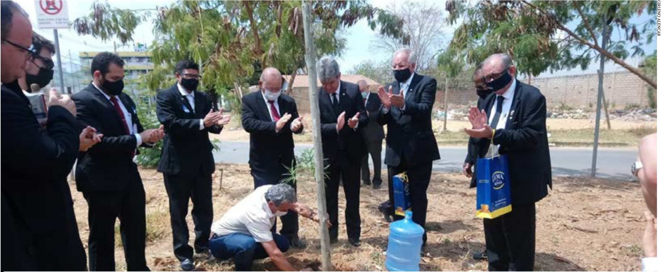
O Grande Oriente do Brasil, uma das três obediências maçônicas do Brasil, realizou sábado, em Montes Claros, a 22ª etapa do Projeto Immanar, com a discussão de temas de interesse do Norte de Minas, como um plano de convivência com a seca e a exploração do potencial de energia solar e até mesmo a campanha de valorização do voto do Norte de Minas.