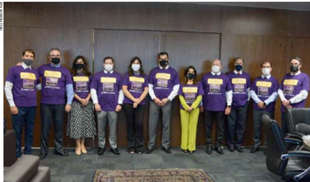
Ações do TJMG pretendem dar visibilidade ao assunto, bem como incentivar a criação de políticas públicas e o mapeamento de casos