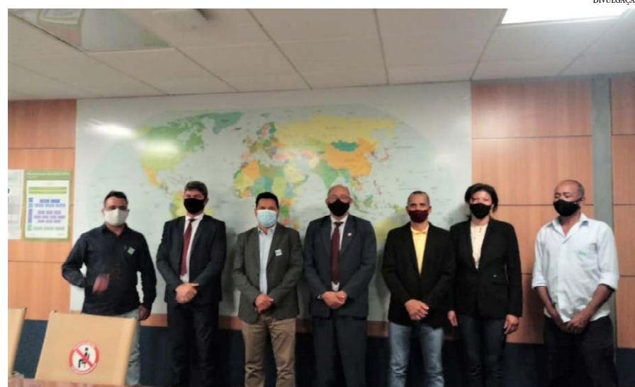
A comitiva de Pintópolis e o subsecretário

no Parque de Exposições de Pintópolis, no valor de R$ 960.019,00 e; para a Construção do Centro de Eventos de Pintópolis, no valor de R$ 382.000,00.