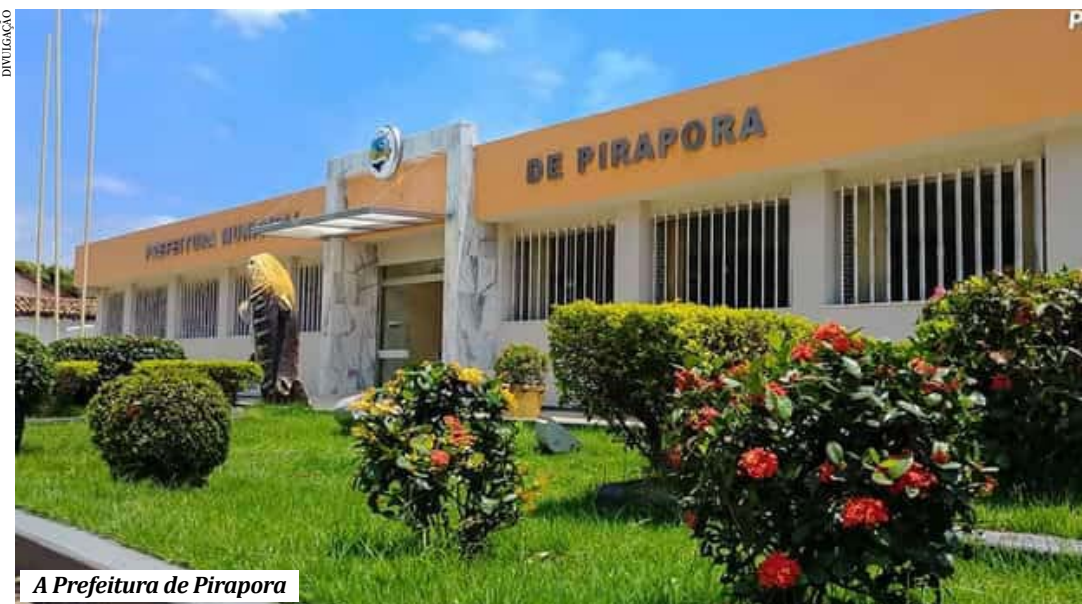
A Prefeitura de Pirapora