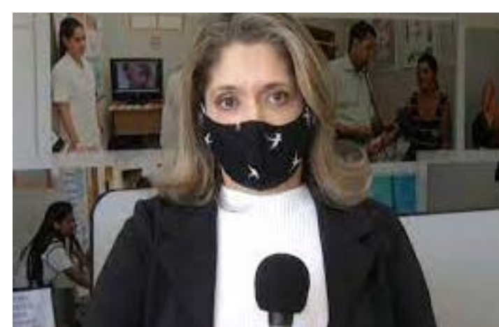
Virgínpolis (1), onde também há transmissão comunitária da doença, Itabirito (1), Unai (2), Carangola (1) e Divino (1). (GA)

Minas Gerais já registra onze casos da variante Delta do coronavírus, de acordo com a Secretaria de Estado de Saúde de Minas Gerais (SES). O primeiro caso da variante Delta foi identificado em 28 de maio deste ano em Juiz de Fora, na Zona da Mata. Além dessas cidades, estão na lista dois casos, em Belo Horizonte;