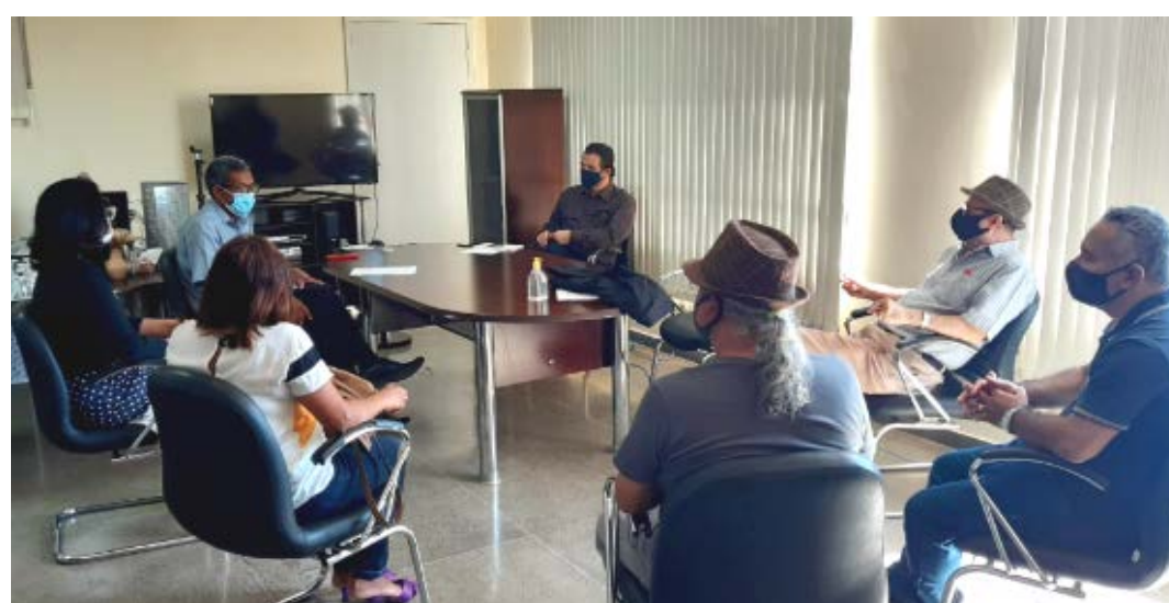
Conforme os professores, proposta de cursos tecnológicos atenderia às áreas de Estatística, Química e Física