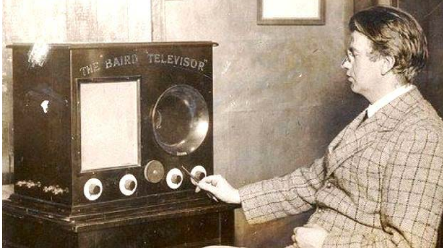
John Logie Baird posa ao lado de seu invento "The Baird Television", em 1926