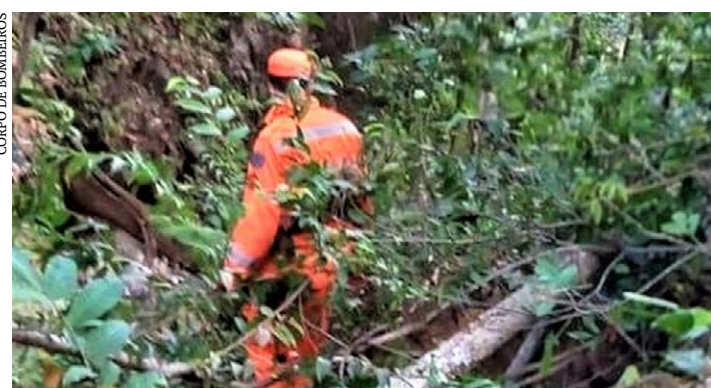
CORPO DE BOMBEIROS