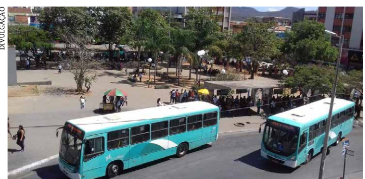
Os veículos que fazem o transporte coletivo na cidade

A Prefeitura de Montes Claros contratou uma empresa pelo valor de R$ 30.450,00 para avaliação dos impactos econômicos e operacionais da pandemia da Covid-19 no transporte coletivo urbano de Montes Claros, cumprindo a determinação do desembargador Armand Freire, dia 16 de abril de 2021, que acatou ação movida pelas duas empresas concessionárias, que se queixam de prejuízo acumulado na