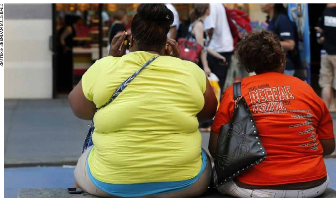
Ontem (8) foi comemorado o Dia Nacional de Combate ao Colesterol

Além de não fumar, ter alimentação saudável, praticar exercício físico, controlar o estresse e estar atento ao peso, o LAL dá outras duas dicas para manter o colesterol baixo. A primeira é evitar alimentos ultraprocessados, que são ricos em gordura saturada, o que interfere diretamente no aumento do colesterol ruim (LDL) no organismo. Entre os principais estão as comidas congeladas (batata frita, lasanha, nuggets), fast food em geral e salgadinhos. Por outro lado, as pessoas devem incluir na dieta alimentos oleaginosos, como as castanhas, nozes e pistache, que elevam a quantidade de HDL (colesterol bom) no organismo. (Agência Brasil)