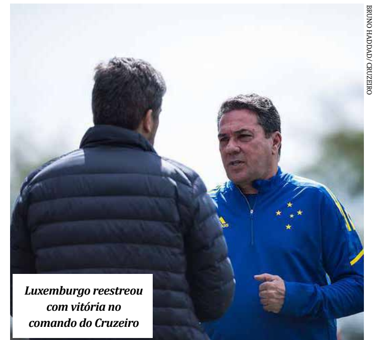
Luxemburgo reestreeu com vitória no comando do Cruzeiro

quebrou jejum de nove jogos sem triunfo e chegou aos 16 pontos, na 15ª posição, deixando momentaneamente a zona de rebaixamento. O G4 ainda está longe. Atualmente, o Avaí é o quarto colocado, com 26 pontos e um jogo a menos em relação ao Cruzeiro. (Superesportes)