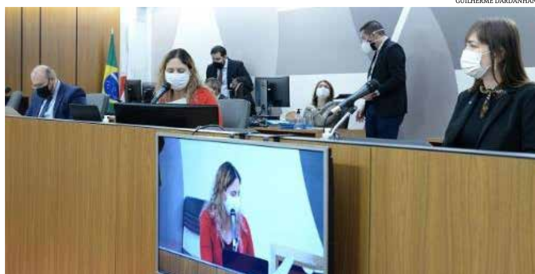
Projeto de municipalização dos anos iniciais do ensino fundamental já foi tema de três audiências da Comissão de Educação

Os repasses aos municípios que desejarem aderir ao projeto serão efetuados mediante a assinatura de termo de adesão, renovado anualmente e que pode ser rescindido de forma unilateral a qualquer tempo. (Portal ALMG)