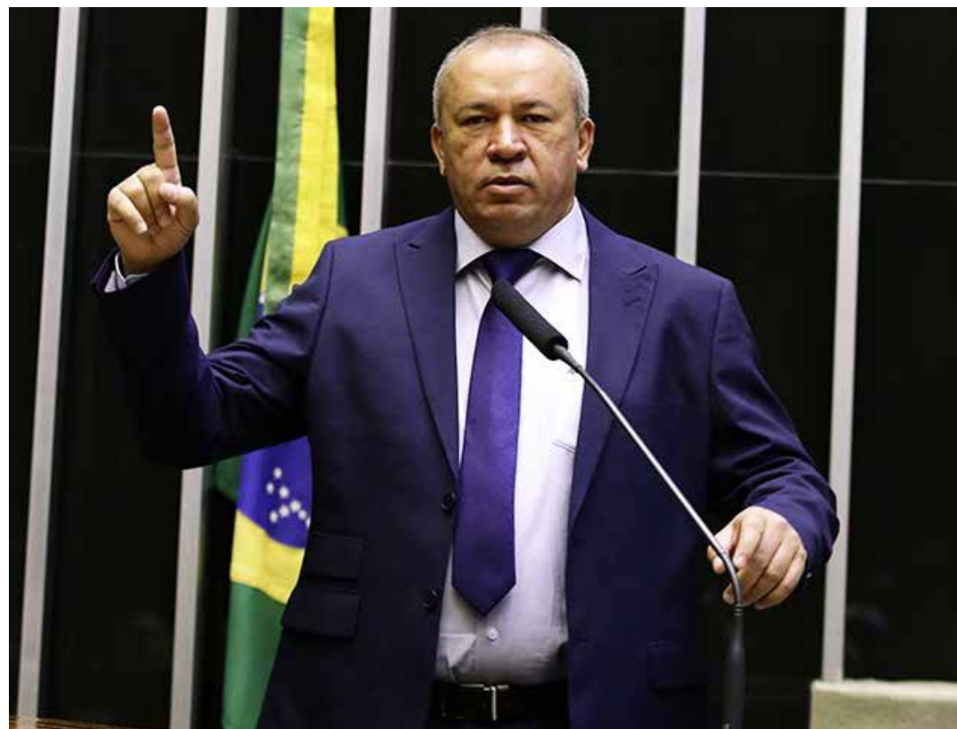
O parlamentar destacou a importância da indicação do parque