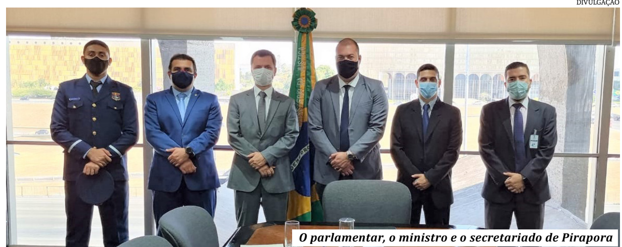
O parlamentar, o ministro e o secretariado de Pirapora