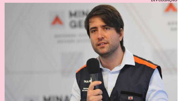
O secretário Fábio Bachareti

O Estado está investigando mais um caso suspeito da variante Delta da Covid-19 em Montes Claros. O secretário estadual de saúde, Fábio Baccheretti destacou em entrevista coletiva que a circulação da variante em Minas Gerais ocorre de forma proporcionalmente mais lenta quando comparada com outros estados.