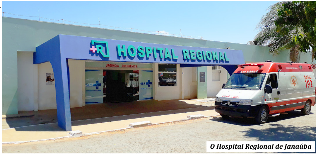
O Hospital Regional de Janaúba

Segundo o Ministério da Saúde cada grupo de 34 hospitais será acompanhado por profissionais dos hospitais de excelência do Proadi-SUS: Hospital Albert Einstein, Hospital Alemão Oswaldo Cruz, Hospital da Beneficência Portuguesa, Hospital do Coração, Hospital Moinhos de Vento e Hospital Sírio Libanês. O Ministério da Saúde será responsável pela condução das sessões virtuais de treinamento, assim como o suporte contínuo e visitas. (GA)