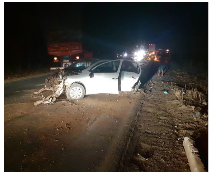
24 anos, sofreu traumatismo cranioencefálico e o outro homem se queixava de dores na região torácica e cervical.

Os outros dois ocupantes, de 24 e 31 anos, foram socorridos pelo Samu e levados para o Hospital Regional de Janaúba. O Samu informou que a vítima, de