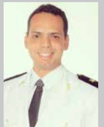
(*) Capitão PM – Comandante da 210ª Cia/10º Batalhão PM.

Vale dizer que muitos de nós não conseguimos desenvolver em sua totalidade essas doze áreas. Pode ser que em algumas fases da vida sejamos afetos mais a uma do que a outra. Na verdade a autoconsciência dessas ideias é fundamental para que possamos fazer funcionar de maneira balanceada o mecanismo da grande roda de nossa vida. Percebemos que conforme esses conceitos tudo é uma engrenagem; ou ainda podemos comparar tal designação a um jogo de dominó em que cada peça depende uma da outra para que possamos alcançar satisfação em maior integralidade durante toda a nossa existência. É indispensável identificarmos qual é o nosso nível em cada seguimento para que então possamos atribuir mais foco na área que está com menor valor atribuído. De sorte que o poeta irlandês, Oscar Wilde, nos afirma que "viver é a coisa mais rara do mundo. A maioria das pessoas apenas existe". De certo que cada vez mais podemos ser múltiplos e alcançarmos muito mais conhecimentos e aplicações. Tudo isso para que possamos transitar no cenário intelectual e físico, emocional e espiritual com maior segurança. E ao mesmo tempo para contribuir com maior efetividade para com toda a humanidade.