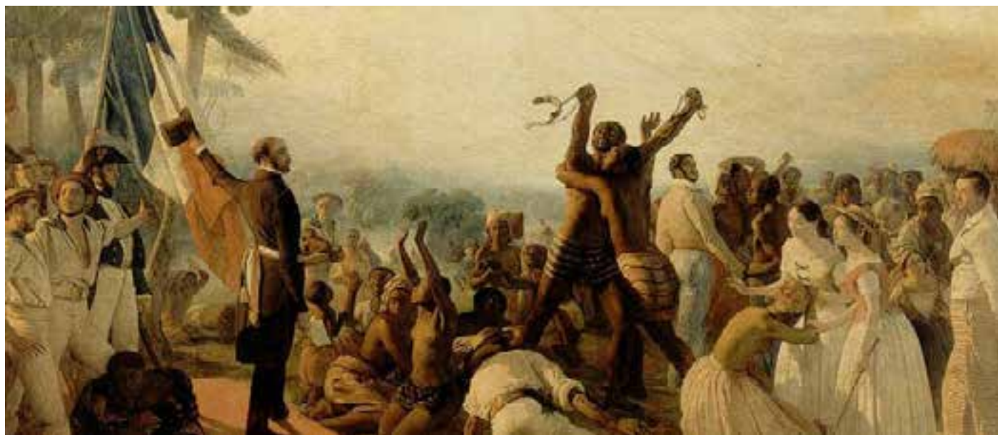
A lembrança do tráfico de escravos é uma oportunidade para as pessoas refletirem sobre os preconceitos raciais que surgiram com a escravidão (à esq.), Pintura ilustra a Independência do Haiti, proclamada em 1º de janeiro de 1804