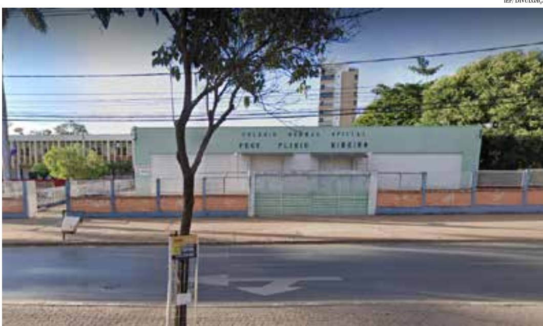
A Escola Normal

As 57 escolas de Montes Claros que retornarão são Cesec de Montes Claros, Américo Martins, Antônio Canela, Antônio Figueira, Armênio Veloso, Augusta Valle, Beato José de Anchieta, Belvinda Ribeiro, Benjamin Versiani dos Anjos, Carlos Versiani, Clóvis Salgado, Coronel Filomeno Ribeiro. Aparecida do Mundo Novo, Santa Rosa de Lima, São Pedro da Garça, Delfino Magalhães, Deputado Esteves Rodrigues, Bairro Santa Terezinha, Dom Aristides Porto, Dom João Antônio Pimenta, Domingos Barbosa Braer.