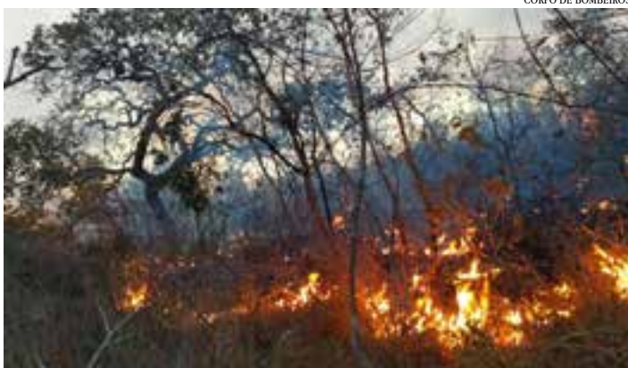
CORPO DE BOMBEIROS

No município de São João da Ponte, um incêndio atingiu uma área rural, na comunidade de Santa Rita. O fogo teve início na tarde de sábado (21). O incêndio atingiu cerca de 100 hectares de vegetação. De acordo com o Corpo de Bombeiros, as chamas iniciaram às margens da rodovia MG-202 e se propagaram rapidamente, gerando riscos para pessoas, casas e animais.