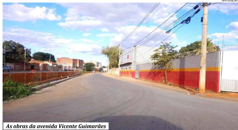
As obras da avenida Vicente Guimarães

A Prefeitura de Montes Claros aumentou em R$ 803.619,34 o valor da obra da avenida Vicente Guimarães, que com isso, passará a custar ao todo R$ 20.577.990,30 com todos realinhamentos realizados, sendo a obra mais cara dos últimos anos na cidade. A alteração do preço foi publicado no Diário Oficial de ontem, conforme o processo: 058/2019 – modalidade: Concorrência nº. 001/2019 para recuperação e adequação da canalização do córrego da avenida Vicente Guimarães, no Córrego Vargem Grande, com a canalização, drenagem, pavimentação e urbanização, com o contrato assinado com a empresa Comim Construtora.