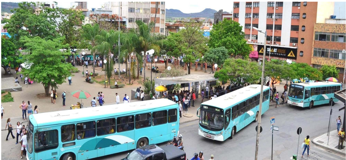
O transporte coletivo teve o horário ampliado e não terá mais restrição de uso da gratuidade para os idosos

Fica permitida a prática de esportes coletivos de contato, desde que sem a presença de público e em locais em que seja possível controlar a entrada de público externo. Fica autorizado o funcionamento dos clubes de serviços, como Rotary Club, Lions