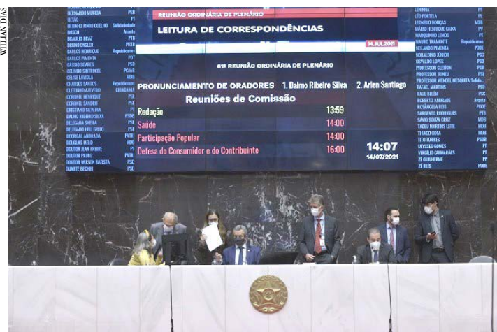
O deputado João Magalhães fez a leitura da mensagem durante a reunião

O Projeto de Lei (PL) 2.937/21, que autoriza a abertura de crédito suplementar ao Orçamento Fiscal do Estado, foi recebido na Reunião Ordinária de Plenário de ontem (14). A proposição foi encaminhada à Assembleia Legislativa de Minas Gerais por meio de mensagem do governador Romeu Zema (Novo).