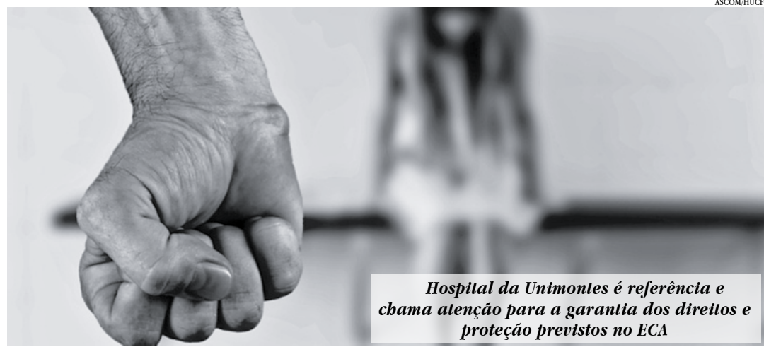
Hospital da Unimontes é referência e chama atenção para a garantia dos direitos e proteção previstos no ECA

Toda criança tem direito à vida, à saúde, à liberdade, à escola, ao esporte, lazer, convivência familiar