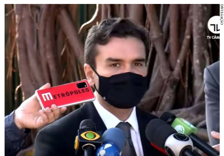
Celso Sabino concede entrevista depois de entregar o texto a Lira

Em relação ao Imposto de Renda da Pessoa Física, Sabino manteve a proposta do texto original do Executivo. O projeto estabelece que, entre as medidas de maior impacto, está a atualização da tabela do Imposto de Renda da Pessoa Física, que reajusta a faixa de isenção de R$ 1.903,98 para R$ 2.500 mensais. O governo estima que o número de pessoas isentas aumentará em 5,6 milhões, passando de 10,7 milhões para 16,3 milhões, o que corresponde à metade dos declarantes. (Agência Câmara)