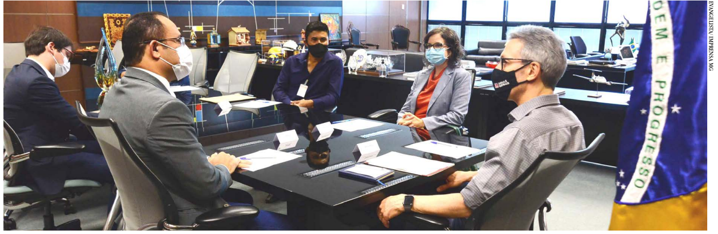
Processo licitatório para reforma da unidade, em São João das Missões, está em andamento

A secretária de Estado de Educação, Julia Sant'Anna, explicou que foi realizado todo o levantamento necessário para a reconstrução da escola. "Já assinamos o termo de compromisso com a direção da unidade, que inicia agora um processo licitatório. O valor estimado é de R$ 720 mil. Contemplará os espaços afetados, a reforma do imóvel e uma ampliação", explicou.