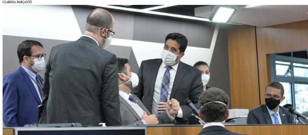
Vários projetos tiveram sua tramitação iniciada com pareceres pela legalidade recebidos nesta terça (13)

O projeto original estabelece, no artigo 2º, que a finalidade desta política estadual é permitir o acesso e a integração à cultura científica de estudantes da rede pública como fundamentais para o desenvolvimento das mais amplas habilidades.