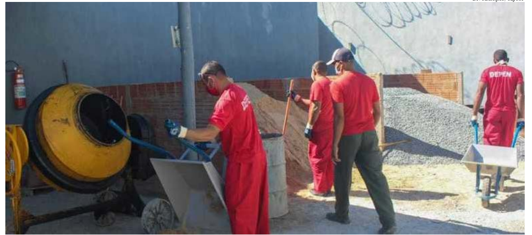
Em troca de remição de pena, oito detentos vão atuar em iniciativa conjunta com o município de Pedras de Maria da Cruz

Junto à fábrica de bloquetes, foi inaugurada, na última terça-feira (6/7), uma nova portaria no Presídio de Januária I. As instalações recém-construídas consistem em dois bo-