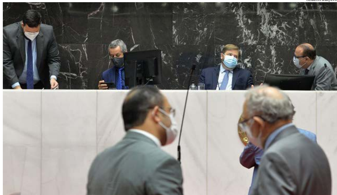
Parlamentares seguiram em Plenário o entendimento da CCJ sobre a matéria

CÁLCULO - O direito ao benefício especial será calculado com base nas contribuições recolhidas