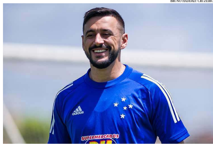
Contratado pelo Cruzeiro em abril de 2016, Robinho disputou 180 partidas, marcou 25 gols e deu 32 assistências

Em agosto de 2020, Robinho conseguiu na Justiça do Trabalho o encerramento do vínculo com o clube que era válido até o fim de 2021. Conforme a petição inicial protocolada pela defesa do jogador, o Cruzeiro havia se comprometido a pagar ao meio-campista R$ 2.169.792,10, sendo R$ 1.792.348,86 parcelados em