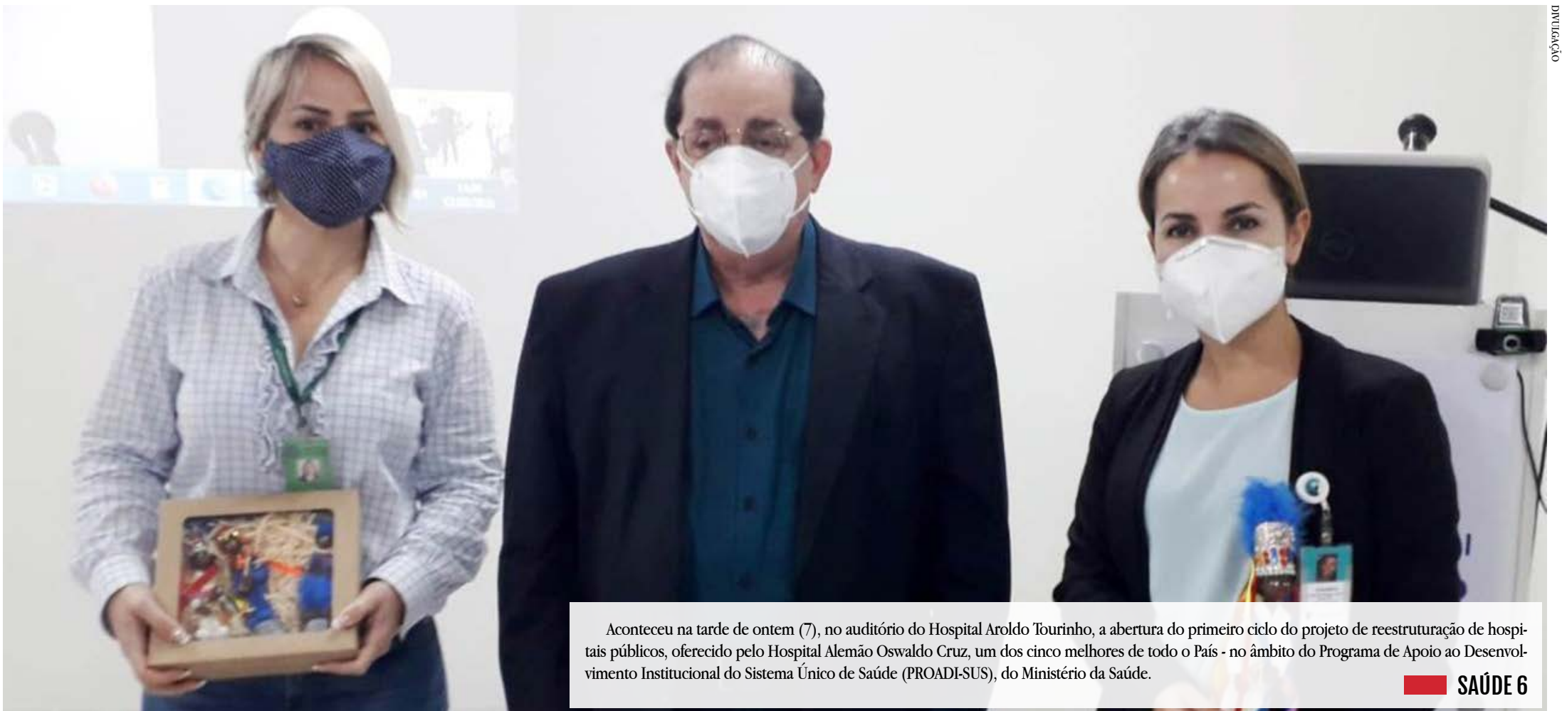
Aconteceu na tarde de ontem (7), no auditório do Hospital Aroldo Tourinho, a abertura do primeiro ciclo do projeto de reestruturação de hospitais públicos, oferecido pelo Hospital Alemão Oswaldo Cruz, um dos cinco melhores de todo o País - no âmbito do Programa de Apoio ao Desenvolvimento Institucional do Sistema Único de Saúde (PROADI-SUS), do Ministério da Saúde. SAÚDE 6