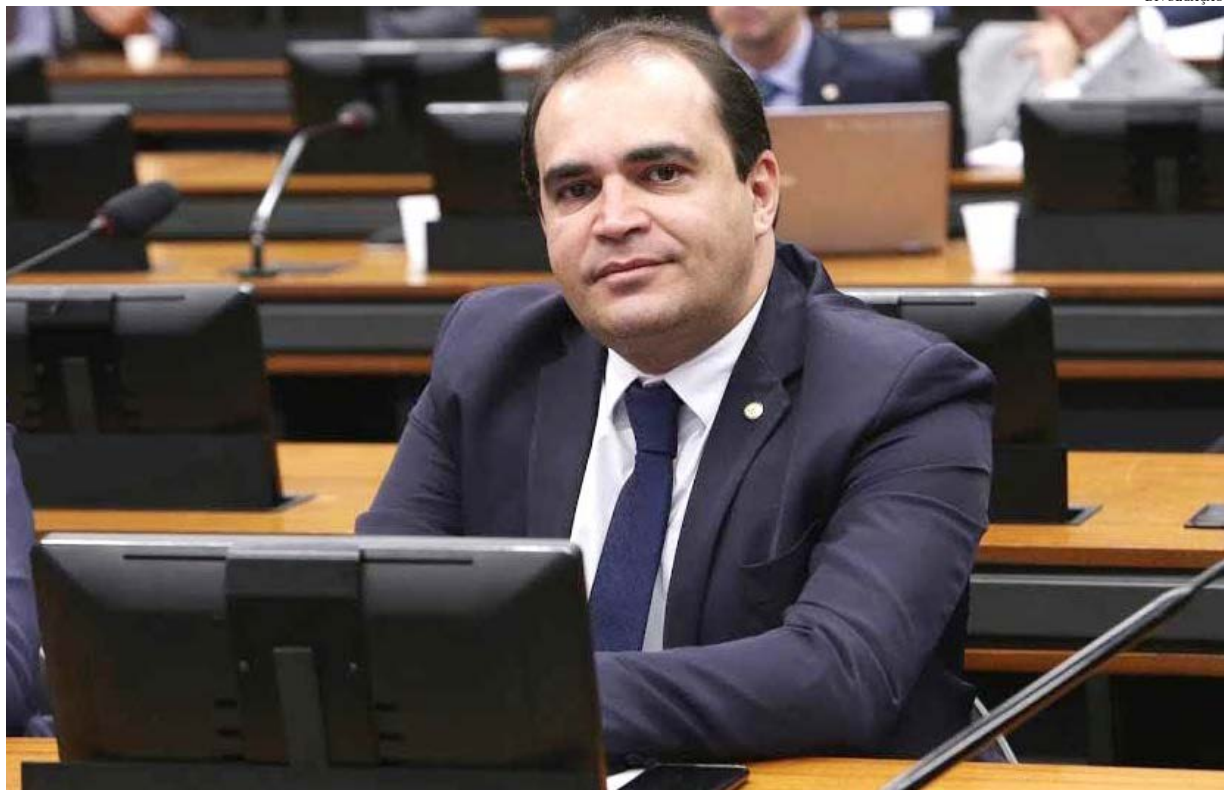
O Governo Federal publicou na terça-feira (6), no Diário Oficial da União, o Decreto 10.740/21, que prorroga até outubro, o socorro financeiro destinado a pessoas em situação de vulnerabilidade devido à pandemia de Covid-19. Com isso, o benefício, que terminaria agora em julho, será estendido por três meses. O benefício será pago em agosto, setembro e outubro. POLÍTICA 4

Procurador-geral discute fim dos lixões no Norte de Minas