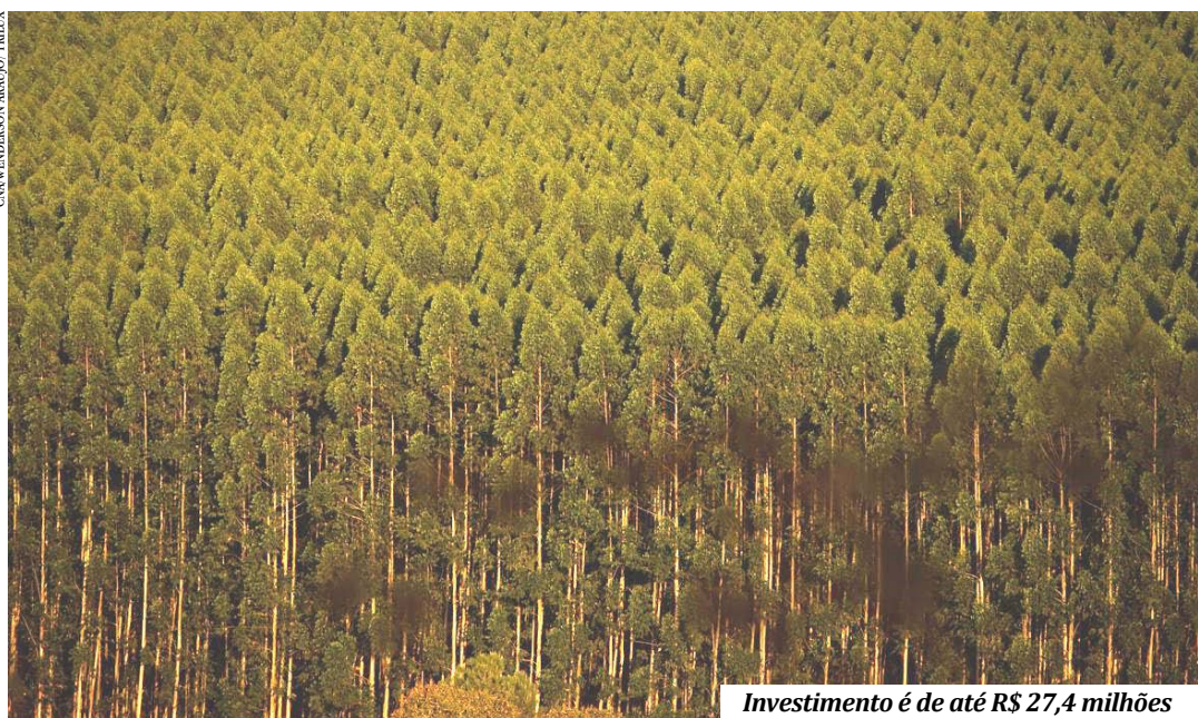
Investimento é de até R$ 27,4 milhões

PREFEITURA MUNICIPAL DE OLHOS D'ÁGUA/MG Proc.56/21-PP 26/21- Aquisição de patrulha agrícola-Convênio MAPA - nº901146/2020 - Credenciamento: 19/08/21-08:00- www.olhosdagua.mg.gov.br -licitacaolhosdagua@hotmail.com.