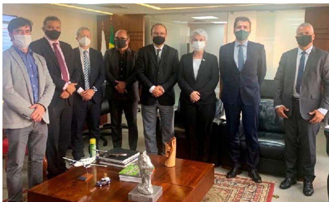
Em março de 2021, no MPMG, quando foi criado o grupo institucional de trabalho para resolver a questão fundiária em 11 municípios norte-mineiros