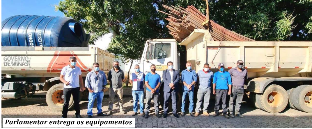
Parlamentar entrega os equipamentos

Materiais foram adquiridos com recursos de emendas do parlamentar, por meio do Dnocs