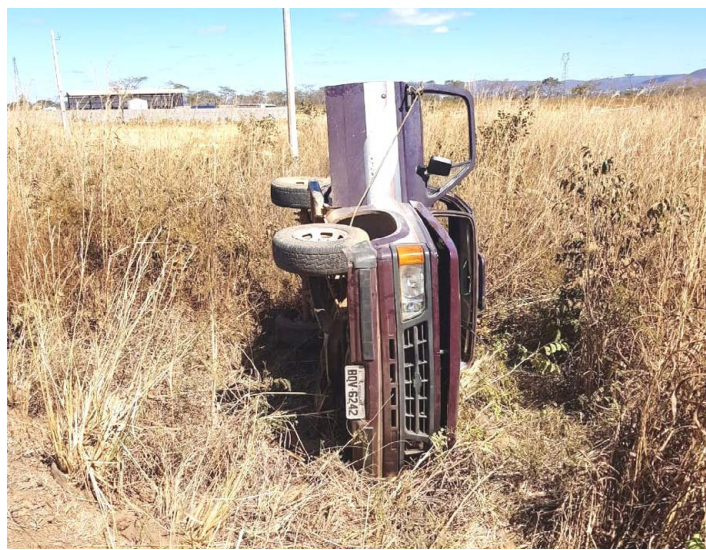
Uma pessoa ficou ferida em um acidente entre uma caminhonete e um micro-ônibus, na LMG-657

Na noite do último sábado (24), doze pessoas ficaram feridas em um grave acidente envolvendo dois carros e um caminhão na BR-365, em Pirapora. Segundo o Corpo de Bombeiros, os dois carros seguiam na mesma direção. Um deles bateu na traseira do outro, que rodou na pista e se chocou com um caminhão no