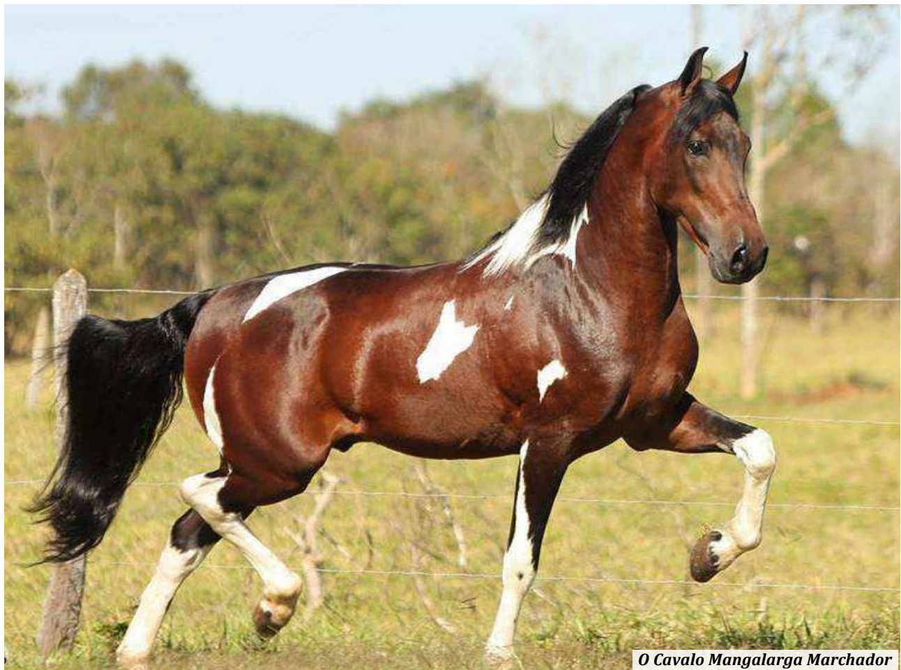
O Cavalo Mangalarga Marchador