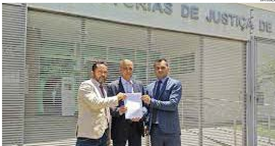
A denúncia formulada pelos vereadores na época

Aduzem que para “tentar ludibriar a Corte de Contas” os réus “editaram, no crepúsculo do ano de 2018, Decretos Municipais re-