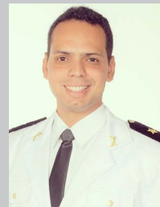
(* ) Capitão PM – Comandante da 210ª Cia/10º Batalhão PM.

Por conseguinte compreende-se que a preparação faz parte do processo da contínua ação. Isto é, pensar que somente devemos agir, quando estivermos preparados pode ser um grande equívoco. Pois, de acordo com o grande educador brasileiro Paulo Freire, "o caminho se faz caminhando"! Nossos pensamentos tem que estar firmes em um propósito. Diz-nos o escritor americano, Napoleon Hill, que "nós somos o que pensarmos". Isso quer dizer que ao que sugestionarmos em nossa mente, poderemos conceber, materializar e conquistar! Então a síndrome do perfeccionismo é um entrave para que possamos realizar nossos desejos! Destarte é indispensável que "prepararmos para o pior e esperarmos o melhor" pode nos manter muitos mais seguros e certos de nossas realizações em tudo o que almejarmos em nossa existência.