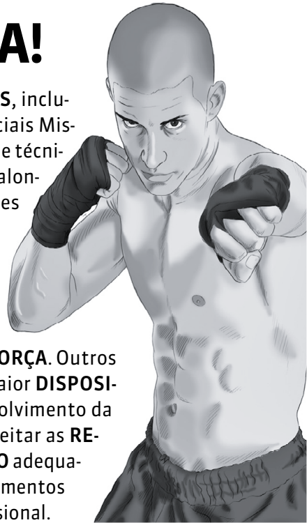
ILUSTRAÇÃO: RAFAEL MONTE

Cada vez mais praticado nas ACADEMIAS , inclusive por MULHERES , o MMA (Artes Marciais Mistas) envolve GOLPES de COMBATE em pé e técnicas de LUTAS no CHÃO . As aulas incluem alongamento e AQUECIMENTO , além de séries para SOCAR , chutar, agarrar, correr, pular corda e levantar peso. O esporte ajuda no EMAGRECIMENTO , defesa pessoal, definição MUSCULAR e condicionamento físico, pois combina exercícios cardiorrespiratórios, FLEXIBILIDADE e FORÇA . Outros benefícios são sensação de bem-estar, maior DISPOSIÇÃO , melhora da AUTOESTIMA e desenvolvimento da disciplina. Para isso, é fundamental respeitar as REGRAS do esporte, realizar o preparo FÍSICO adequado, ter o conhecimento TÉCNICO dos movimentos e seguir todas as ORIENTAÇÕES do profissional.