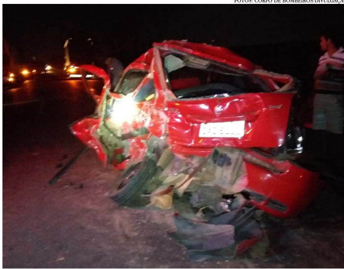
O acidente envolveu dois carros e um caminhão na BR-365, em Pirapora

Três vítimas ficaram presas às ferragens, sendo duas delas, de 27 e 13 anos, no carro que bateu contra o caminhão e um idoso, de 60 anos, no outro automóvel. Os bombeiros foram acionados e retiraram as vítimas de dentro dos veículos. Os feridos, com idades entre 4 a 61 anos, foram socorridos