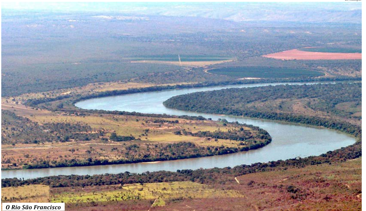
O Rio São Francisco

Um dos aspectos inovadores da EDRI é que ela é baseada no território, sendo mais específica e próxima à realidade local. Também se destaca o fato de que será possível identificar e priorizar áreas estratégicas de desenvolvimento. Isso permite o chamado processo de descoberta empreendedora, em que são percebidas novas oportunidades de negócios e espaços que podem ser influenciados por políticas de inovação. Desta forma, são estimuladas atividades econômicas de maior va-