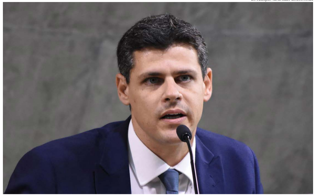
Segundo Funchal, a folga do teto permitiria elevar gastos com programa social

O resultado primário representa o superávit ou déficit nas contas do governo desconsiderando o paga-