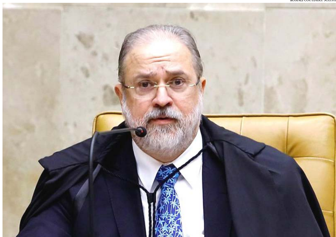
Augusto Aras, atual procurador-geral da República, foi indicado pelo presidente da República, Jair Bolsonaro, para mais dois anos no cargo; decisão sobre recondução será do Senado

Os senadores Alvaro Dias (Podemos-PR), Jorge Kajuru (Podemos-GO) e Alessandro Vieira (Cidadania-SE) também criticaram, em suas respectivas redes sociais, a tentativa de reconduzir Aras. Para Alvaro Dias e Alessandro Vieira, Bolsonaro erra outra vez ao não considerar a lista da ANPR, que foi respeitada entre 2003 e 2017. E Kajuru preferiu ironizar: "Uma indicação chamada gaveta!".