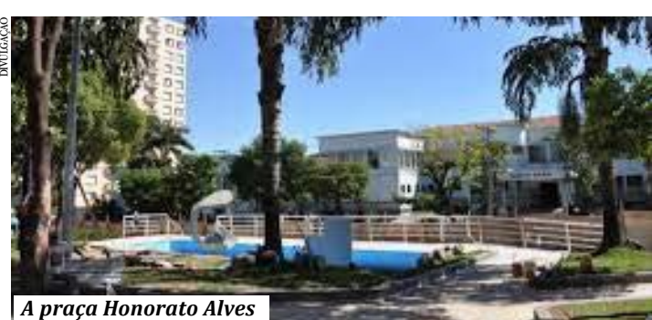
A praça Honorato Alves

A Prefeitura de Montes Claros continua executando obras de asfaltamento em diversos bairros da cidade. Ruas estão sendo asfaltadas nos bairros Nossa Senhora das Graças (região sul da cidade), Vila Antônio Narciso (região do grande Santos Reis) e Jardim Olimpo (região do grande Delfino). Além disso, diversas ruas estão sendo asfaltadas no Jaraguá, Monte Carmelo II e Santa Lúcia. Nos próximos dias o Prefeito Humberto Souto vai assinar ordem de serviço para asfaltamento de ruas na Vila São Francisco de Assis e Vila Áurea. (GA)