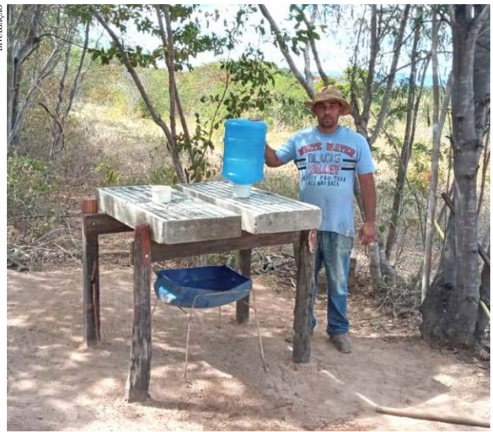
Acldes instalou o bebedouro próximo ao apiário da sua propriedade

"Isso ajudou a preservar a abelha e a produção. Quando a temperatura oscila muito, elas param o que estiverem fazendo para controlar a temperatura, que interna, no ninho, não deve ultrapassar os 36°C, pois acarreta a morte das crias e enfraquece os enxames, diminuindo a produção. Um dos meios que as abelhas encontram para controlar essa temperatura é espalhar a água sobre os favos e bater as asas, fazendo com que a água evapore e dissipe o calor", explicou o técnico.