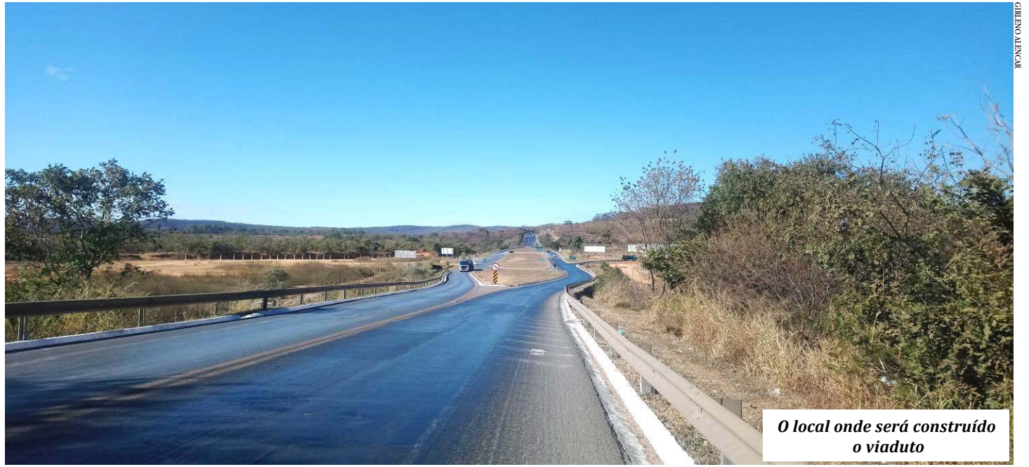
O local onde será construído o viaduto