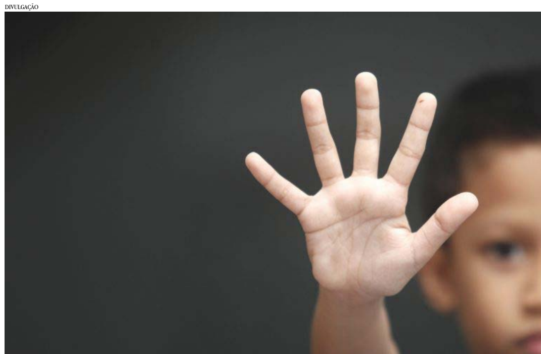
Texto prevê afastamento do agressor e assistência à vítima de maus-tratos

Fica criada pena de três meses a dois anos de prisão para quem descumprir decisão judicial sobre as medidas protetivas de urgência.