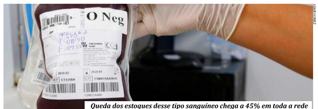
Queda dos estoques desse tipo sanguíneo chega a 45% em toda a rede

A vacinação contra a Covid-19 também impacta o comparecimento de doadores nas unidades, já que existe um período de inaptidão após cada dose. Esse prazo depende do imunizante recebido. Para as vacinas disponíveis até o momento, os prazos são: