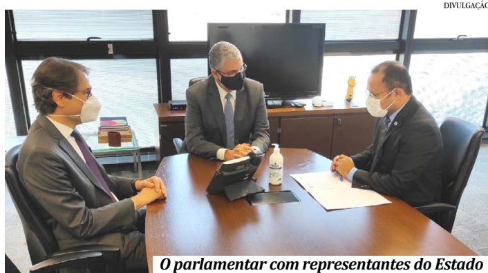
O parlamentar com representantes do Estado

Outro assunto da pauta foi a aplicação dos recursos provenientes da arrecadação do Imposto sobre Circulação de Mercadorias e Serviços (ICMS) incremental, recurso que é proveniente das operações das empresas a partir dos novos negócios e permite que até 60% do imposto a ser recolhido pelo Estado