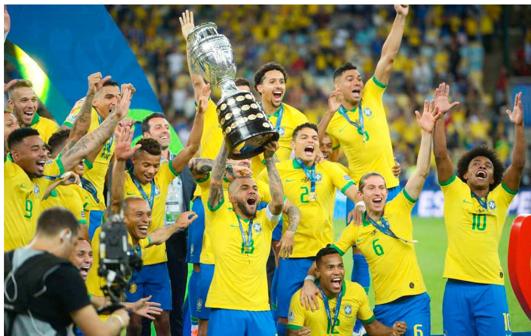
Depois de ser campeão em casa em 2019, país será sede novamente

“A Copa América de 2021 será disputada no Brasil. As datas de início e finalização do torneio estão confirmadas. As sedes e a tabela serão informadas pela Conmebol nas próximas horas”,