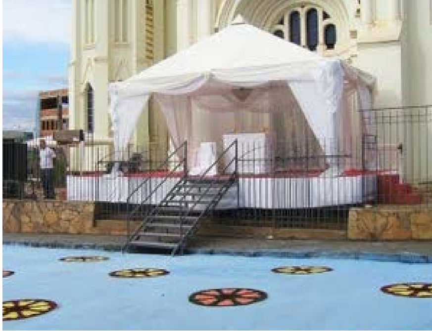
O tradicional tapete na igreja Catedral

k) A paróquia que considerar oportuno poderá incluir após o carro do Santíssimo Sacramento outro veículo para coletar doações de alimentos, roupas, cobertas ou fraldas, tudo a ser destinado aos mais pobres. Essas do-