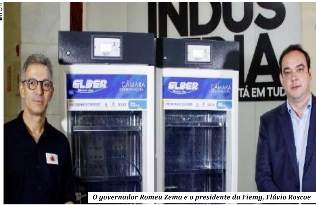
O governador Romeu Zema e o presidente da Fiemg, Flávio Roscoe

A Federação das Indústrias de Minas Gerais (Fiemg), representando o setor produtivo do estado, adquiriu 200 câmaras frias que servirão para o armazenamento das vacinas contra a Covid-19. A entrega simbólica dos equipamentos ao Estado foi realizada no dia 26/05, na sede da Federação, e o governador Romeu Zema agradeceu o engajamento e apoio do setor produtivo. "É uma doação de suma importância para o combate à pandemia. O lote doado pelo setor industrial será distribuído para as cidades que mais precisam", afirmou Zema, lembrando que o governo estadual vem se empenhando no processo de vacinação. "O que mais queremos é vacina nos braços dos mineiros", ressaltou o gestor.