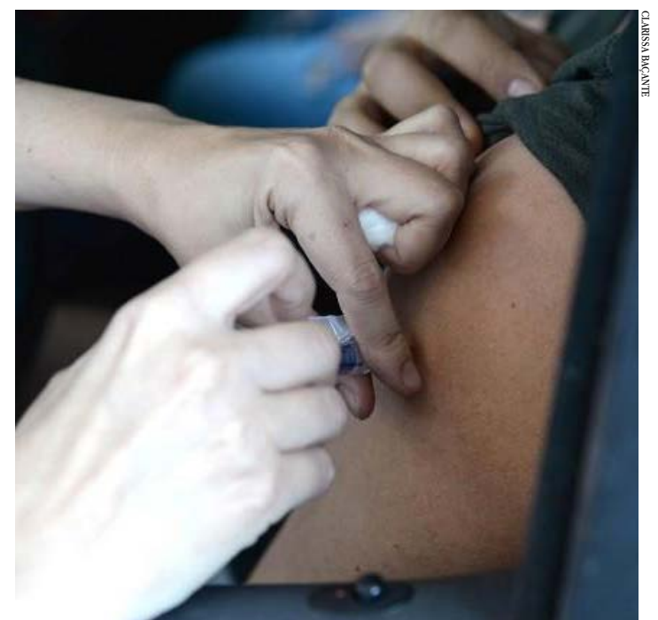
Deputados que pediram a reunião consideram que a vacinação do grupo tem demorado