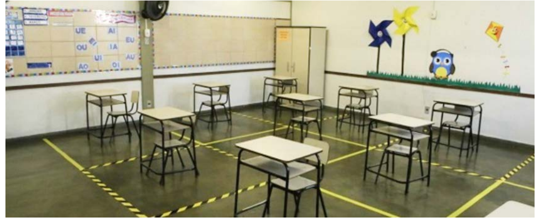
Escolas foram preparadas a partir de protocolo sanitário para garantir a segurança da comunidade

Para auxiliar na implementação das adequações necessárias, a SEE/MG já disponibilizou mais de R$ 60 milhões para as 3.590 escolas da rede pública estadual de ensino. Os recursos representam quatro parcelas do repasse de manutenção e