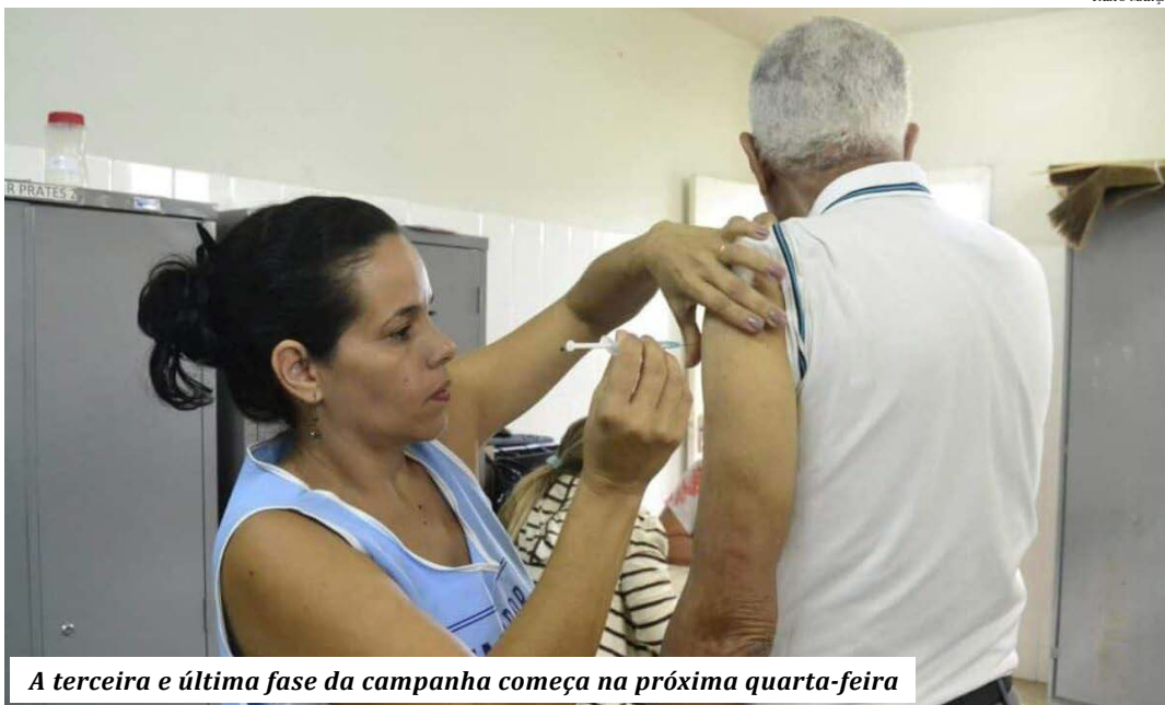
A terceira e última fase da campanha começa na próxima quarta-feira

A terceira e última fase da campanha começa amanhã (9) e abrangerá cerca de 22 milhões de pessoas. Desta vez, os alvos serão integrantes das Forças Armadas, de segurança e de salvamento; pessoas com comorbidades, condições clínicas especiais ou com deficiên-