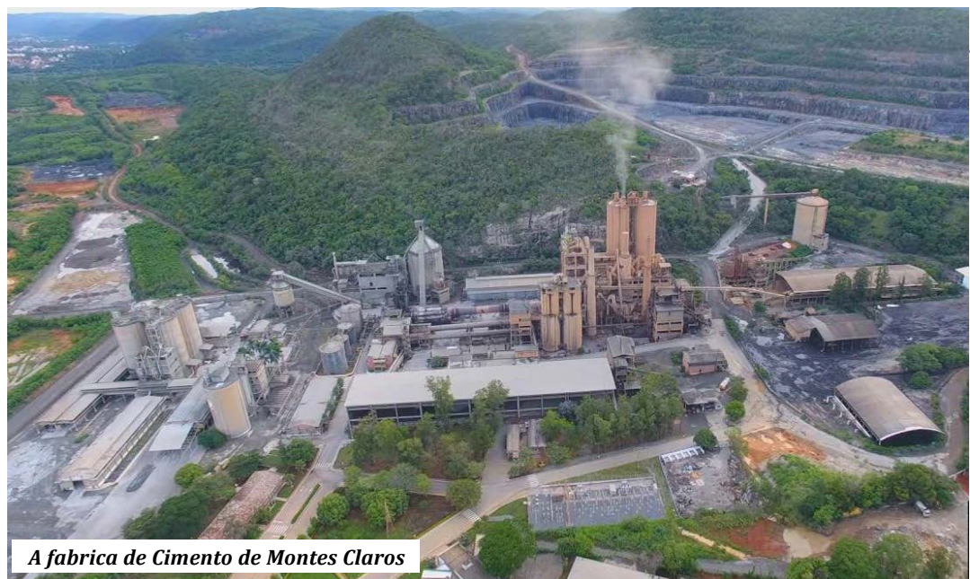
A fábrica de Cimento de Montes Claros