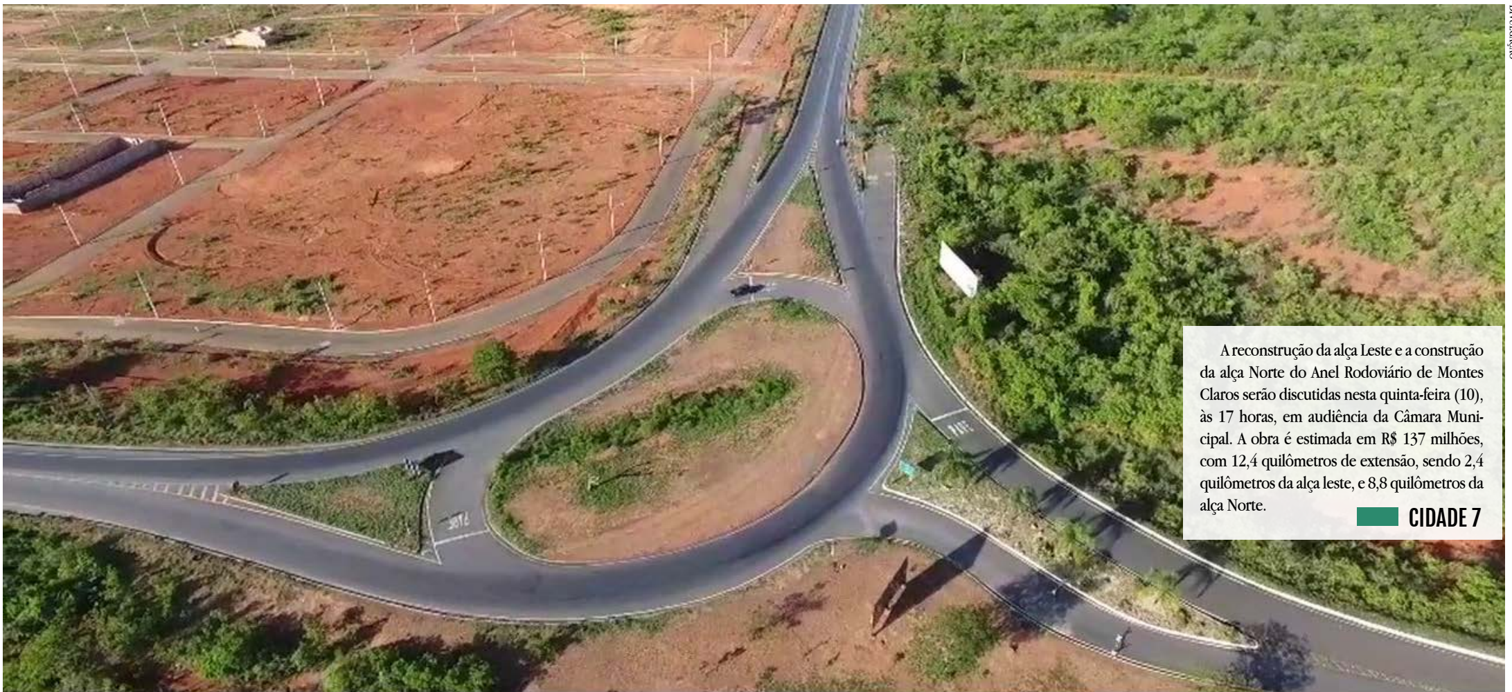
A reconstrução da alça Leste e a construção da alça Norte do Anel Rodoviário de Montes Claros serão discutidas nesta quinta-feira (10), às 17 horas, em audiência da Câmara Municipal. A obra é estimada em R$ 137 milhões, com 12,4 quilômetros de extensão, sendo 2,4 quilômetros da alça leste, e 8,8 quilômetros da alça Norte. CIDADE 7