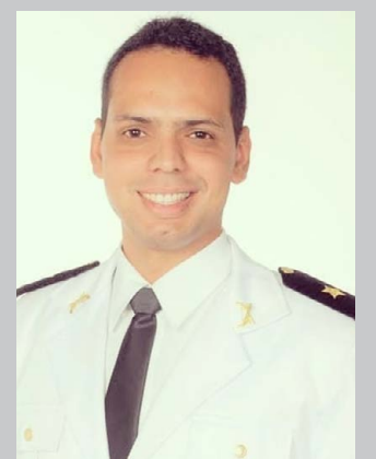
(*) Capitão PM – Comandante da 210ª Cia/10º Batalhão PM.

Por isso é que disciplina, hierarquia, valores morais devem de forma recorrente ser trabalhados em sociedade na tenra idade para podermos compreender que realmente são esses valores que intuem o meio social a valorizar o outro como ser humano. Muitos tendem a coisificar o outro. Vivem uma timidez de espírito e de humanidade que a falha passa a ser considerada algo correto para alguns, pois concebem que a lei ou a vida pode ser vivida como e quando quiserem aleatoriamente. Não respeitam leis, autoridades, valores espirituais e não sabem se relacionar com profundidade junto às pessoas sem de alguma forma maltratá-las, desonrá-las, sem compreender que há princípios e preceitos a serem reverenciados e que toda a convenção social existente é que mantém o esteio da contrabalançada convivência, do bem estar e do cultivo da humanidade para a evolução em todos os aspectos de vida.