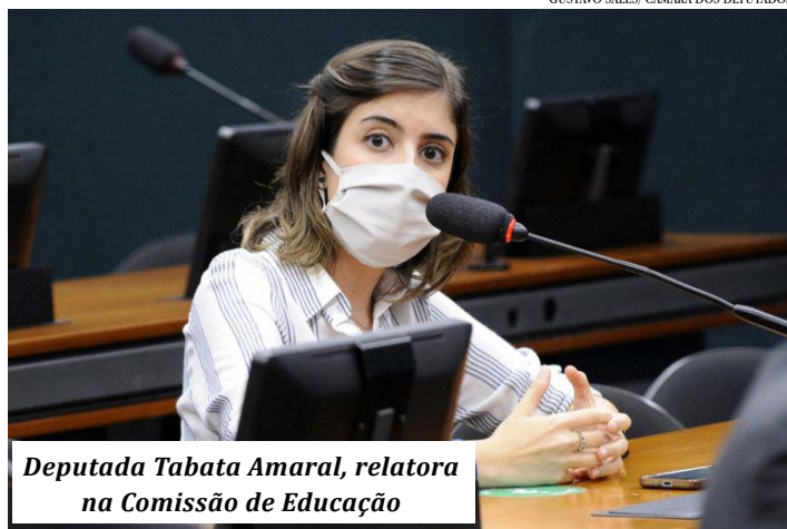
Deputada Tabata Amaral, relatora na Comissão de Educação

O projeto tramita em caráter conclusivo e ainda será analisado pela Comissão de Constituição e Justiça e de Cidadania. (Agência Câmara)