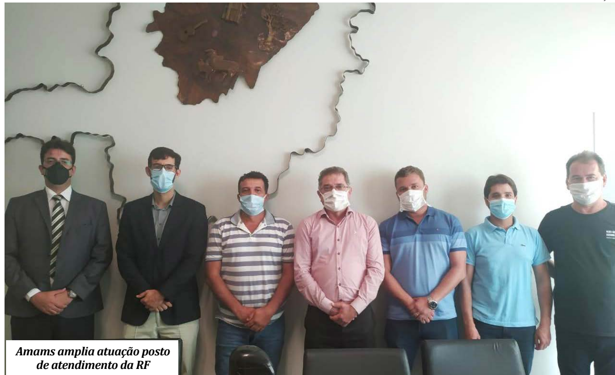
Amams amplia atuação posto de atendimento da RF

A Associação dos Municípios da área Mineira da Sudene (Amams) comemora os resultados alcançados na parceria com a Delegacia da Receita Federal de Montes Claros. O Norte de Minas já tem sete municípios com o Posto de Atendimento Virtual implantado e em pleno funcionamento e outros 12 municípios dependendo de pequenos detalhes. O PAV atende todas as demandas da Receita Federal, como regularização do CPF, emissão de certidão negativa e recebimento de documentos fiscais.