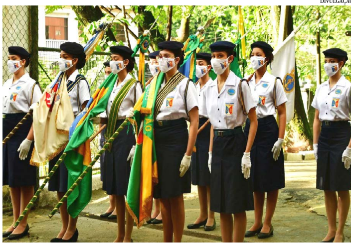
A FUNDAÇÃO OSÓRIO

Localizada no bairro Rio Comprido, no Rio de Janeiro, a escola atende a mais de 900 alunos, instruindo e educando desde os primeiros anos escolares até o ensino médio e profissionalizante. Sua característica é assistencial e tem sua razão de ser nos filhos e filhas de militares, órfãos e não-órfãos, que necessitam de assistência.