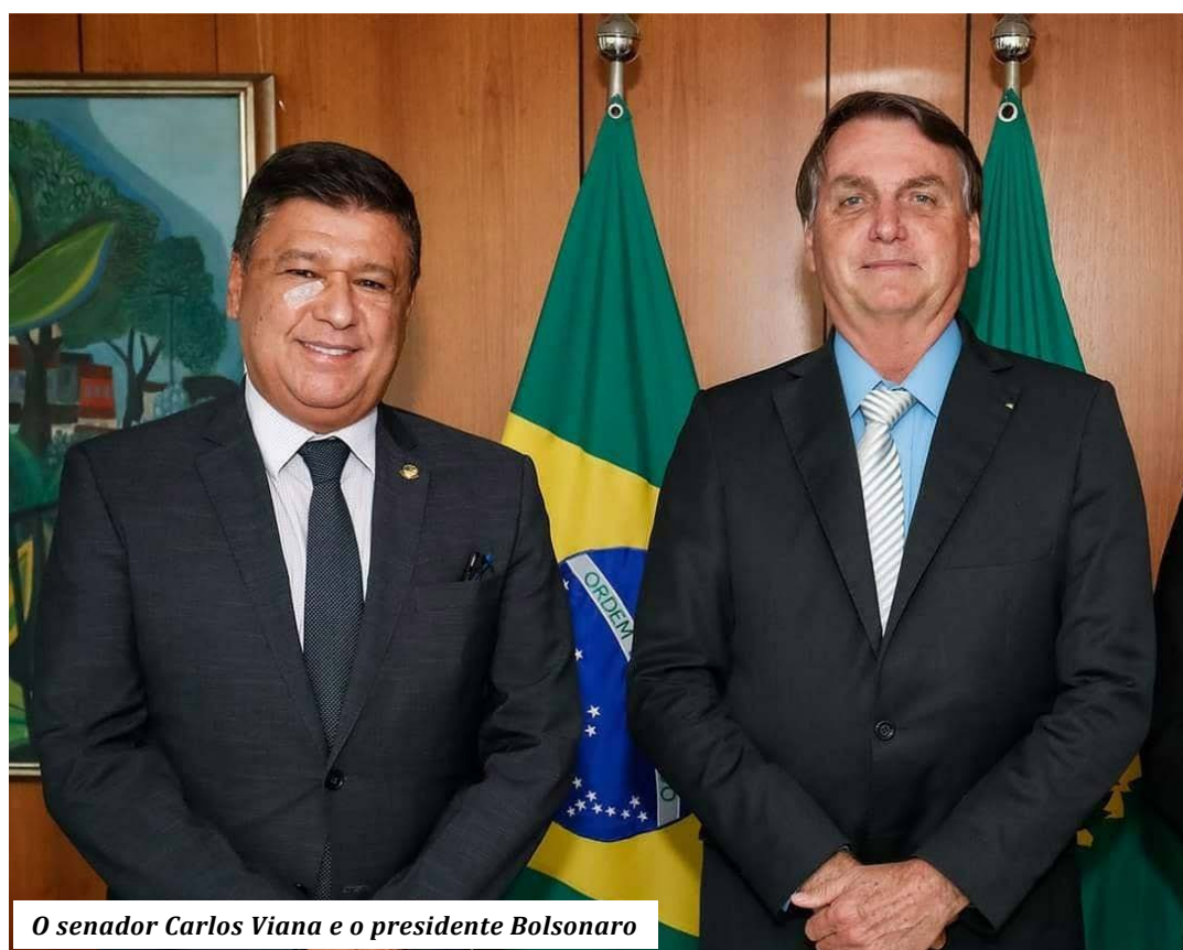
O senador Carlos Viana e o presidente Bolsonaro