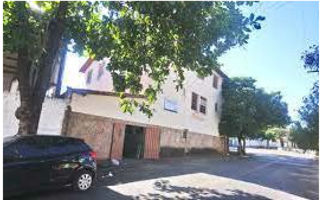
O local onde estão os venezuelanos