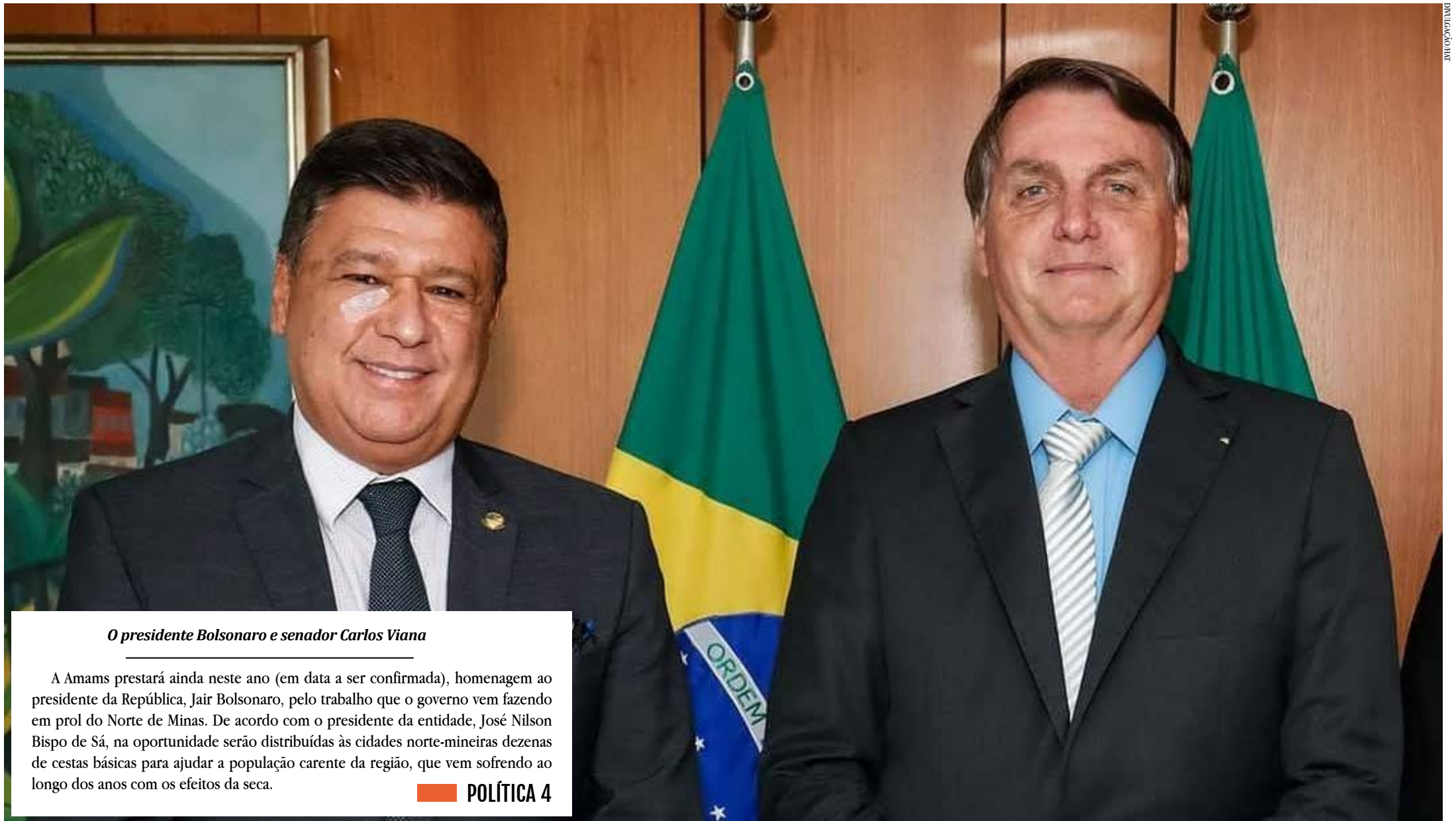
O presidente Bolsonaro e senador Carlos Viana