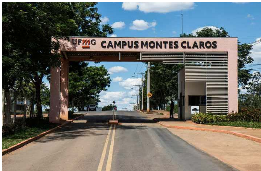
A entrada do campus do Instituto de Ciências Agrárias da UFMG, em Montes Claros

Deve-se destacar, que a maior parte do orçamento dessas instituições são para cumprir contratos continuados vigentes, ou seja, compromissos já assumidos. Dessa forma, os cortes poderão inviabilizar o funcionamento das Universidades e, também, ocasionar descumprimento de contratos administrativos e, consequentemente, causar insegurança nos trabalhadores e fornecedores agravando a crise social atual, além de comprometer as atividades de ensino, pesquisa e extensão. Cabe reforçar que, mesmo no contexto da pandemia e de ensino remoto, as IFES mineiras não apenas continuam atuando intensamente no ensino, pes-