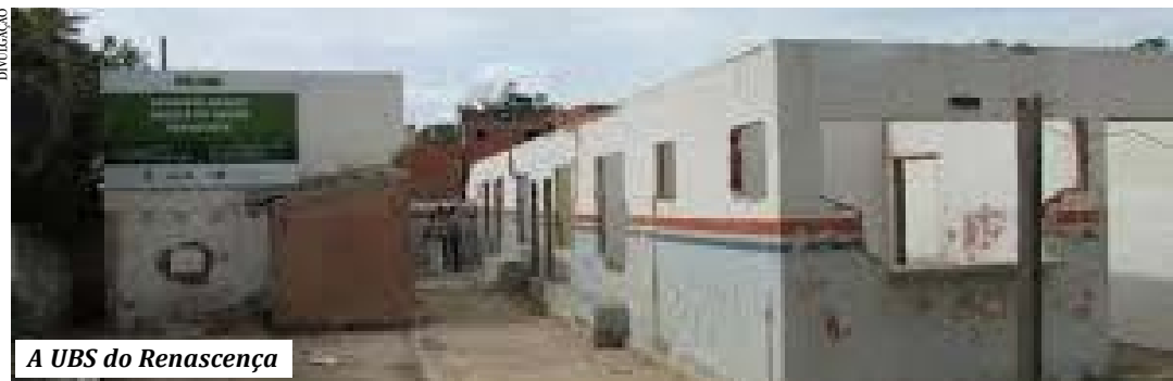
A UBS do Renascença

de qualificação profissional para que os venezuelanos possam encontrar trabalhos na cidade.