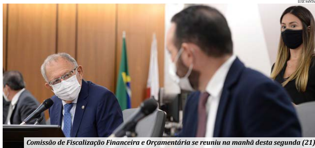
Comissão de Fiscalização Financeira e Orçamentária se reuniu na manhã desta segunda (21)

Os principais pontos que o projeto pretende alterar dizem respeito ao Centro de Autocomposição de Conflitos e aos Grupos Especiais de Atuação Funcional, bem como à eleição e posse do procurador-geral de Justiça e à competência e organiza-