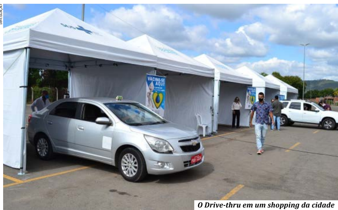
O Drive-thru em um shopping da cidade

Francisco Sá (Hospital Municipal de Francisco Sá), Grão Mogol (Fundação Santo Antonio), Jaíba (Hospital Municipal de Jaíba), Janaúba (Fundação Hospitalar de Janaúba), Mato Verde (Ambulatório Municipal de Mato Verde), Monte Azul (Hospital e Maternidade Nossa Senhora das Graças), Montes Claros (Hospital Universitário Clemente de Faria), Monte Zuma (Centro de Saúde Santa Luzia), Ninheira (Centro de Saúde de Ninheira), Porteirinha (Hospital São Vicente de Paula), Rio Pardo de Minas (Hospital Tácioto de Freitas Costa), Salinas (Hospital Municipal Dr. Osvaldo Prediliano Santanna), São João do Paraíso (Fundação de Saúde de São João do Paraíso), Taiobeiras (Hospital Santo Antônio).