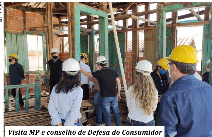
Visita MP e conselho de Defesa do Consumidor

social. Ele lembra que a iniciativa é referendada pelo Estado, que criou programa similar.