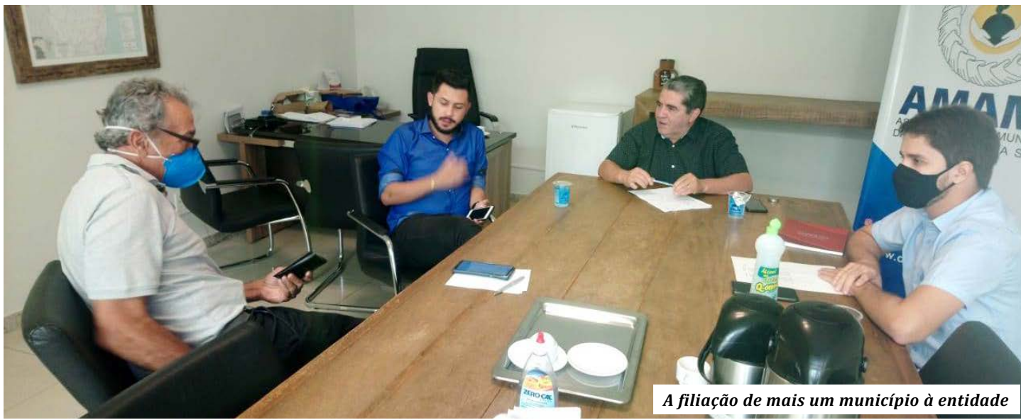
A filiação de mais um município à entidade