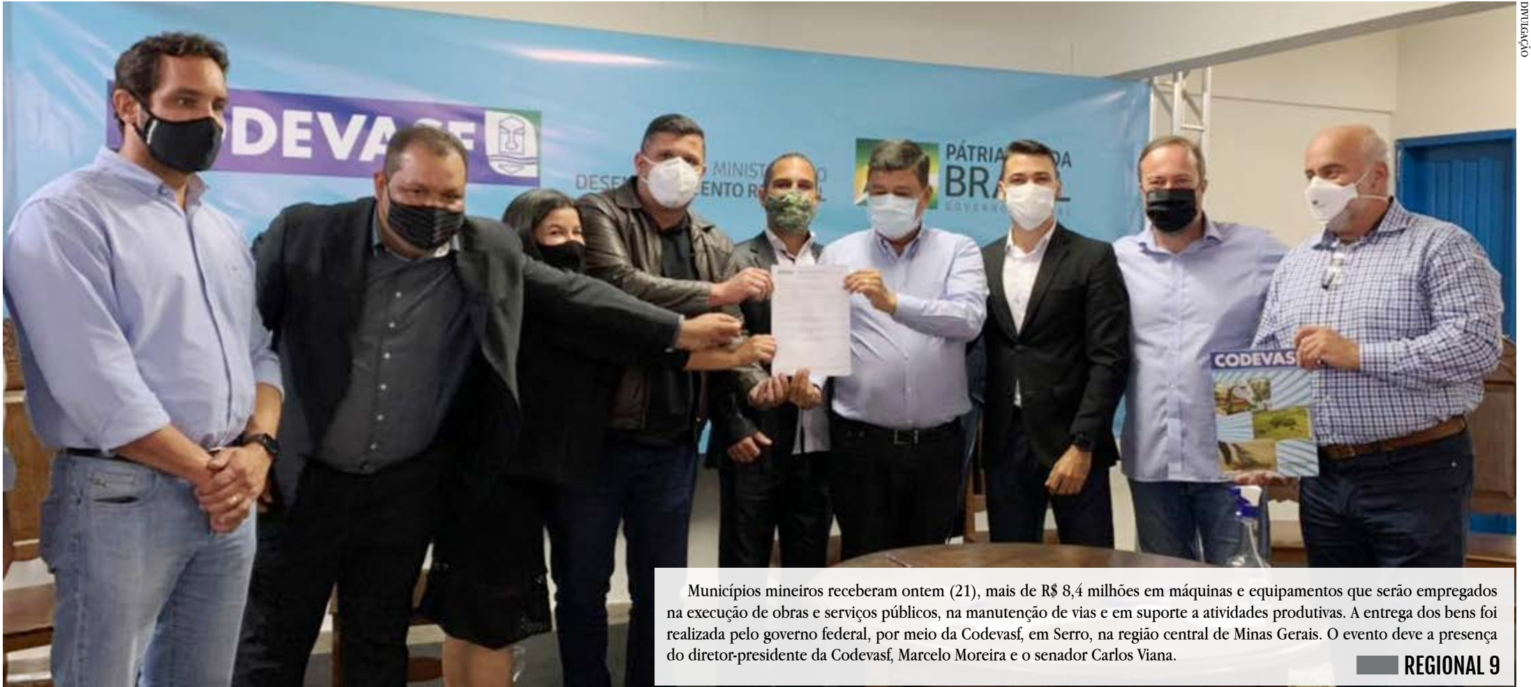
Municípios mineiros receberam ontem (21), mais de R$ 8,4 milhões em máquinas e equipamentos que serão empregados na execução de obras e serviços públicos, na manutenção de vias e em suporte a atividades produtivas. A entrega dos bens foi realizada pelo governo federal, por meio da Codevasf, em Serro, na região central de Minas Gerais. O evento teve a presença do diretor-presidente da Codevasf, Marcelo Moreira e o senador Carlos Viana.