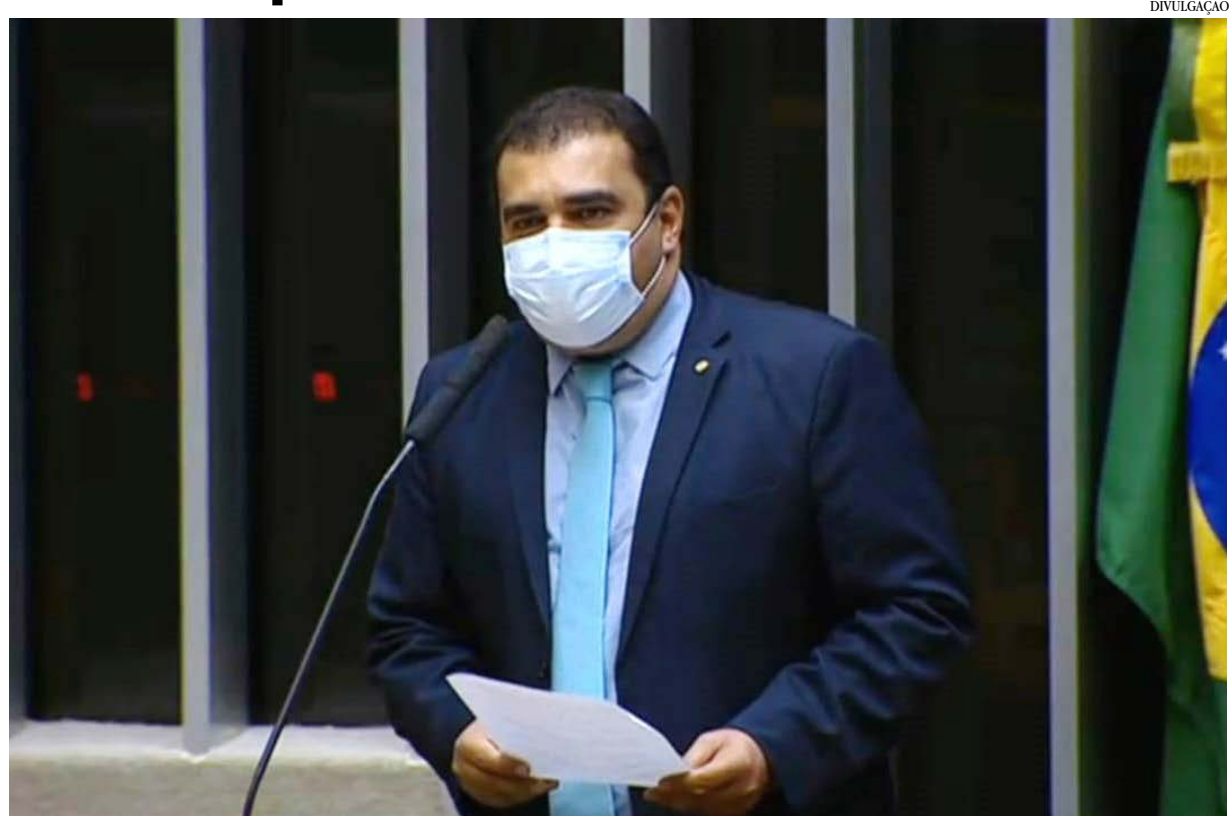
Garantir saúde plena e atendimento de qualidade para a população do Norte de Minas Gerais. Com esse objetivo, o deputado federal Delegado Marcelo Freitas (PSL/MG) liberou, nesse ano de 2021, recursos da ordem de R$ 40 milhões, através de emendas parlamentares, para municípios do Norte de Minas.

SAÚDE 7 Lions pede descentralização do soro contra picadas de escorpiões