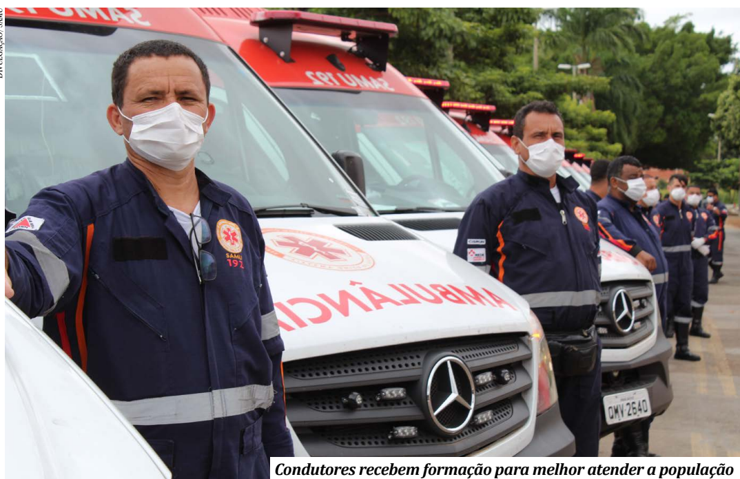
Condutores recebem formação para melhor atender a população

O Consórcio Intermunicipal de Saúde da Rede de Urgência do Norte de Minas (Cisrun) - SAMU Macro Norte, através de seu Núcleo de Educação Permanente (NEP), realizará, a partir de segunda-feira (21) até 25 de junho, a "Jornada Interna do Conductor Socorrista". A iniciativa tem como objetivo capacitar os profissionais da instituição que são responsáveis por conduzir as ambulâncias durante as ocorrências.