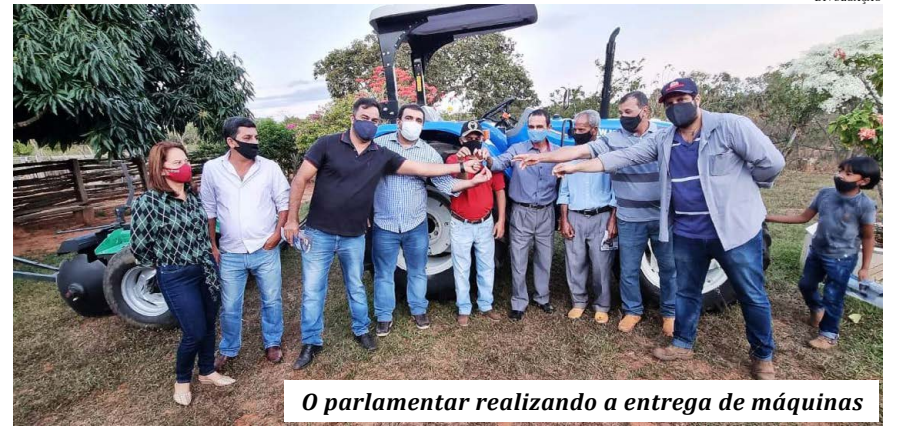
O parlamentar realizando a entrega de máquinas

minha vida no distrito de Vila Nova de Minas, conheço as necessidades das comunidades e das famílias do campo. Contribuir para melhorar a vida do homem do campo é uma de nossas bandeiras e eu jamais me esquecerei de minhas origens”, conclui Freitas. (GISSELE NIZA – Colaboradora)