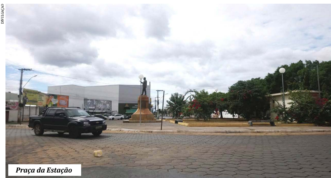
Praça da Estação

A cidade de Montes Claros sedia hoje, Dia do Trabalhador, dois eventos na área central, organizados pelos Bolsonaristas e Petista. Ambos estão programados para as 9 horas. Na praça Raul Soares, mas conhecida praça da Estação ferroviária, o PT realizará o projeto PT Solidário, quando receberá doação de alimentos a serem distribuídos depois para as famílias carentes. Às 10 horas, os bolsonaristas farão a concentração na avenida Deputado Esteves Rodrigues, em frente ao Senac, para depois saírem em carreta pela cidade. Os organizadores explicam que o ato