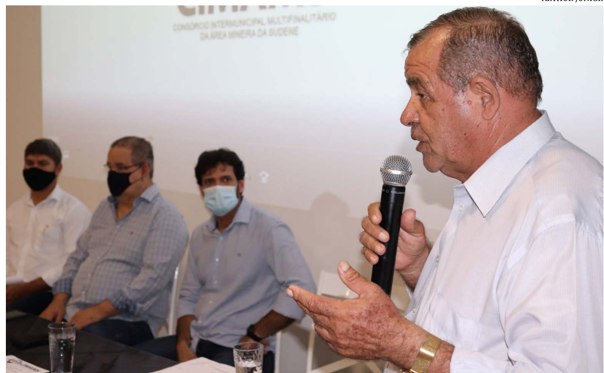
A antecipação do 1% do Fundo de Participação dos Municípios (FPM) para o mês de setembro deste ano. A reivindicação foi feita pelo presidente do Cimams, Valmir Morais de Sá, Prefeito de Patís, ao ex-ministro do Turismo, deputado federal Marcelo Álvaro Antônio (PSL), que esteve em visita a sede do consórcio e em reunião com alguns prefeitos da região, na quinta-feira (29/04).

Cimams pede antecipação de 1% do FPM para o mês de setembro deste ano