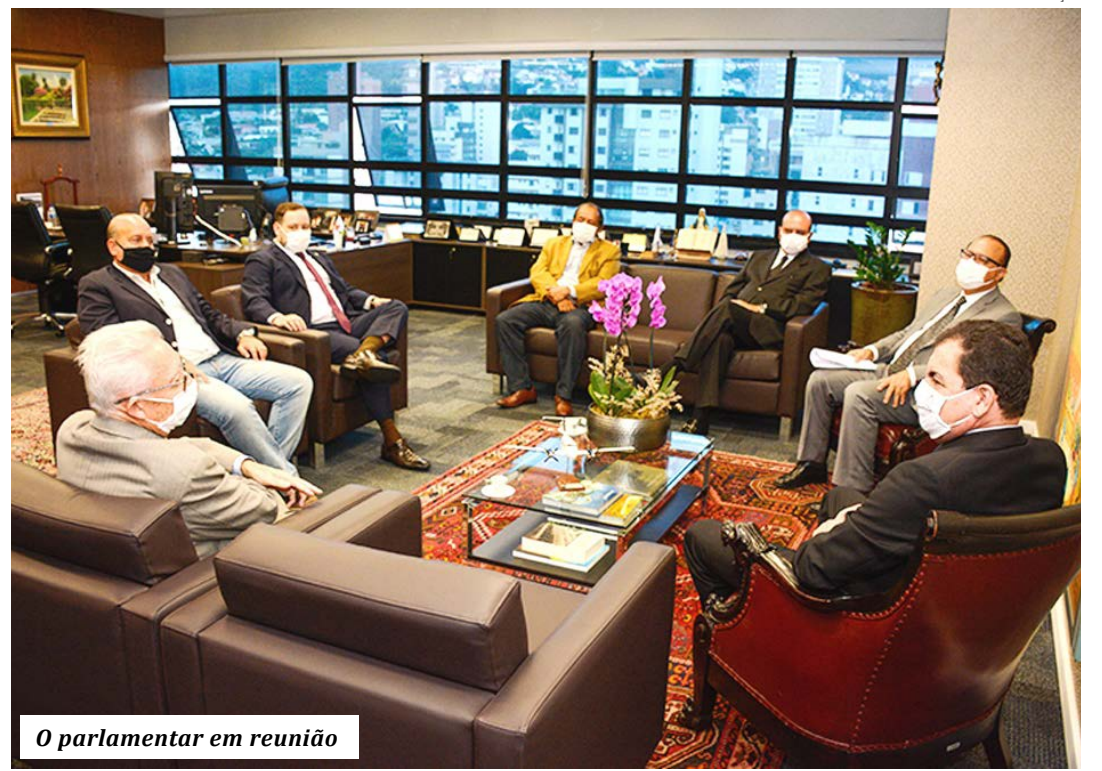
O parlamentar em reunião

“Vimos tratar da questão fundiária no Norte de Minas, especialmente em Rio Pardo de Minas, Santo Antônio do Retiro, Taiobeiras e Salinas. Nossa expectativa é que o Estado, junto com o Ministério Público, sob a coordenação do Tribunal, possa fazer uma conciliação. Isso vai promover o desenvolvimento e gerar empregos, já que abre possibilidade de viabilizar projetos para explorar as energias solar e eólica, que estão avançando muito na região”, afirmou o deputado.