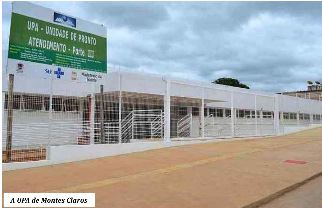
A UPA de Montes Claros