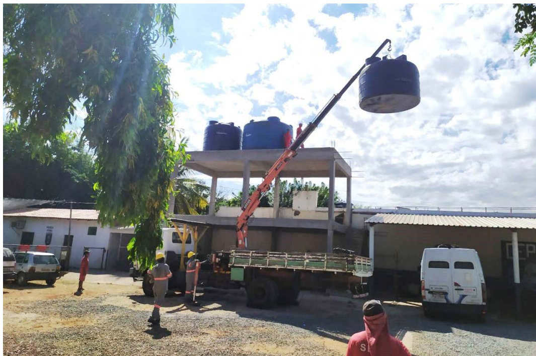
Parceria com a Prefeitura e Poder Judiciário viabiliza fornecimento alternativo e obras hidráulicas. Poço artesiano e três novas caixas d'água trouxeram a solução

A solução estava basicamente em apenas 100 metros de encanamento, que leva a água do poço até as três novas caixas do presídio, com capacidade total de 30 mil litros. O material para a realização desta obra, ainda não