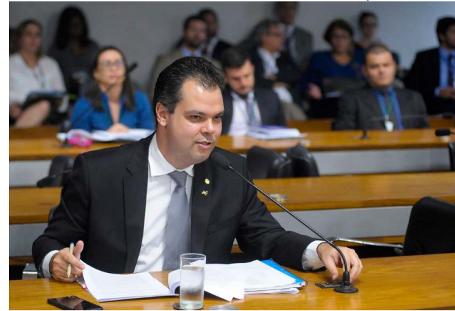
Bruno Covas foi deputado federal antes de ser eleito vice-prefeito de São Paulo. Na foto, participa, em 2016, de reunião de comissão mista no Senado Federal

O presidente do Senado, Rodrigo Pacheco, divulgou neste domingo (16) nota de pesar pelo falecimento do prefeito de São Paulo, Bruno Covas. O político do PSDB, de 41 anos, morreu às 8h20 deste domingo vítima de um câncer no sistema digestivo contra o qual lutava desde 2019. Bruno era neto de Mário Covas, que também foi prefeito da capital paulista e governador do estado, e deixa o filho Tomás, de 15 anos.