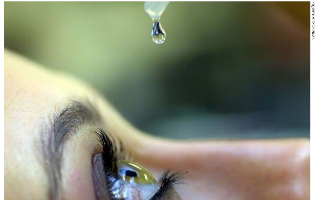
Com o tema 24 Horas pelo Glaucoma a campanha teve início hoje