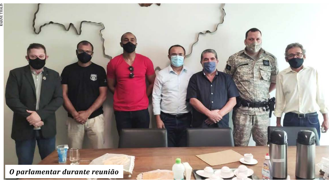
O parlamentar durante reunião