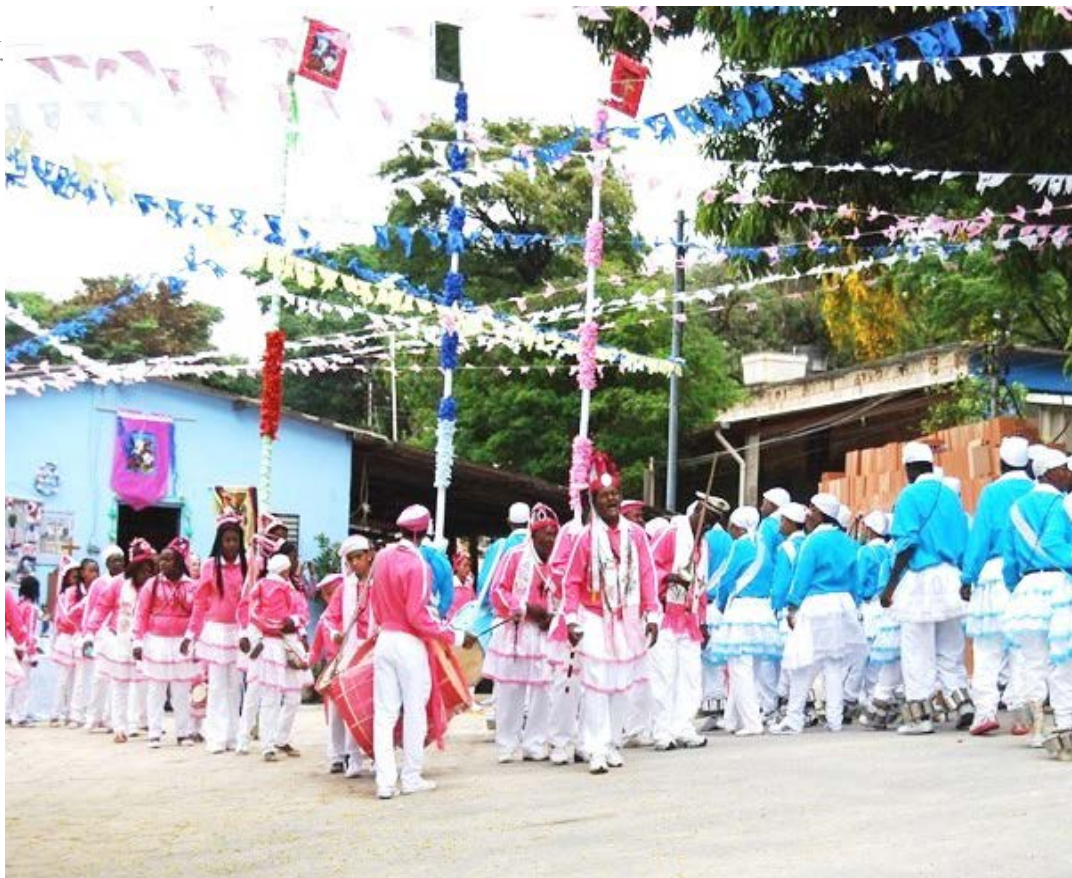
Pesquisa conta com formulário disponível no site do Instituto; preenchimento até 31/12 é válido para pontuar no Programa ICMS Patrimônio Cultural

O Instituto Estadual do Patrimônio Histórico e Artístico (Iepha-MG) já está fazendo o trabalho de pesquisa para reconhecimento dos Reinados e Congados de Minas Gerais como patrimônio cultural imaterial do estado, por sua importância como bem cultural ímpar da identidade e cultura dos mineiros. A ação também tem como objetivo atender desejo das comunidades congadeiras, prefeituras, pesquisadores e associações da sociedade civil.