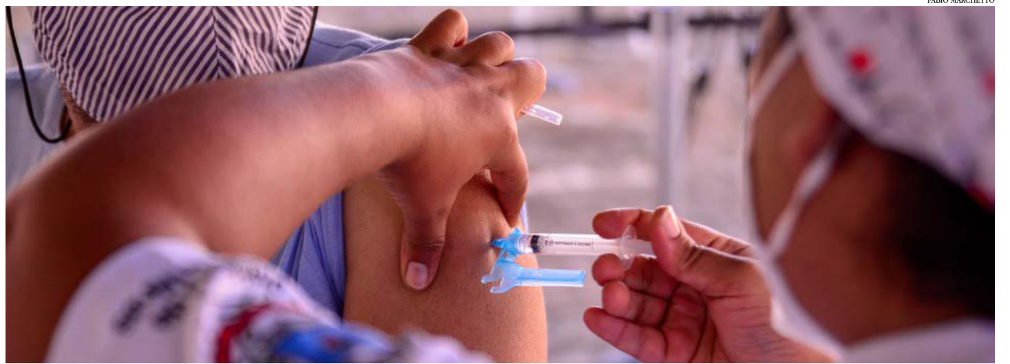
Queda é mais expressiva em pessoas acima dos 80 anos, que receberam doses na maior operação de vacinação da história de Minas Gerais

Entre os idosos de 70 a 79 anos, o percentual de internados caiu de 20,6%, em janeiro, para 15,9%, em abril. Entre as pessoas acima de 90 anos, 5,1% estavam na UTI por Covid-19 em janeiro; na última semana de abril este índice passou para 1,7% do total. "A vacina garante a segurança sanitária de toda a população. Os estudos científicos publicados até o momento comprovam