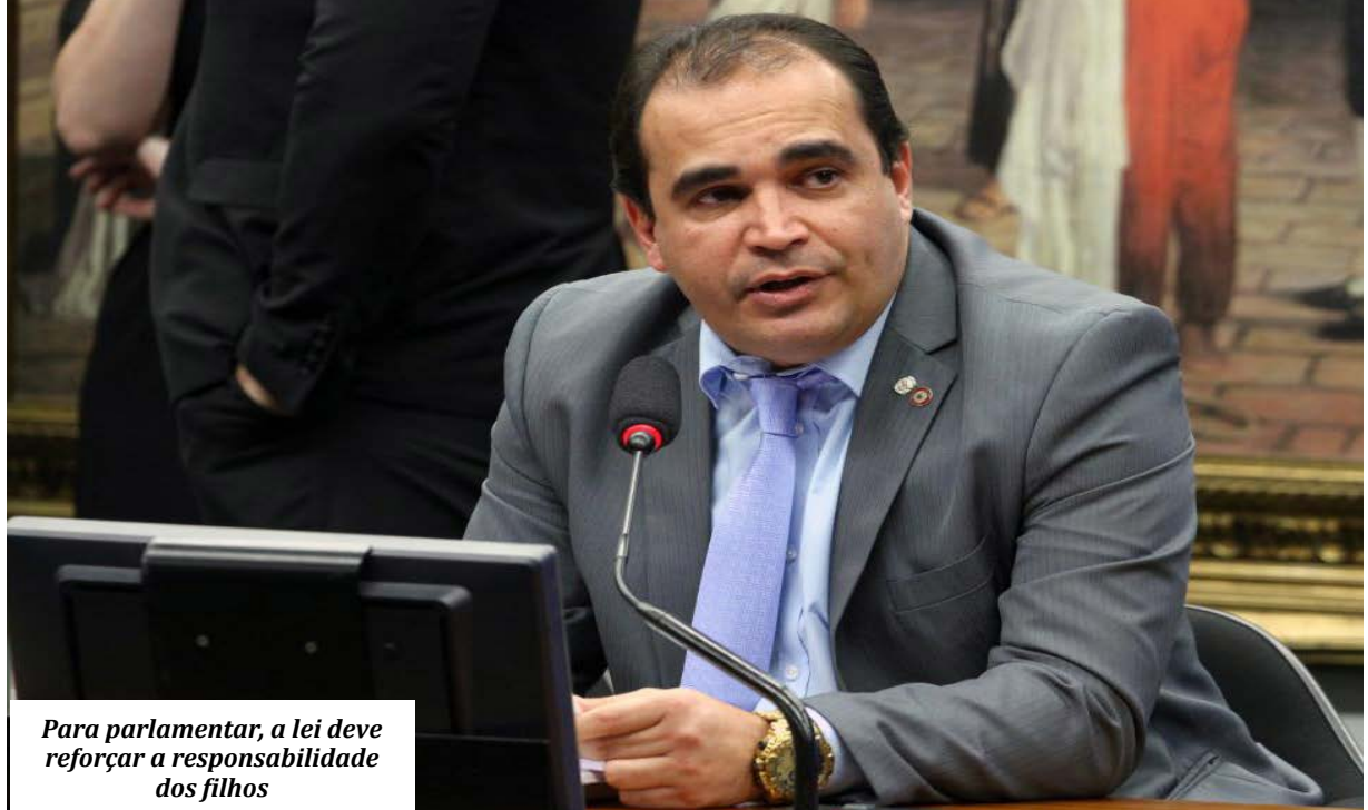
Para parlamentar, a lei deve reforçar a responsabilidade dos filhos