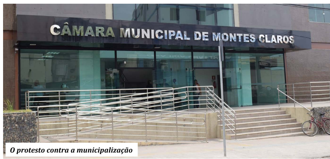
O protesto contra a municipalização

No ano de 2016 ocorreu a estadualização de várias escolas em Montes Claros, como a Sanya Terzinha no Renascença ou mesmo a Nereide de Carvalho, mas na época os moradores e alunos realizaram vários protestos, revertendo a situação.