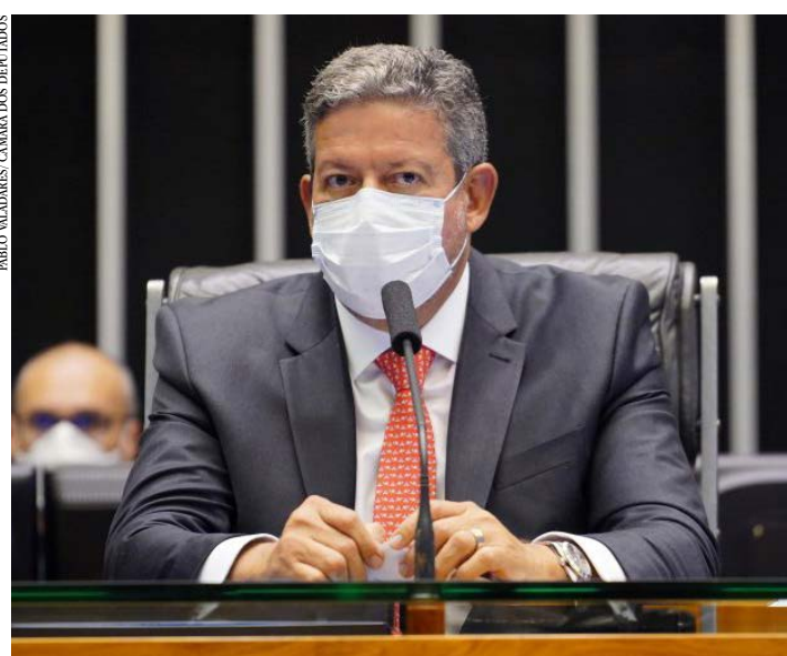
Lira preside a sessão na quarta, quando a votação de MPs liberou a pauta da Casa

servidor, que já está em dificuldade, sem receber salário ou benefícios, por exemplo, enquanto aguarda uma decisão final sobre esses pagamentos. (Portal ALMG)