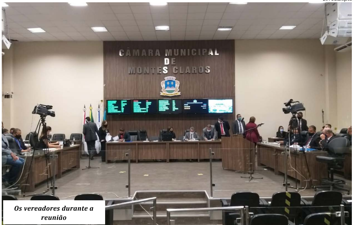
Os vereadores durante a reunião

A Câmara de Vereadores de Montes Claros aprovou na quinta-feira, em sessão extraordinária o projeto de lei nº42/2021, que autoriza repasse de recursos financeiros às instituições de educação de ensino infantil e especial que autoriza repasse de R$ 4.978.147,42 para as escolas conveniadas.