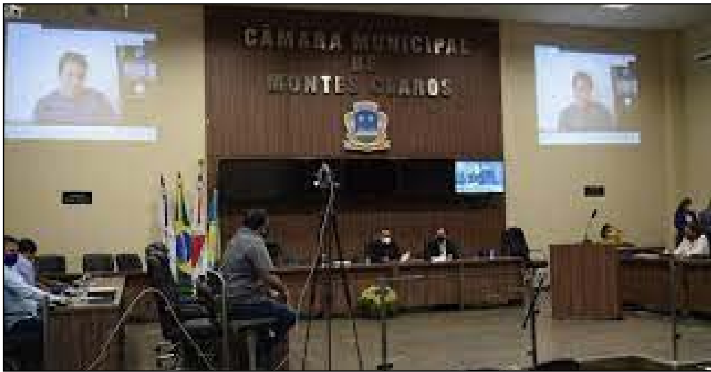
O Parlamento Jovem em Montes Claros

Para o presidente da Assembleia Legislativa, deputado Agostinho Patrus (PV), o PJ aborda pluralidades, o que enriquece as ações desenvolvidas pelos participantes. Entre os