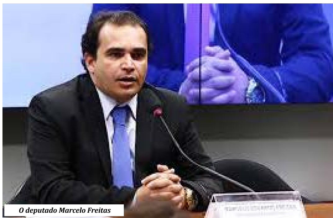
O deputado Marcelo Freitas