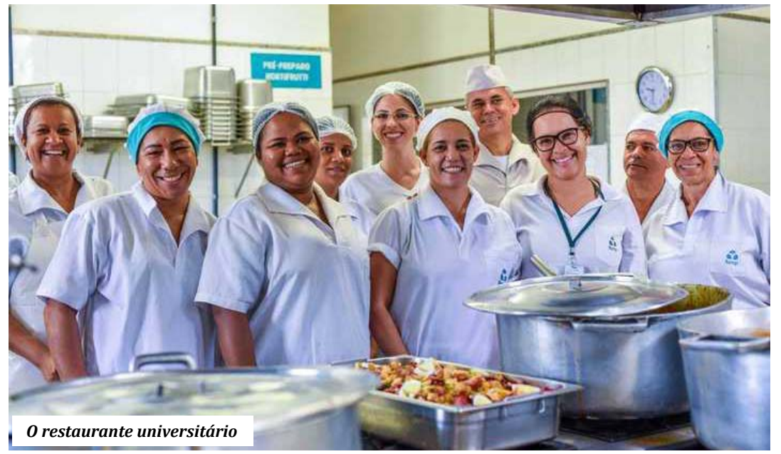
O restaurante universitário

Os usuários dos RUs devem apresentar a carteira única da UFMG e um documento oficial de identificação com foto (carteira de identidade, carteira nacional de habilitação, passaporte, carteira de trabalho e carteira de ordens profissionais). A carteirinha contém um código de barras que permite a identificação automática do preço da refeição do usuário, de acordo com sua categoria.