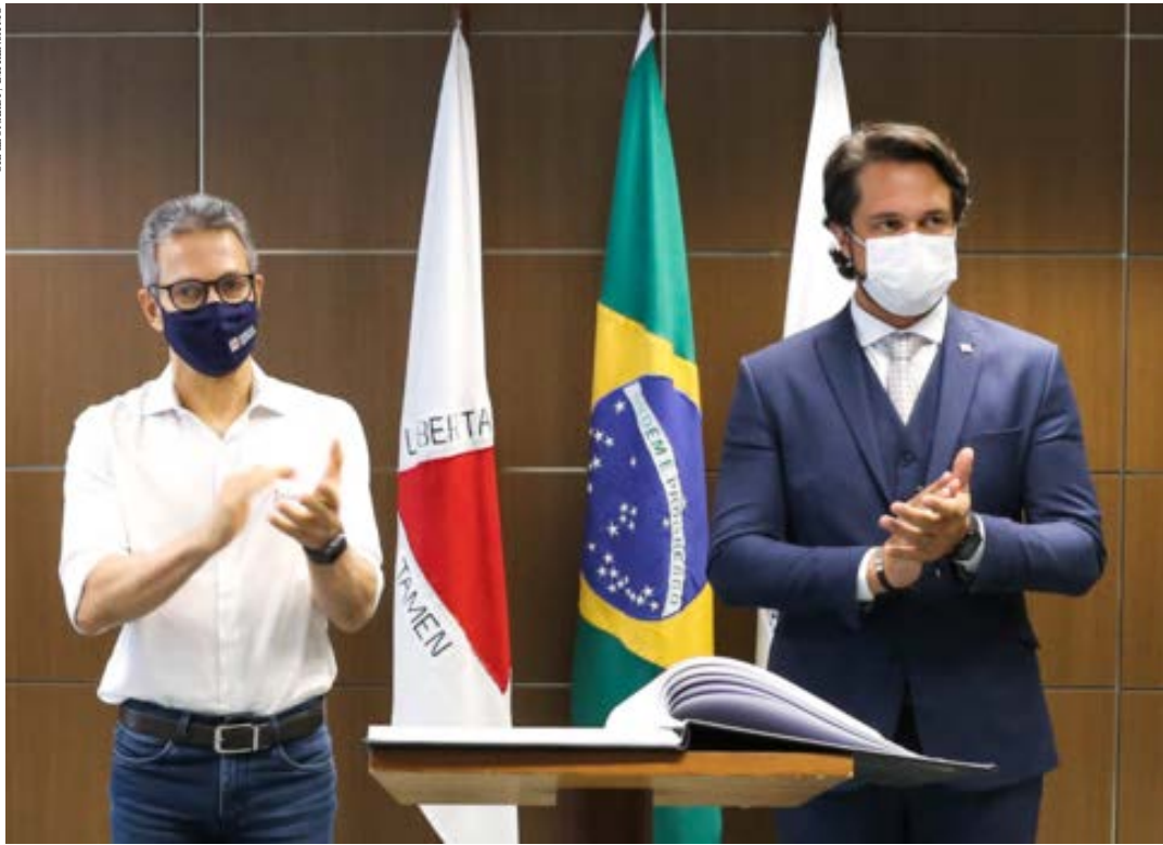
Servidor de carreira, administrador já atuava na pasta que acumula R$ 118 bi em atração de novos negócios desde o início da atual gestão

O governador Romeu Zema empossou, ontem (13), o novo secretário de Desenvolvimento