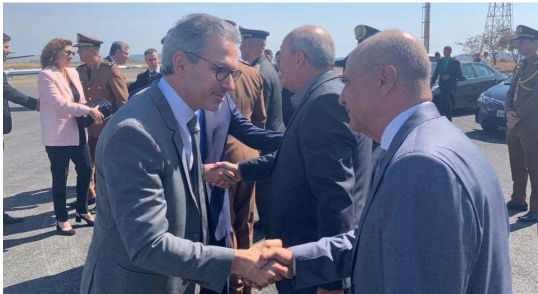
Na próxima sexta-feira, dia 16 deste mês, o Governador Romeu Zema estará em Montes Claros e também em Bocaiuva, já para assinar a ordem de serviço

O deputado estadual Arlen Santiago encaminhou pedido ao governador Romeu Zema, para que seja dada a ordem de início das obras de duplicação da BR-135, que conecta os municípios de Montes Claros a Bocaiuva, além de ligar Corinto e Curvelo a BR-040. O trecho é administrado pela ECO 135 Concessionária de Rodovias S/A e é um dos mais importantes do Norte de Minas. Na próxima sexta-