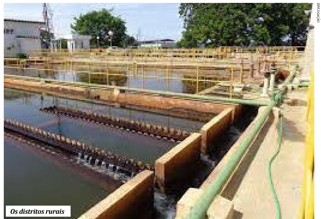
Os distritos rurais

“Queremos que as famílias mineiras destes 38 municípios possam ter acesso a serviços de saneamento básico de qualidade, ao mesmo tempo em que permitimos que elas tenham mais saúde. Essa é uma das prioridades do MDR e do Governo Federal, com o apoio irrestrito do presidente Jair Bolsonaro”, destacou o ministro do Desenvolvimento Regional, Rogério Marinho. A Copasa poderá captar no mercado financeiro até R$ 243,7 milhões para obras de saneamento em 37 cidades de Minas Gerais, que beneficiarão cerca de 1,78 milhão de pessoas.