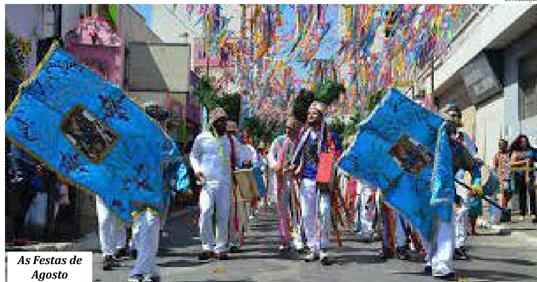
As Festas de Agosto