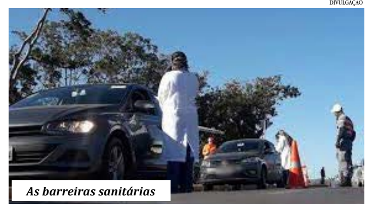
As barreiras sanitárias