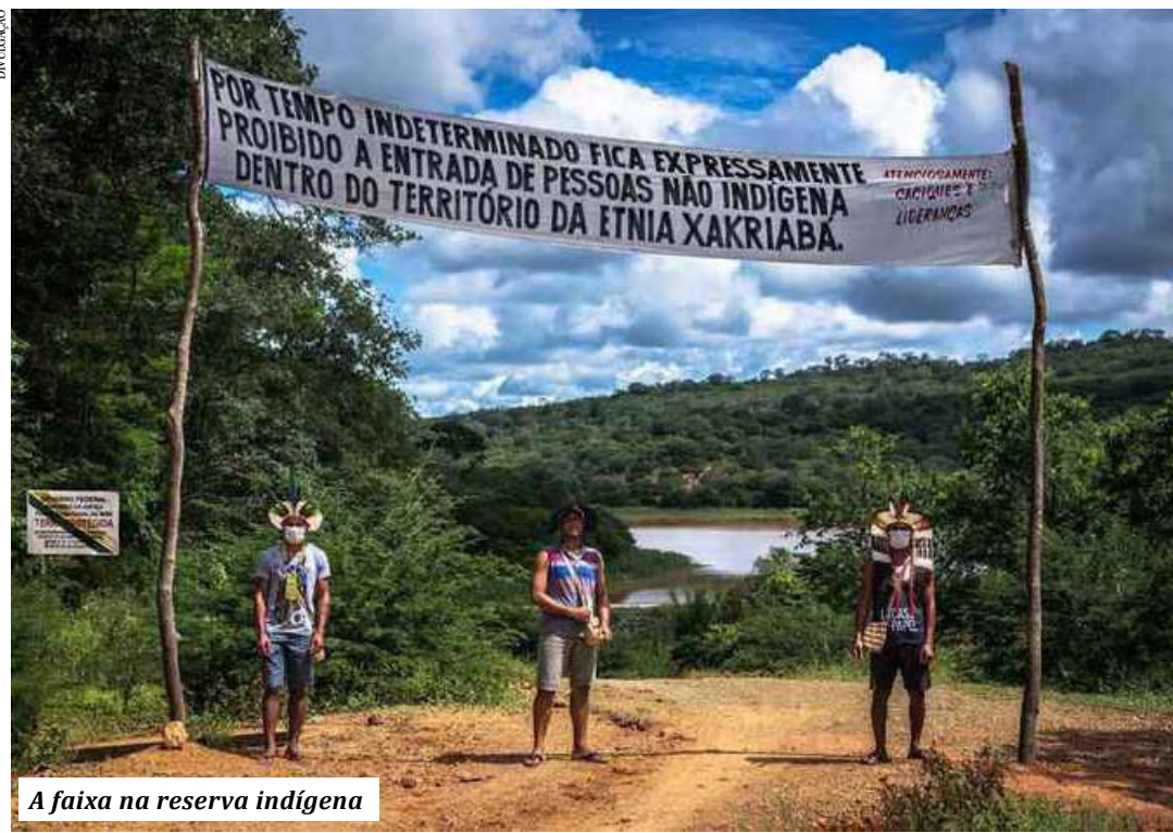
A faixa na reserva indígena

A Universidade Federal de Minas Gerais mostrou a atuação que teve na preservação dos indígenas Xacriabás, sediados em São João das Missões, no Norte de Minas, nessa época da pandemia coronavírus. O relato mostra que o coronavírus não