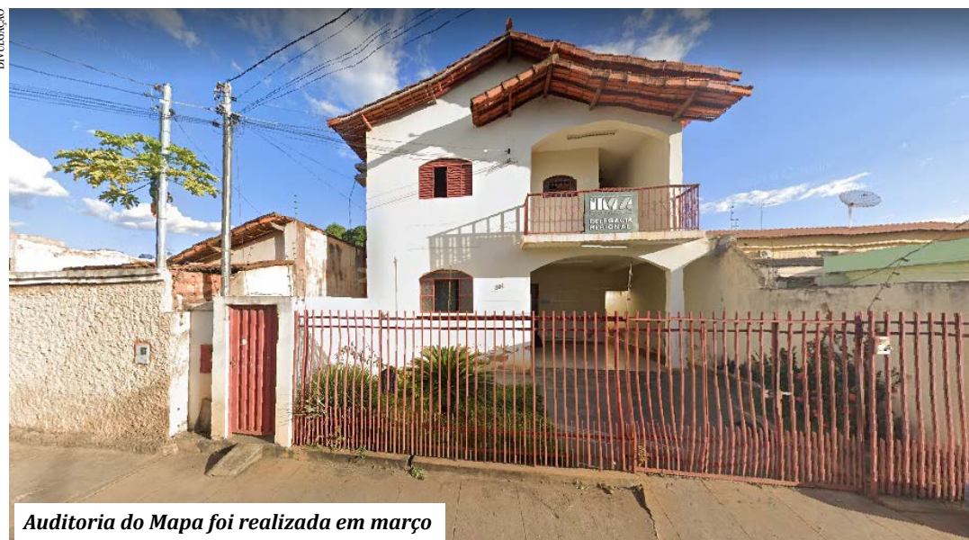
Auditoria do Mapa foi realizada em março

O Instituto Mineiro de Agropecuária (IMA), vinculado à Secretaria de Agricultura, Pecuária e Abastecimento (Seapa), recebeu, em março, auditoria do Ministério da Agricultura, Pecuária e Abastecimento (Mapa). O resultado do levantamento manteve o credencia-