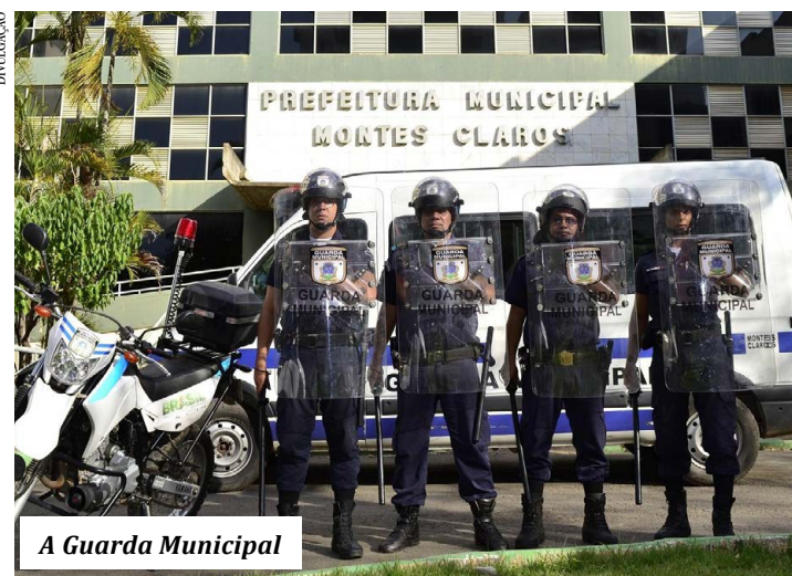
A Guarda Municipal

Claros. Com a divulgação do resultado do segundo Curso de Capacitação e Formação e do resultado da investigação social, os 41 candidatos aprovados serão convocados para a realização imediata dos exames médicos admissionais, de acordo com cronograma a ser estabelecido pela Secretaria de Planejamento e Gestão. (GA)