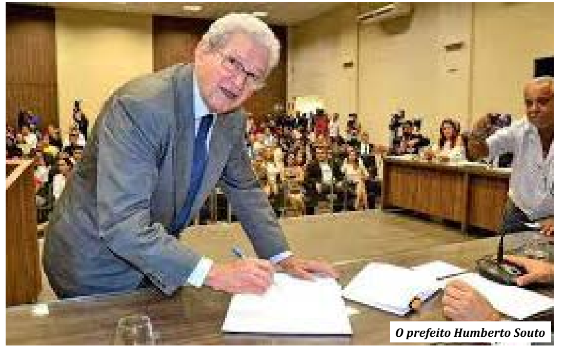
O prefeito Humberto Souto

Na manhã de ontem, o Comitê Municipal da Covid se reuniu na sede da Região Integrada de Segurança Pública, quando tomou a decisão de aguardar o posicionamento do Comitê Estadual, que se reúne hoje em Belo Hori-