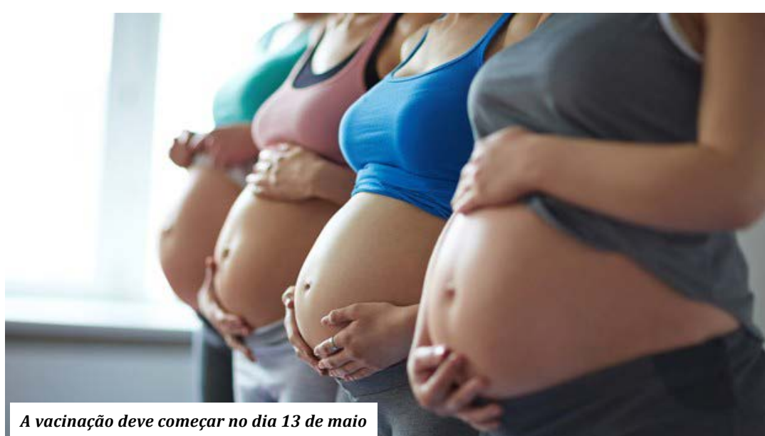
A vacinação deve começar no dia 13 de maio