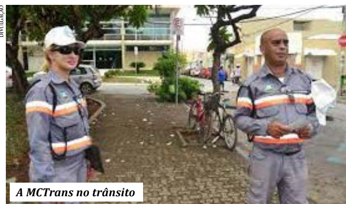
A MCTrans no trânsito

publicar novas deliberações. O descumprimento das regras previstas no presente Decreto implicará na aplicação das penalidades descritas no artigo 25, do Decreto Municipal n.º 4046/2020, além de eventuais punições no âmbito penal, a cargo da autoridade competente.