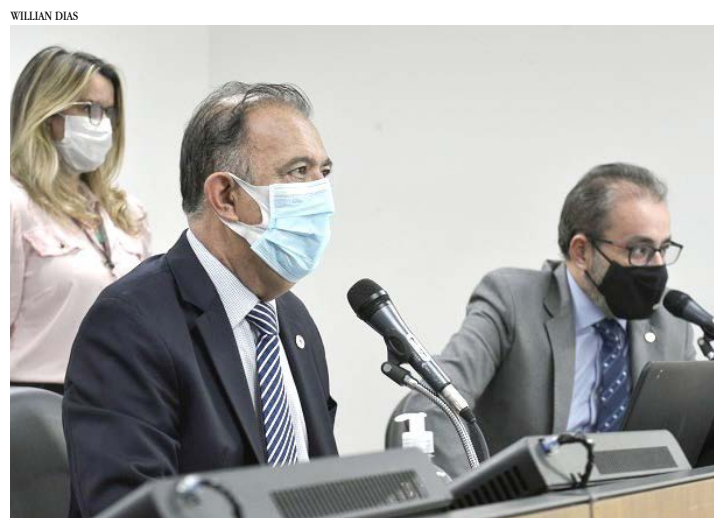
Requerimentos foram aprovados nesta terça-feira (27)

deverão escolher se mandarão ou não seus filhos para as escolas, aqueles que não se sentirem seguros, poderão continuar acompanhados de forma virtual. Lembrou também sobre a calamidade em toda rede de saúde do país.