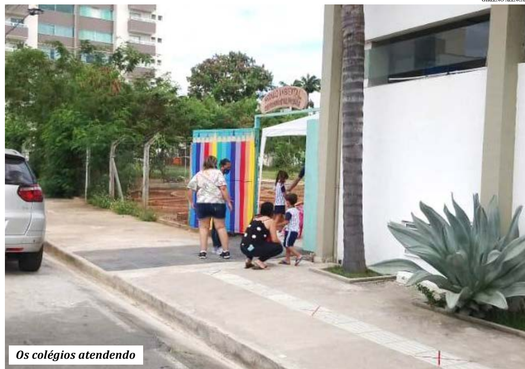
Os colégios atendendo

A partir do dia 24 de maio de 2021, o revezamento do ensino presencial poderá ocorrer de modo que no máximo, compareçam 50% (cinquenta por cento) dos alunos, em cada dia, para as aulas presenciais, devendo os demais alunos acompanhar as aulas via rede mundial de computadores ou através de material didático específico, com o conteúdo ministrado em sala de aula. As aulas e demais atividades de ensino, na rede pública municipal, ficam autorizadas, com funcionamento presencial, seguindo ao disposto no Decreto Municipal n.º 4169/21, a partir do dia 24 de maio de 2021. Para a manutenção do retorno