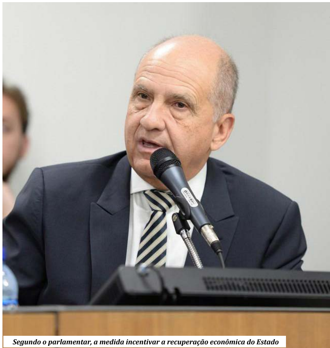
Segundo o parlamentar, a medida incentiva a recuperação econômica do Estado