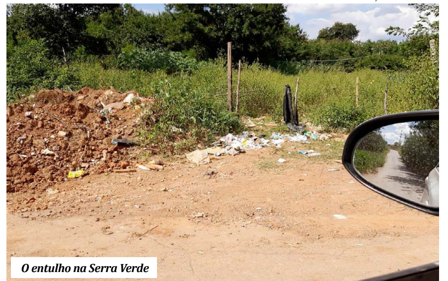
O entulho na Serra Verde