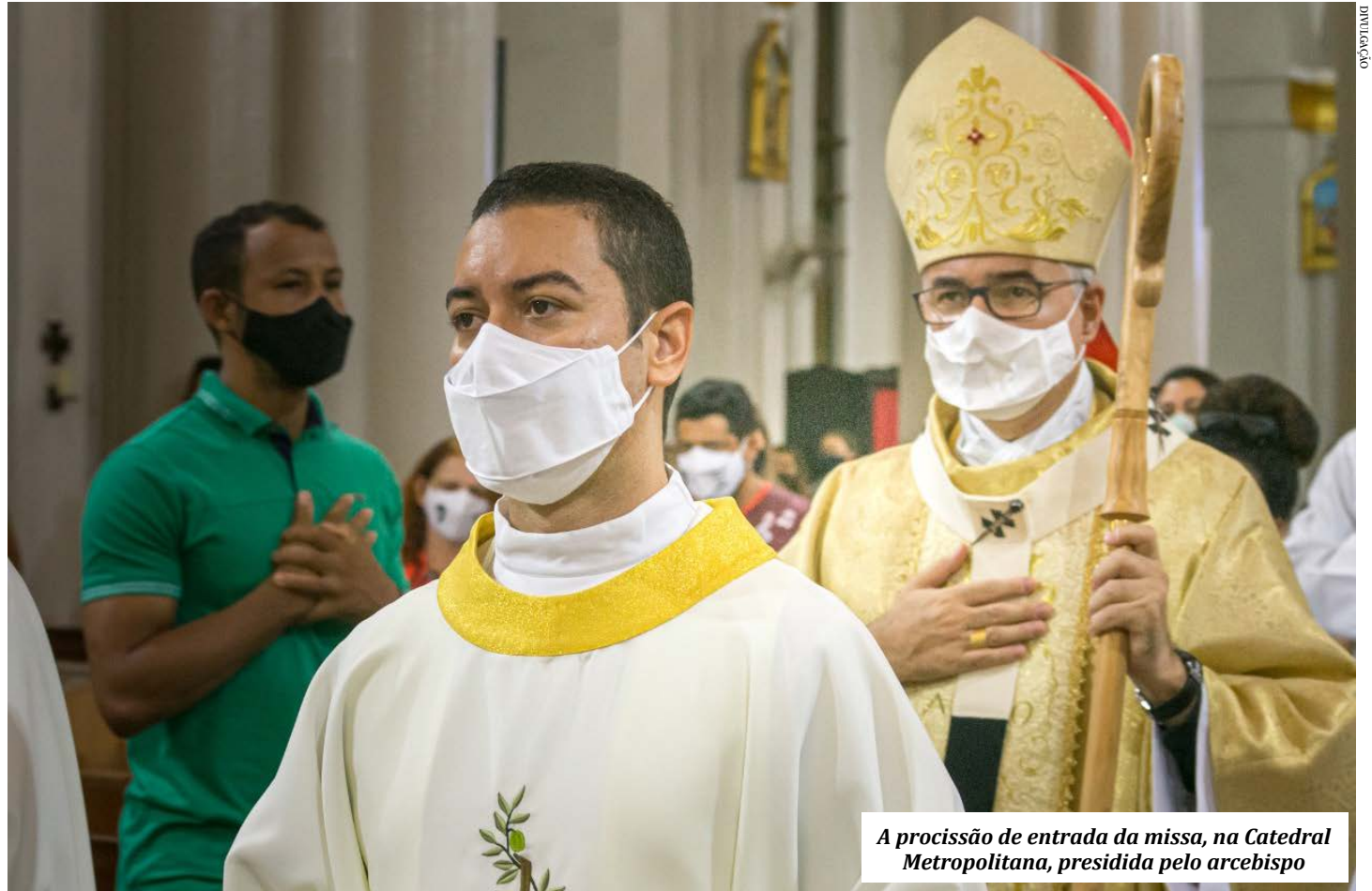
A procissão de entrada da missa, na Catedral Metropolitana, presidida pelo arcebispo