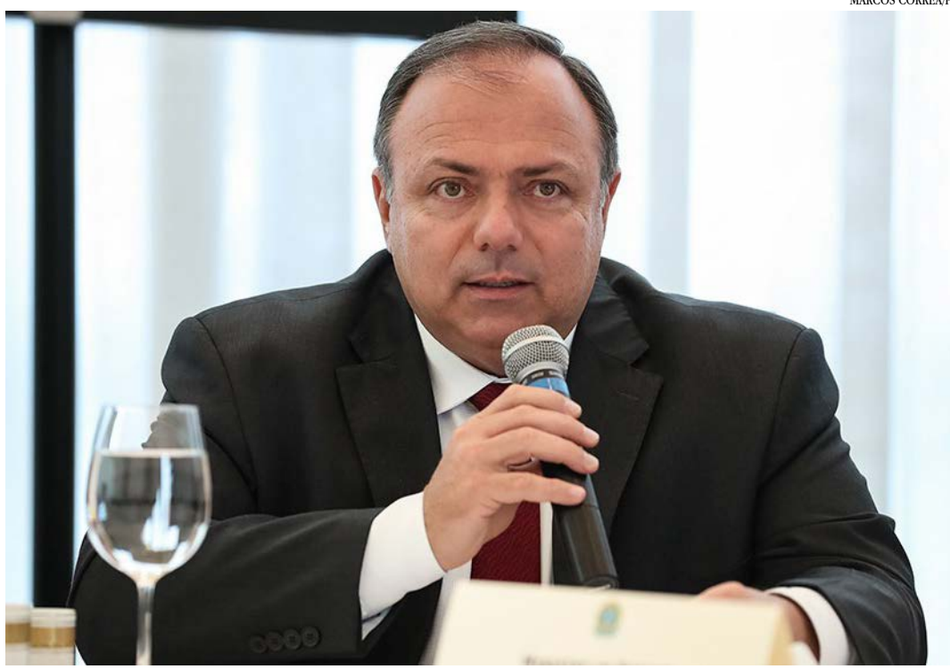
O general Eduardo Pazuello, ex-ministro da Saúde, poderá ser ouvido pela comissão

Girão e o senador Humberto Costa (PT-PE) também querem ouvir representantes do Conselho Federal de Medicina (CFM) sobre