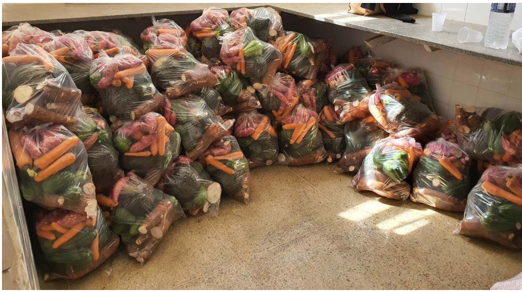
Os alimentos que serão doados