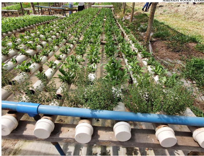
A hidroponia dispensa o uso do solo e utiliza soluções que contêm todos os nutrientes essenciais para a produção das plantas

Você já ouviu falar de cultivo protegido? O sistema consiste no plantio de qualquer cultura sob uma estrutura que garanta proteção contra as adversidades