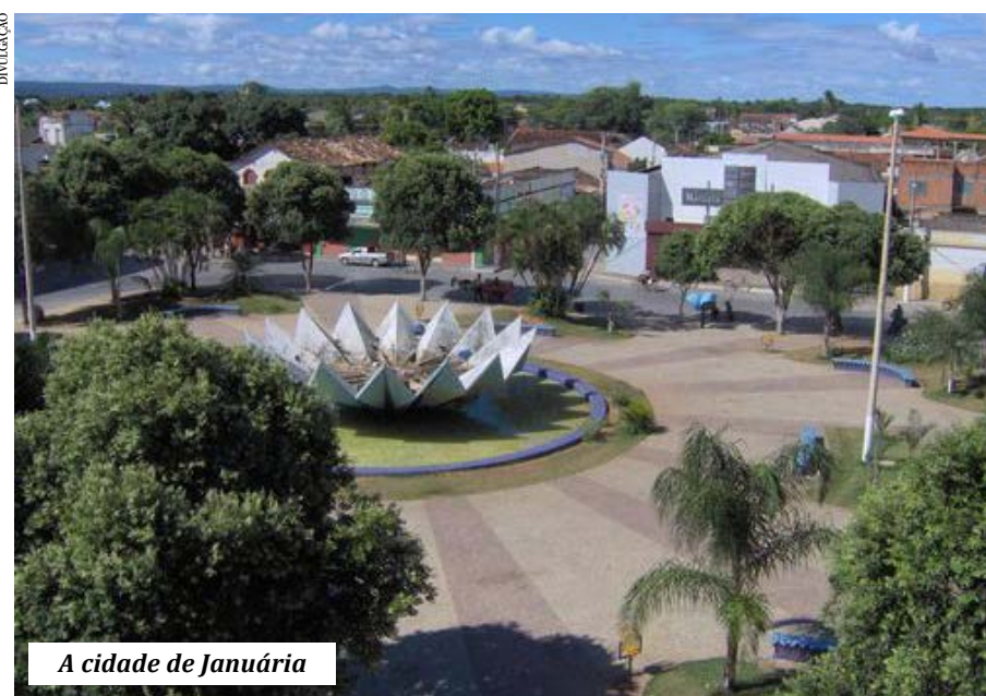
A cidade de Januária