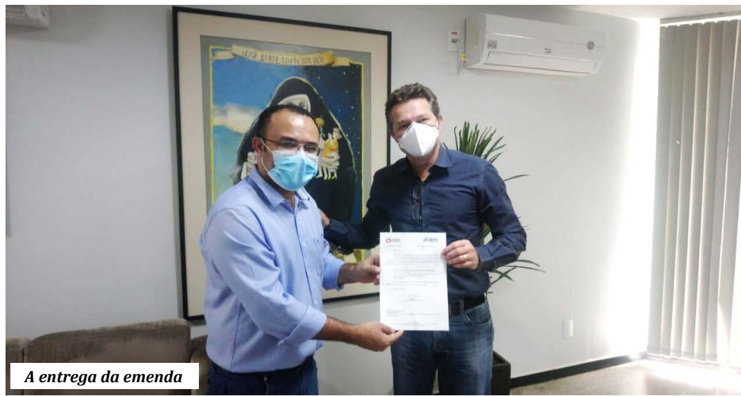
A entrega da emenda

Ainda pediu que a Santa Casa estudasse a possibilidade de montar o serviço de hemodiálise, pois os pacientes de rins daquela microrregião são atendidos em Brasília de Minas ou Montes Claros. Como a Prefeitura fez licitação para a nefrologia e o vencedor ainda não cumpriu o contrato, Januária buscará novas parcerias, como forma de aliviar a situação desses pacientes. A Santa Casa ficou de analisar a situação para definir se aceita também montar o serviço de hemodiálise.