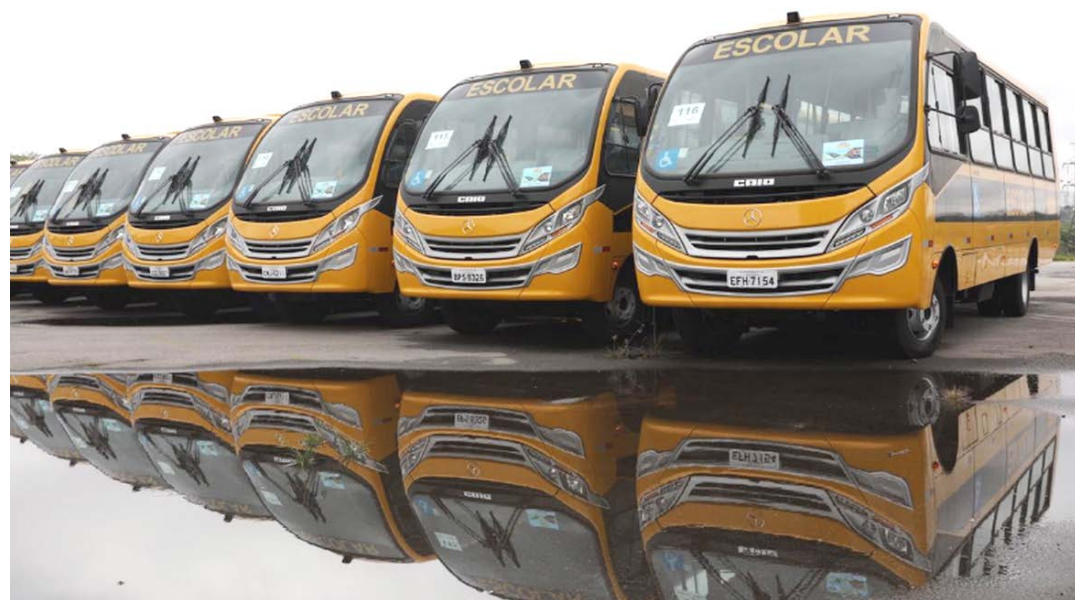
Novas orientações são para os gestores da rede pública de ensino

interessados podem acessar, no site do FNDE, o Guia Prático sobre os Programas de Manutenção Escolar