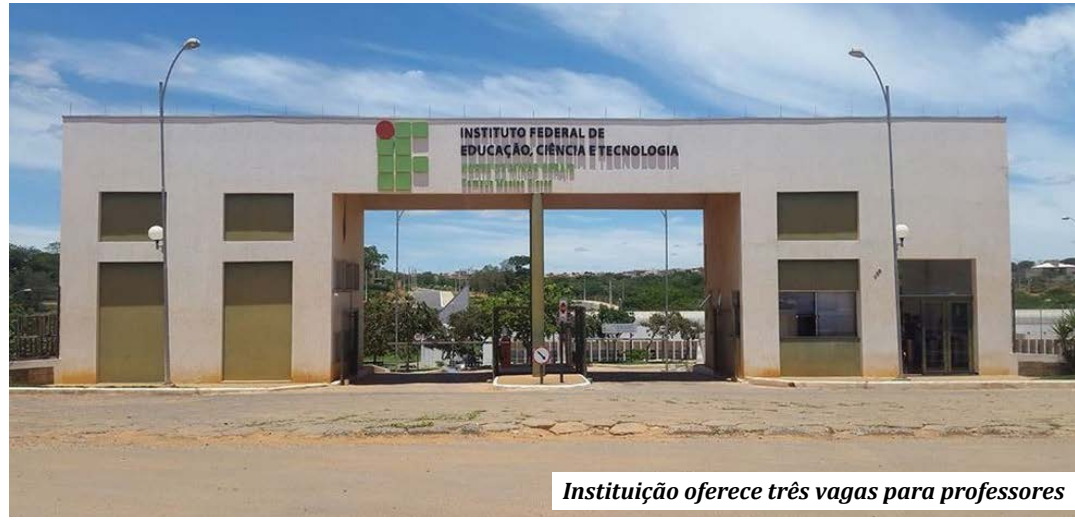
Instituição oferece três vagas para professores

Para mais informações, consulte o Edital nº 10/2021 do IFNMG-Campus Montes Claros.