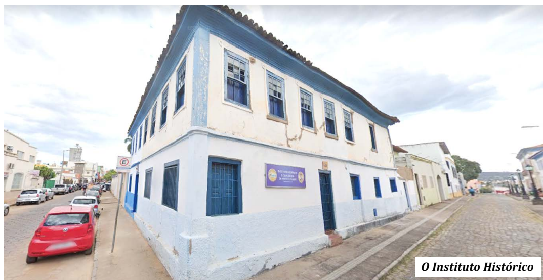
O Instituto Histórico

Infelizmente o nosso IHGMC não tem recebido a atenção que mere-