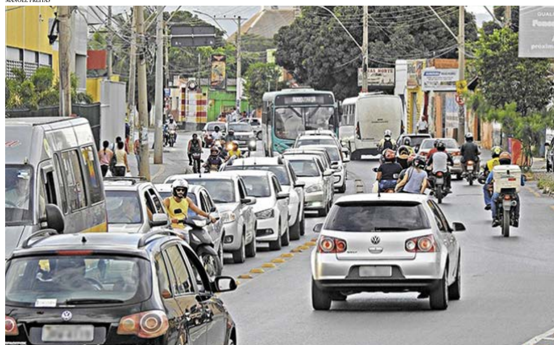
Anúncio foi feito ontem (23/4) pelo governador Romeu Zema; documento exigido atualmente é o de 2019

Minas Gerais prorroga para 1º de julho a exigência do Certificado de Registro e Licenciamento de Veículo (CRLV) de 2020. A decisão foi anunciada nesta sexta-feira (23/4) pelo governador Romeu Zema e é mais uma ação do governo mineiro em auxílio à população durante a pandemia.