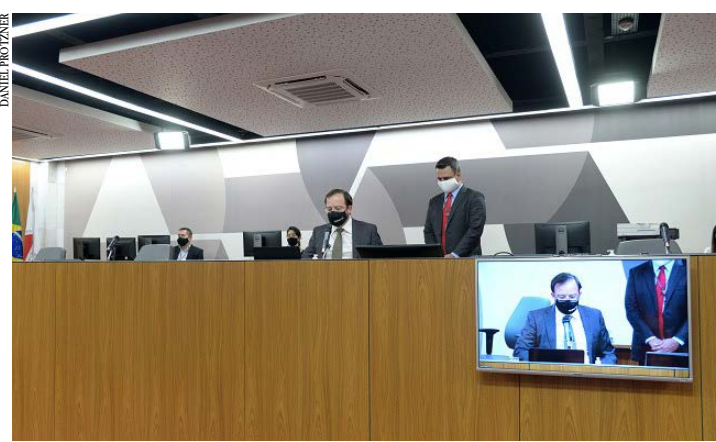
Além da Copasa, deputados miram na redução de impostos e pedem providências

acidentes provocadas por veículos em alta velocidade, trazendo insegurança aos moradores e demais motoristas. (GA)