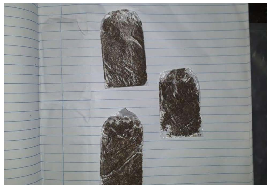
Maconha estava anexada na folha de um caderno