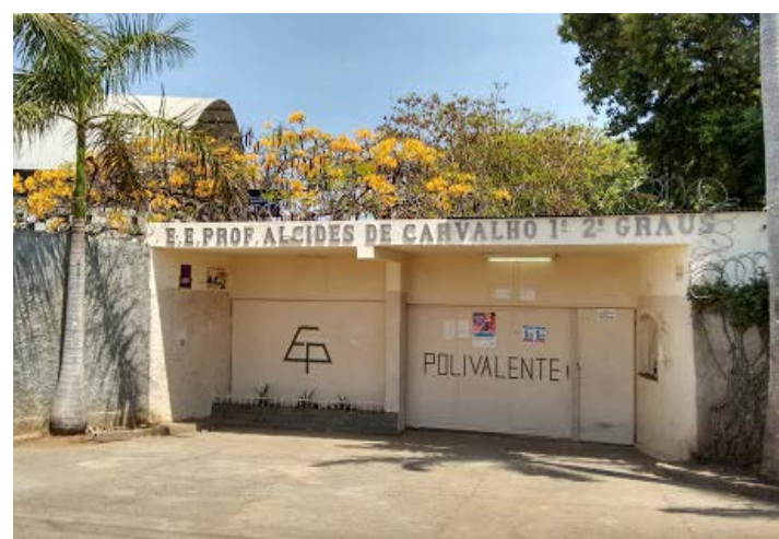
Escola fechada em Montes Claros: falta de recursos da rede pública para manter ensino será tema de audiência

Durante a reunião desta quinta, os senadores aprovaram quatro requerimentos com pedidos de esclarecimentos a ministérios, institutos e laboratórios responsáveis pela produção de