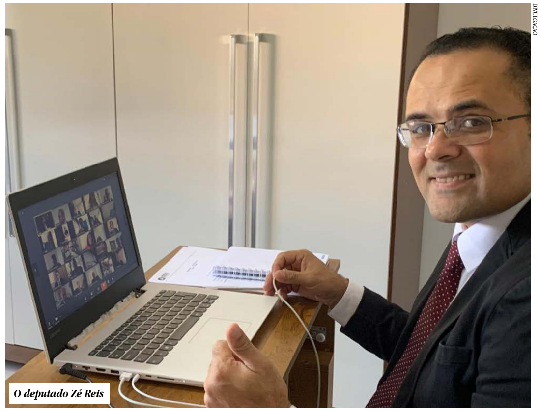
O deputado Zé Reis

mos e quando ele trouxe a demanda para ajudar o Grappa, de imediato pediu que fosse destinada a verba, até mesmo em reconhecimento ao trabalho realizado pelo Grappa ao longo de mais de 20 anos. O vereador Stalin Cordeiro agradeceu a sensibilidade do deputado e afirma que várias outras parcerias serão feitas sempre para ajudar Montes Claros, como o mais recente kit de abastecimento de água através do Idene.