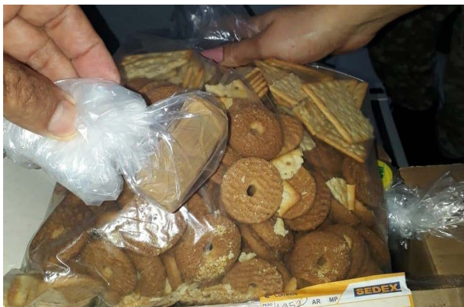
Celular estava dentro de um pacote de biscoitos

Ainda de acordo com a Sejusp, a direção do presídio instaurou um procedimento administrativo para apurar o fato. Um boletim de ocorrência também foi lavrado e o material apreendido foi encaminhado para a Polícia Civil, que investigará o caso.