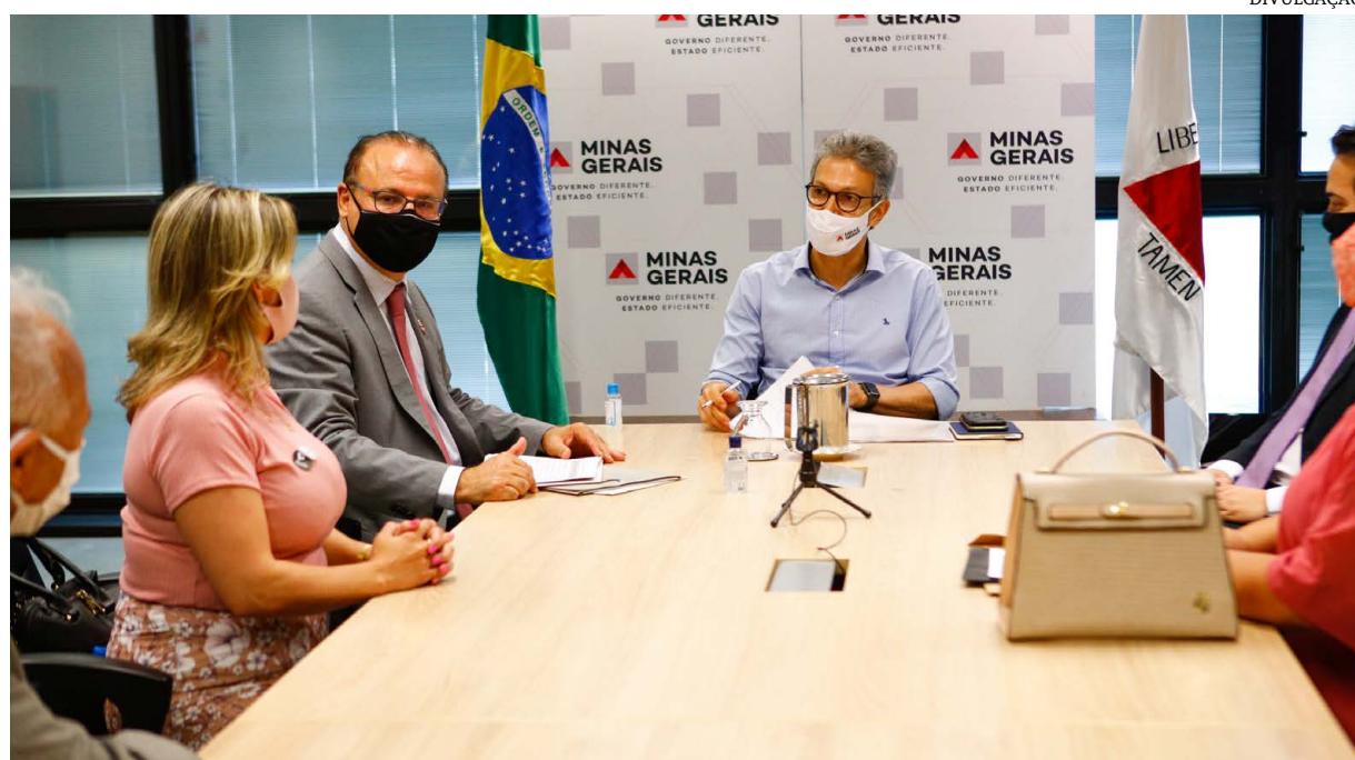
A reunião entre prefeitos, o parlamentar e o governador

Os prefeitos, vices e vereadores de diversos municípios norte-mineiros reuniram-se nesta quarta-feira (3), em Belo Horizonte, com o governador Romeu Zema, durante audiência especialmente marcada pelo deputado Gil Pereira. Devido às necessidades sanitárias impostas pelo momento, o encontro foi realizado com todos os cuidados e protocolos visando à preservação da vida.