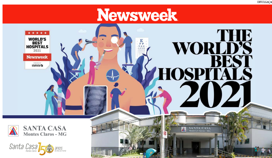
Publicação americana reconhece o hospital como um dos melhores do mundo

"Estamos colhendo os frutos de um trabalho feito em equipe. Parabéns, em especial, aos colaboradores e o corpo clínico que são merecedores deste reconhecimento. Quero também agradecer ao apoio de toda a população de Montes Claros e de todo norte de Minas Gerais, parlamentares e entidades de classe que tanto nos ajudam,