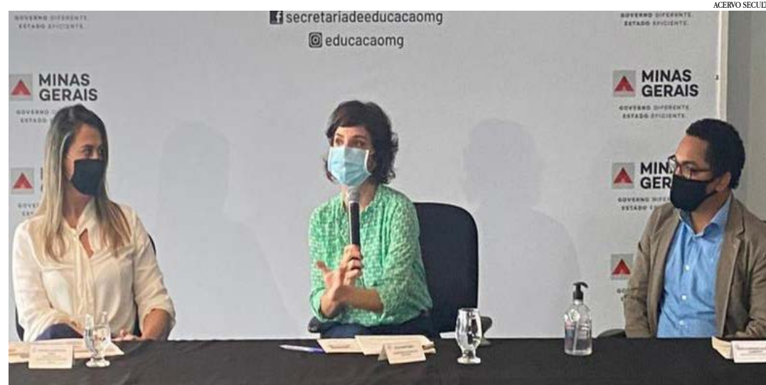
Programa Cultura Gerais terá cursos e oficinas voltados para elaboração e gestão de projetos

Qualificação, formação e profissionalização são os pilares do programa Cultura Geraes, iniciativa da Secretaria de Estado de Cultura e Turismo (Secult) para promover e democratizar o acesso dos trabalhadores da Cultura aos mecanismos de fomento em Minas Gerais.