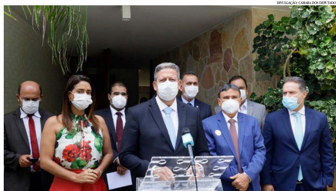
Será criado grupo para acompanhar fabricação de vacina no Brasil

"[Há] necessidade de um cronograma mais avançado para as vacinas, orçamento para leitos. O presidente [da Câmara, Arthur Lira (PP-AL)] se comprometeu a votar rapidamente os temas relacionados à covid, em relação às medidas provisórias, dando prioridade para as votações do Congresso Nacional", argumentou Casagrande. (Agência Brasil)